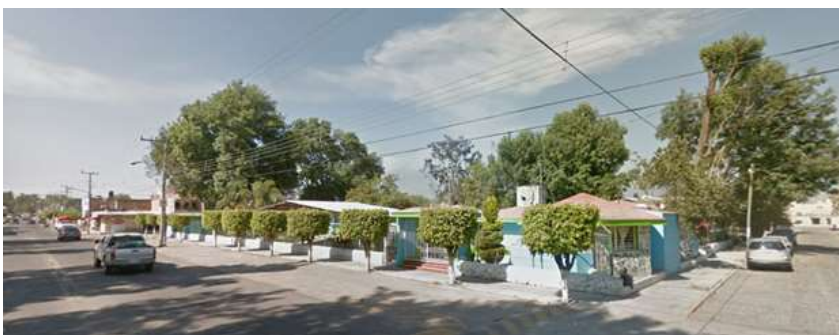
Imagen 1. Jardín de Niños Zapotlán.

Según Castolo, F. G. (2021) Zapotlán el Grande es un municipio pequeño, con poco más de quinientos kilómetros cuadrados de superficie, situado al sur de Jalisco, en la región occidente de México. Su agradable clima se debe a elementos naturales que embellecen sus alrededores, ya que se sitúa en un valle cuyos alrededores los cubre bello bosque y lo