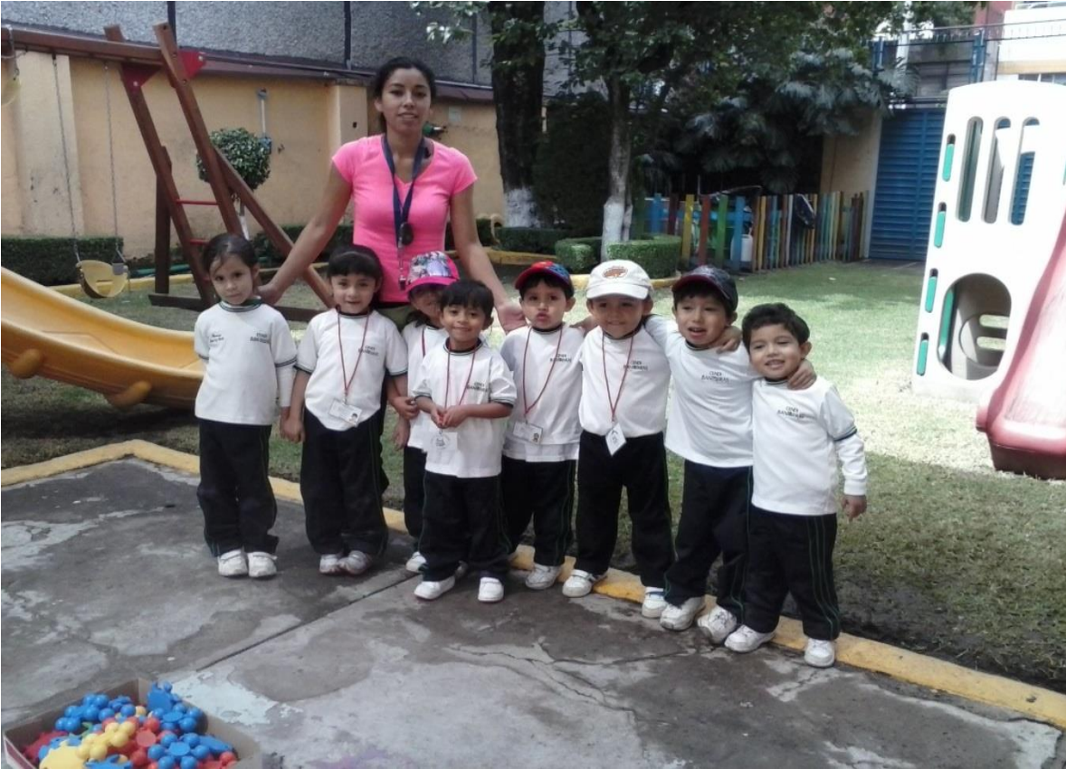
Foto 1 En esta foto se presenta el grupo con el que se llevara a cabo las actividades y la maestra de educación física apoyándonos en las actividades