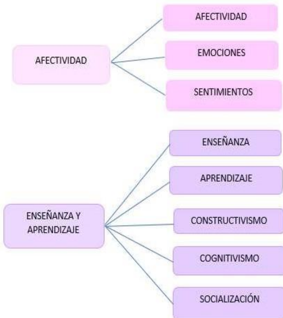
Figura 2: Esquema de categorías y subcategorías de análisis