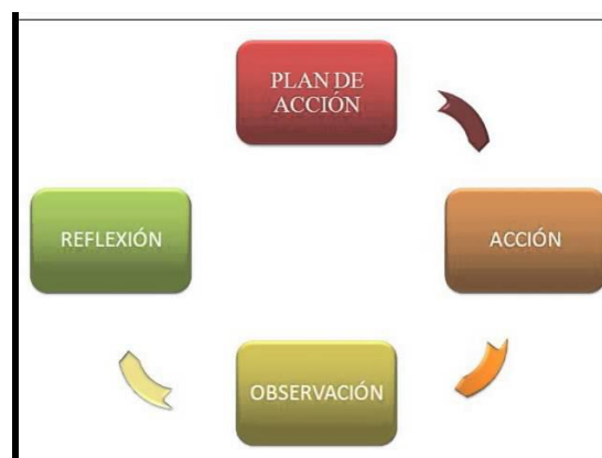
Imagen2.-Ciclos de la investigación-acción.

A continuación muestro los ciclos de la investigación-acción: