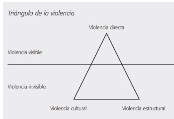
Imagen 1. Triángulo de la violencia

Nota: Recuperado de (Leñero, 2010, p. 118).