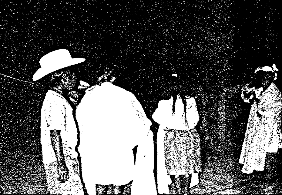
PARTICIPACION DE LOS NIÑOS EN FESTIVAL DE CLAUSURA.