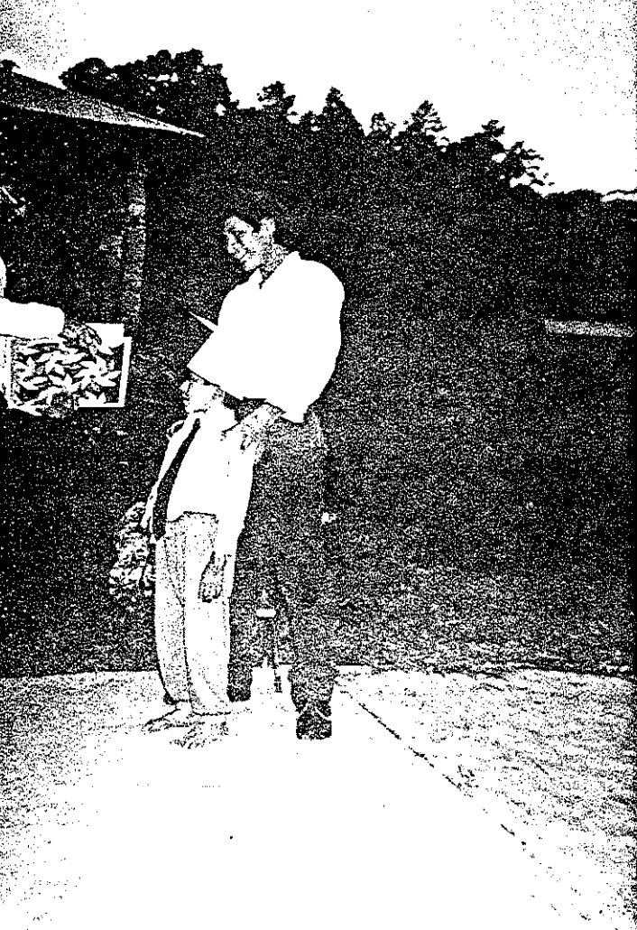
ENTREGA DE DOCUMENTACION A LOS PADRES DE FAMILIA.