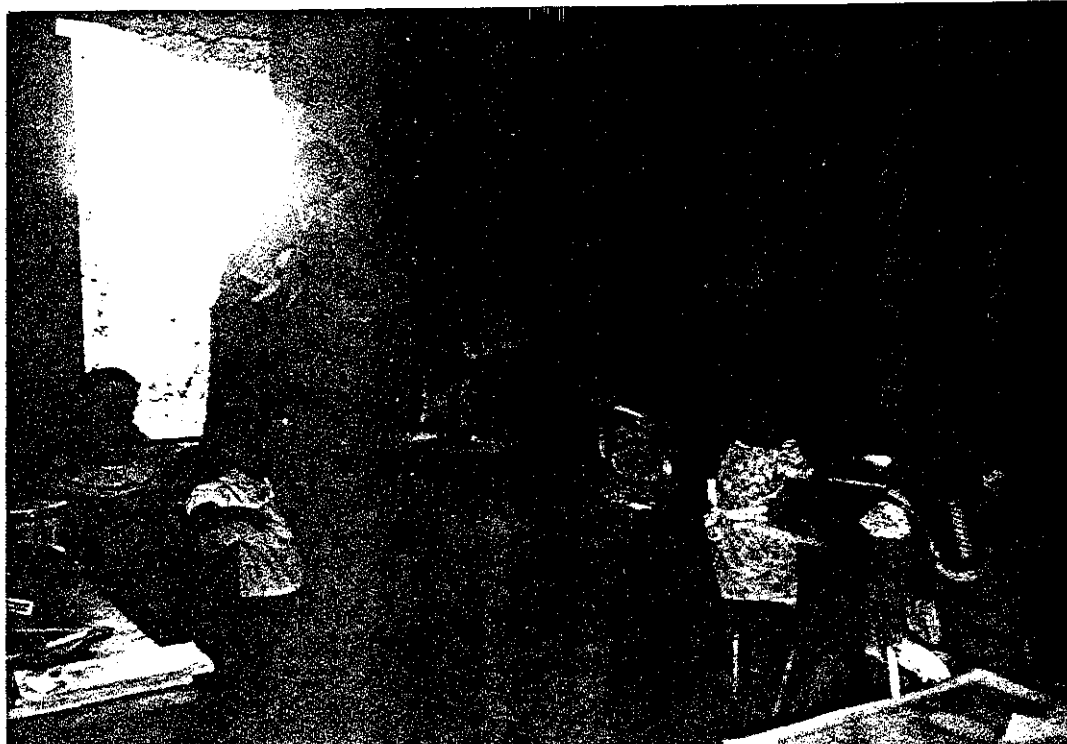
LABORANDO DENTRO DEL AULA.