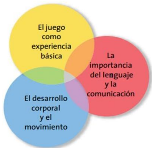
Figura 4.3. Esquema de los aprendizajes clave en educación inicial.

Figura 4.3. Esquema de los aprendizajes clave en educación inicial. Secretaría de Educación Pública. (2017). Aprendizajes Clave para la Educación Inicial. Ciudad de México. p. 69. COPYRIGHT de Secretaría de Educación Pública, 2017.