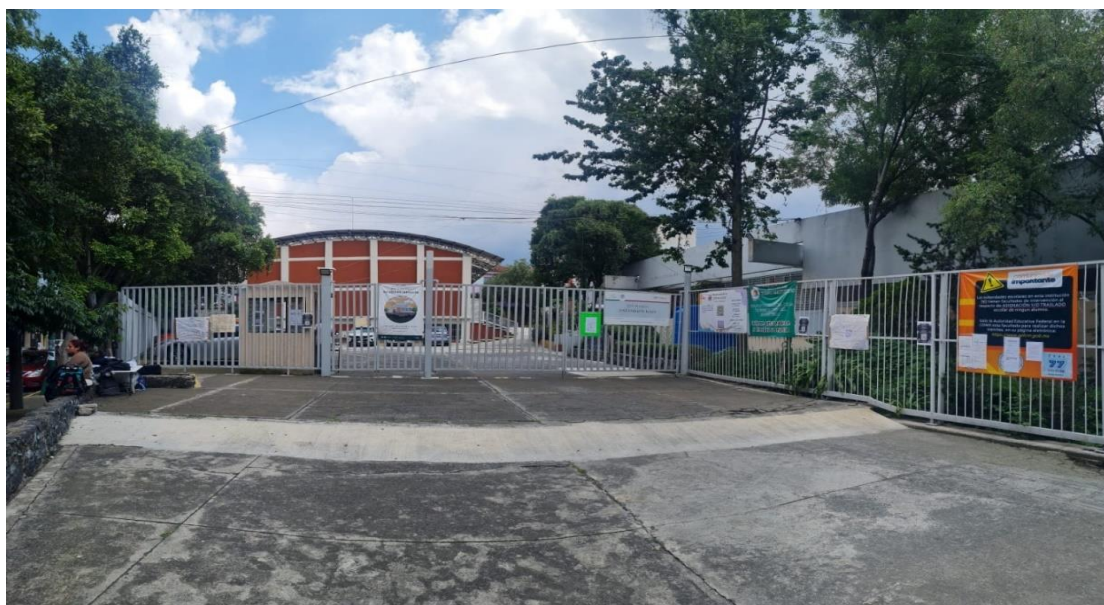
Figura 2: Vista exterior de la entrada de la escuela

Como resultado de la dinámica que existe entre la escuela y el contexto de su alrededor, hay un incremento de negocios relacionados con el sector educativo como es la papelería; esto es porque la escuela se encuentra en un lugar céntrico, por lo que cuenta con la presencia de muchas personas que transitan alrededor del mismo. Esto permite su fácil acceso, puesto que es una escuela con una dinámica social amplia. Visualmente la institución se percibe de la siguiente manera en la parte exterior: