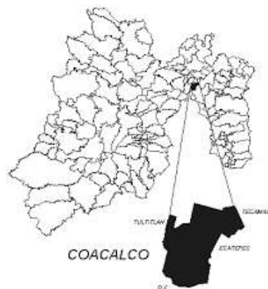
Figura 2. Mapa del Estado de México, ubica el Municipio de Coacalco de Berriozábal. 37