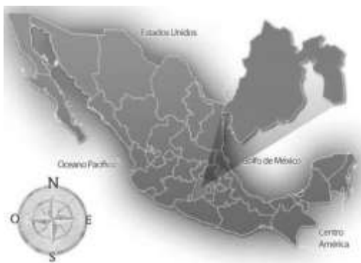
Figura 1. Mapa de la República Mexicana, ubica el Estado de México. 36

El municipio de Coacalco se localiza en la parte central del Estado de México, el cual limita en los municipios de Tultitlán, el sur de Ecatepec y de la Ciudad de México con una distancia de la ciudad de 85 km y el cual aún cuenta con tres pueblos, nueve colonias, 57 fraccionamientos con un total de 69 comunidades con un total de 293,444 habitantes.