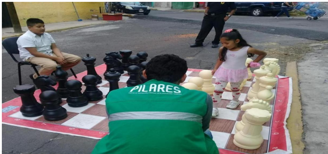
Brigada Lomas de la Estancia en acción 2019 foto propia.