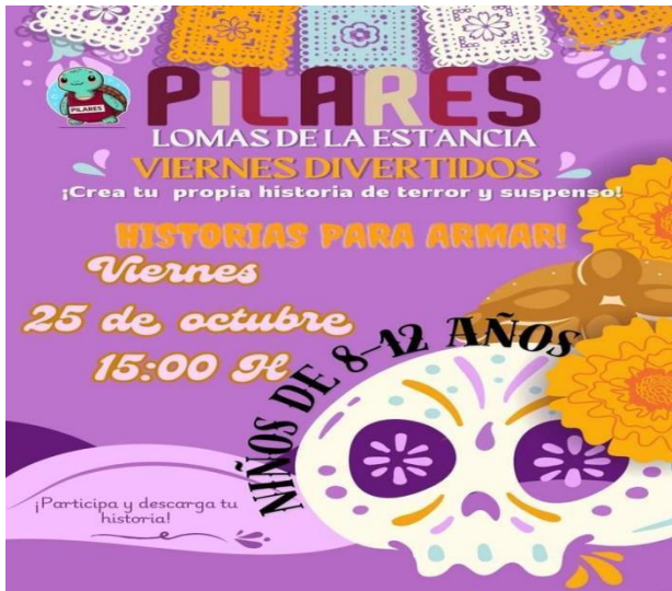
Folleto 5.- Historias para armar