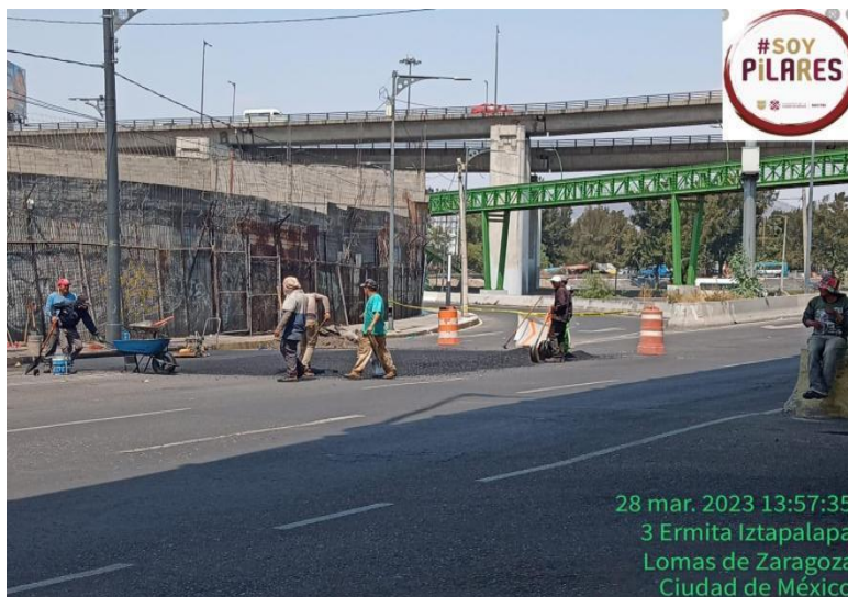
Foto 12 El trabajo de gestión de los espacios públicos para beneficio de la comunidad PILARES Lomas de Zaragoza. el LCPO Ivan logró la colocación de reductor de velocidad en ambos lados de la calzada Ermita.