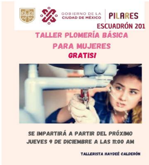
Folleto 1.- Curso de Plomería