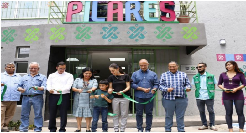
Foto 10 INAUGURACIÓN PILARES CERRO DE LA ESTRELLA 2019.