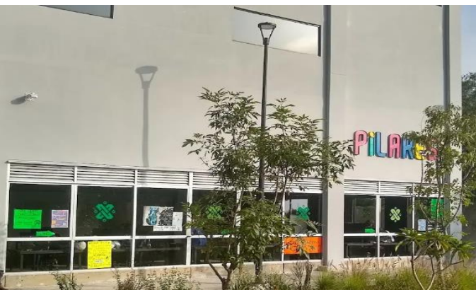
Foto 8 PILARES Lomas de la Estancia