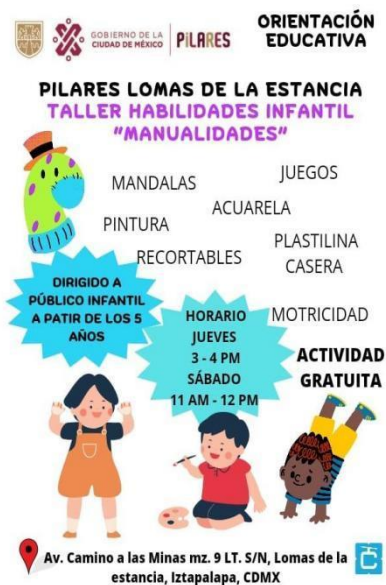
Folleto 2.- Taller de habilidades infantiles