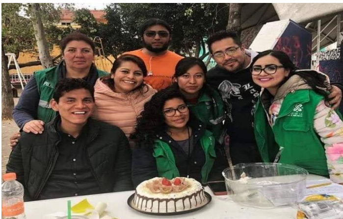
Foto 5 Festejo organizado para la brigada Benito Juárez, parque Rebeca Acahualtepec II sección. 2019 foto propia.