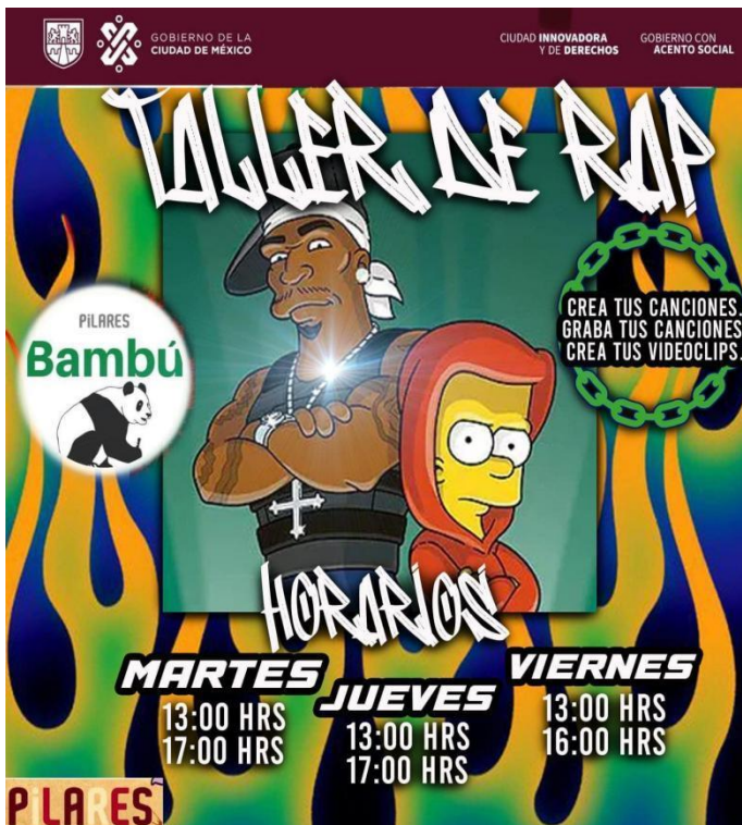
Folleto 14.-Taller de rap