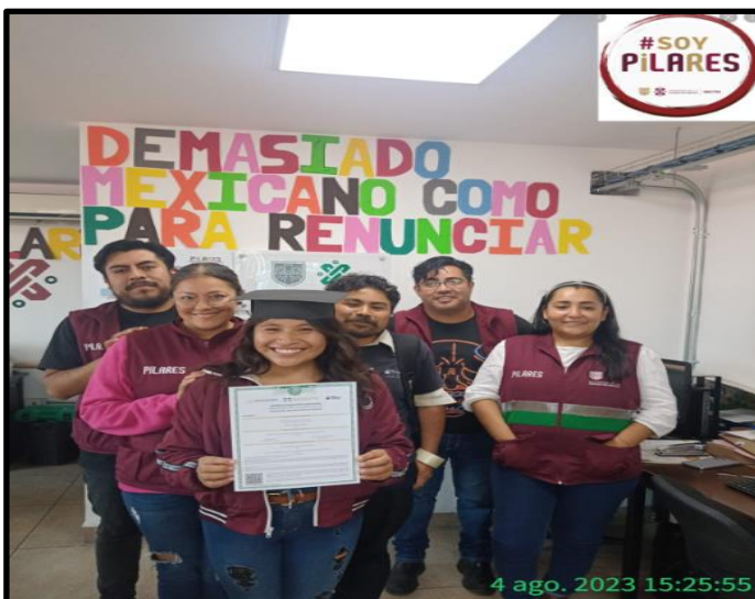
Foto 6 Tejiendo historias, certificación INEA secundaria, fotografía cortesía Lomas de Zaragoza LCPO Ivan