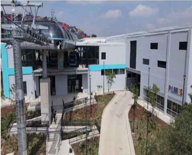
Foto 7 Estación Lomas de la Estancia y el PILARES que lleva el mismo nombre, (Semovi, 2020)