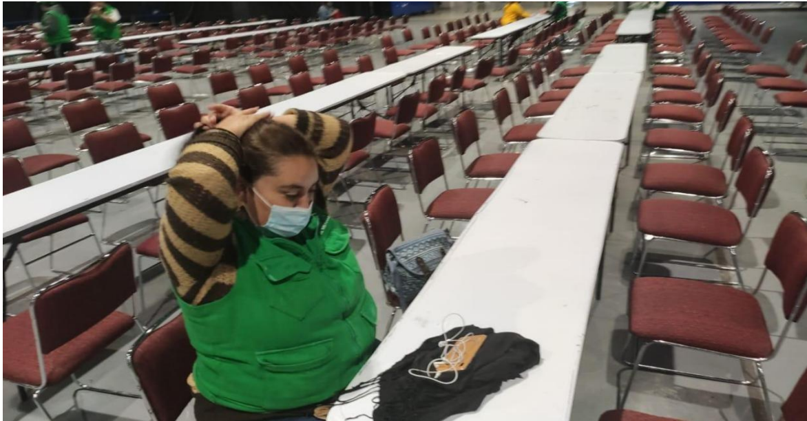
Preparándose para la jornada 2021 foto propia. Operativo Vacunación 2021 foto propia.

Durante el 2020 se abrió otra puerta de posibilidades; nacería lo que se mencionó como PILARES digital o PILARES en línea, era un reto muy grande y ambicioso, los que descubrían formas más sencillas de hacer este ejercicio, lo transmitían a otros con menos destreza, era el nacimiento de una gran fuerza de PILARES, no sólo se atendía a personas de la CDMX con esta nueva modalidad, sino a los diferentes estados de la república mexicana; PILARES, extendió su presencia más allá de sus fronteras, más allá del Ecuador.