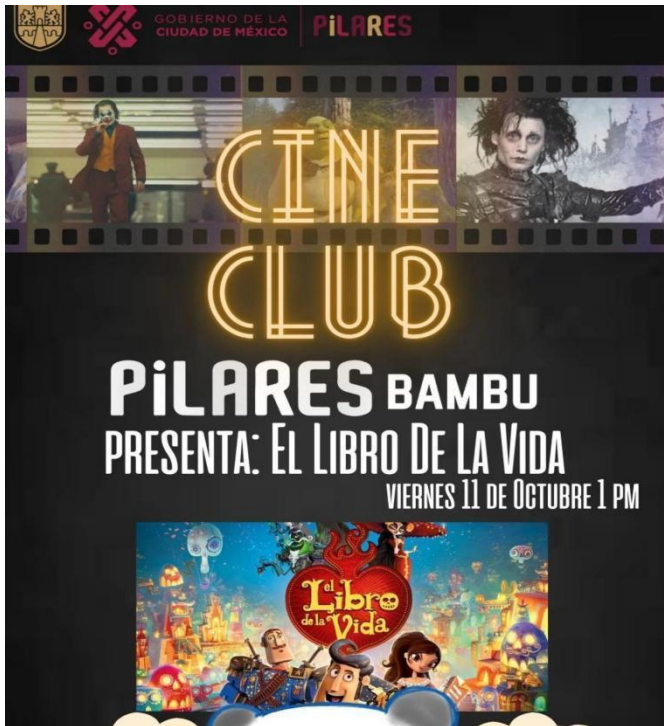
Folleto 9.- Cine club