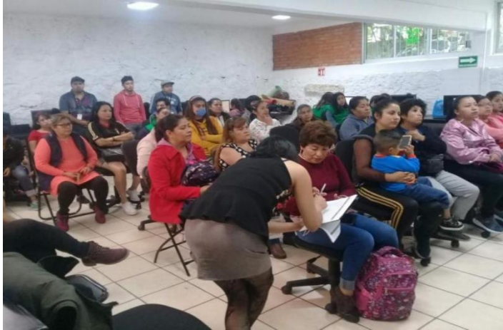
Foto 4 Reunión informativa con vecinos Santiago Acahualtepec 2019