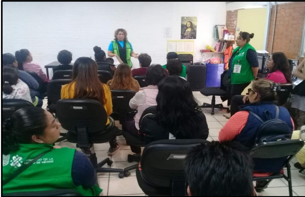
PILARES Acahualtepec, La ciberescuela como salón multigrado, fotografía cortesía LCPO Ivan.

También los conversatorios o actividades que se imparten son para todas y todos los usuarios presentes, se realiza una breve ponencia por talleristas, docentes o algún usuario que preparó el tema, se proyecta en algún espacio de la ciberescuela y todos los presentes son parte de la plenaria o retroalimentación.2.4 El ser y el deber ser de la ciberescuela de los PILARES