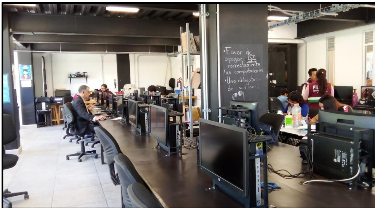
Ciberescuela PILARES Lomas de la Estancia, fotografía propia 2023

Como coordinador de Lomas de la Estancia y de Bambú, me doy cuenta que las ciberescuelas de cada espacio, crean sus propias historias, su comunidad, los logros de su comunidad son únicas por su gente, no son salones de una sola sesión, como ya se mencionó pueden converger diferentes disciplinas al mismo tiempo, ser salones de debate, de festejo, de asesorías, de trámites, de regularización, son espacios para escuchar al otro, o son mini salas de cine.