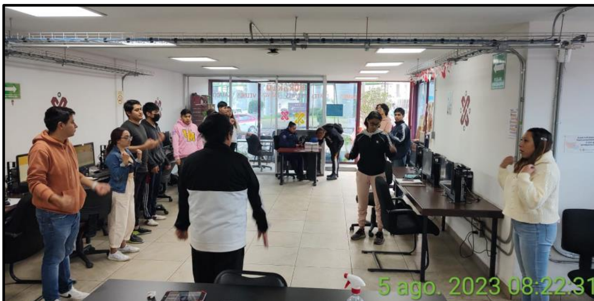
Actividad física antes de la clase de escuela de Código 2023