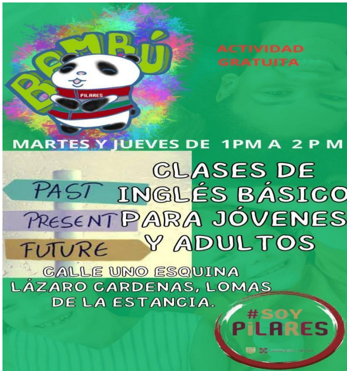
Folleto 13.- Taller de inglés