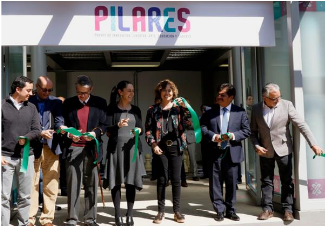
Foto archivo, inauguración del primer PILARES Richard Wagner 28 de enero 2019,

El primer espacio de PILARES “Richard Wagner” se inauguró el lunes 28 de enero del 2029, por la Jefa de Gobierno de la Ciudad de México en la colonia Vallejo, de la alcaldía Gustavo A. Madero. En ese momento se anunció que la Ciudad de México contaría con 300 centros comunitarios PILARES, que se ubicarían preferentemente en zonas de escasa oferta cultural, con el objetivo de unir a la sociedad a través de actividades culturales, educativas y deportivas y con miras a disminuir la violencia, fomentar la autonomía económica y propiciar una convivencia de paz. A la fecha son 61 en la alcaldía de Iztapalapa y 297 en toda la ciudad.