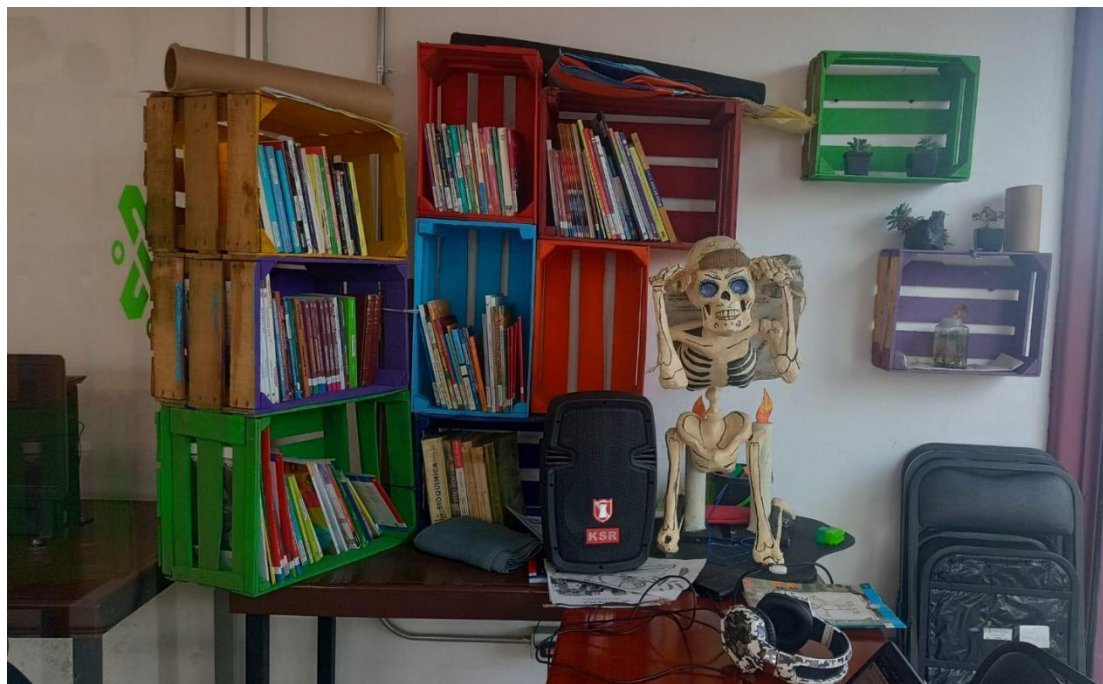
Sala de lectura del PILARES Lomas de Zaragoza

este sitio puede ser aprovechado para desarrollar actividades que no necesariamente requieren el uso de una computadora.