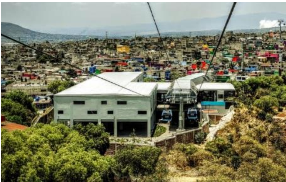
Estación Lomas de la Estancia, (Semovi, 2020)

No es una misma obra, es un diseño incluyente, que comparte un mismo predio: la estación del Cablebús se gestiona en la Secretaría de Movilidad, (SEMOVI), y el PILARES a través de la Secretaría de Educación Ciencia y Tecnología e Innovación (SECTEI).