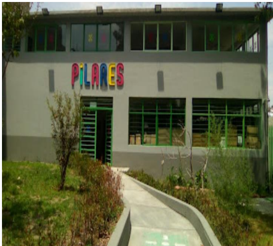
Foto 2.- PILARES BAMBÚ inaugurado en 2019