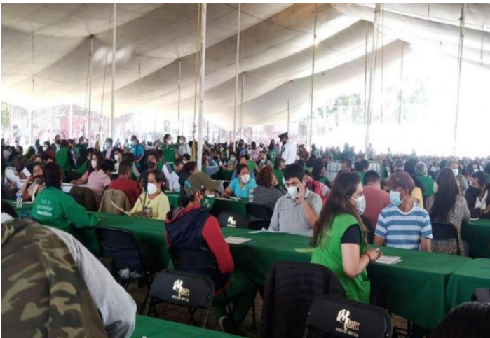
Foto 9 Operativo Vacunación 2021