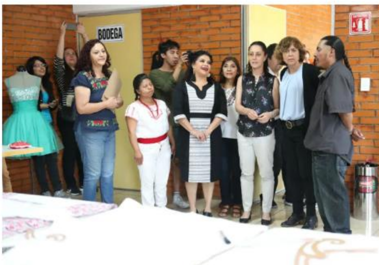
Inauguración de PILARES Acahualtepec, con la jefa de gobierno Claudia Sheinbaum, la alcaldesa de Iztapalapa, Clara Brugada y los LCPOs Sofía y Mauricio, 25 de febrero 2019

PILARES, la estrategia 333, más la conjunción y aportación de la licenciatura de educación indígena -en mi caso, porque no para todos los LCPO fue igual-, me permitió recorrer, explorar y ubicar en la zona geográfica intervenida cuáles serían los espacios públicos a recuperar para la creación del edificio que albergará un PILARES, o encontrar instalaciones en desuso para el mismo fin, o los edificios con ciertas características arquitectónicas que se pudieran ser utilizadas como PILARES, como sucedió con el primer PILARES inaugurado en Iztapalapa, Acahualtepec, que de ser un centro social, se reacondicionó para dicho fin.