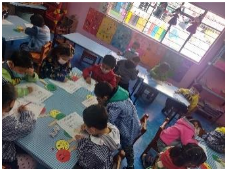
Actividad con emojis en palitos de paleta.