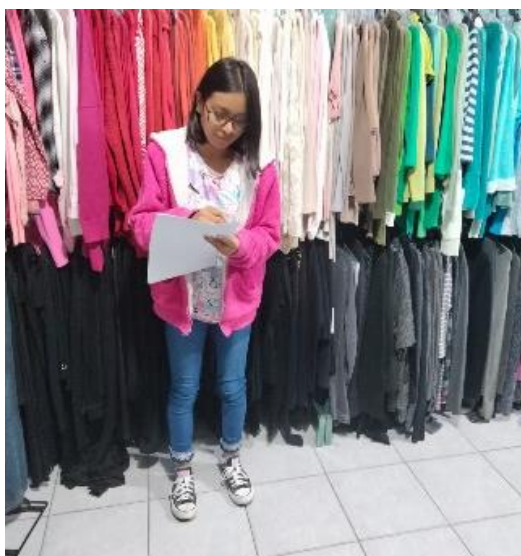
Encuestas a la comunidad.