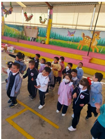
La aplicación de la ludoteca