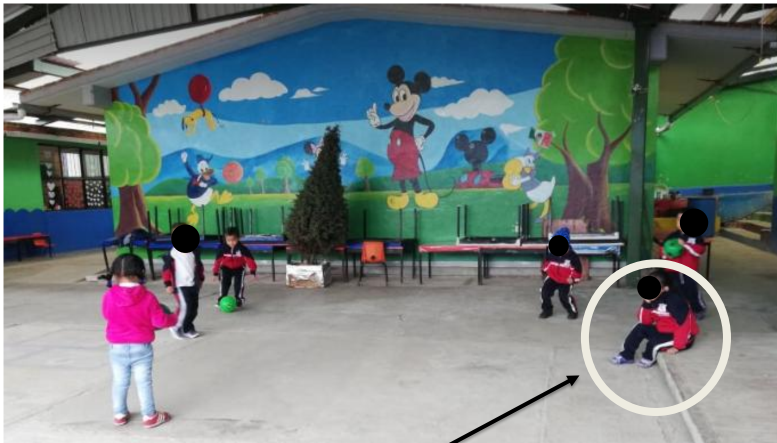
Alumna de primer Grado no logra integrarse en las actividades de la docente