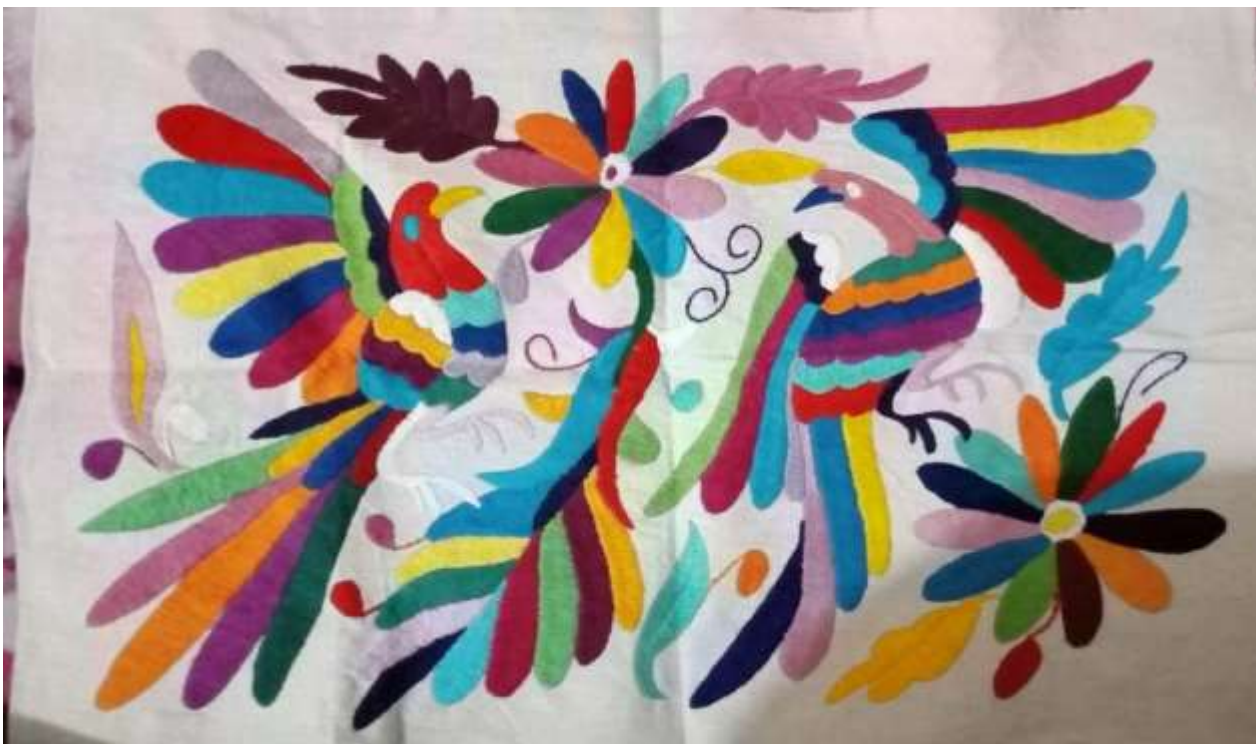
Nota: Cuarto de metro de colores, fotografía tomada por Rojas (2021).