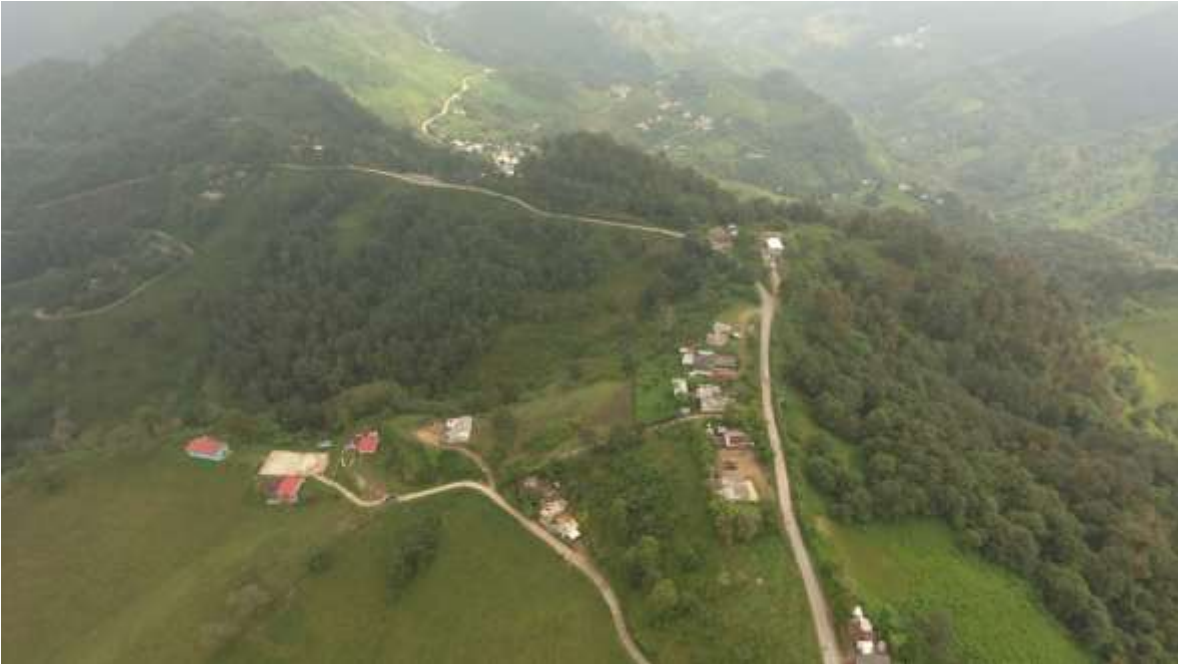
Nota: Fotografía de la comunidad de El Lindero.