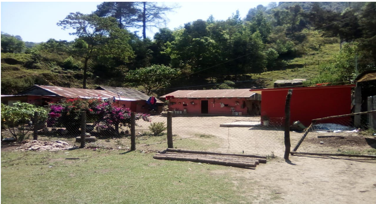
( 2 ) Casas que existen en la comunidad y en las cuales habitan los alumnos.