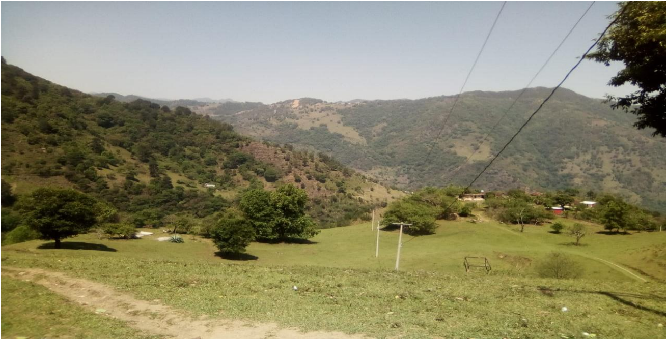
( 1 ) Foto de la comunidad de El Mahuaquite.