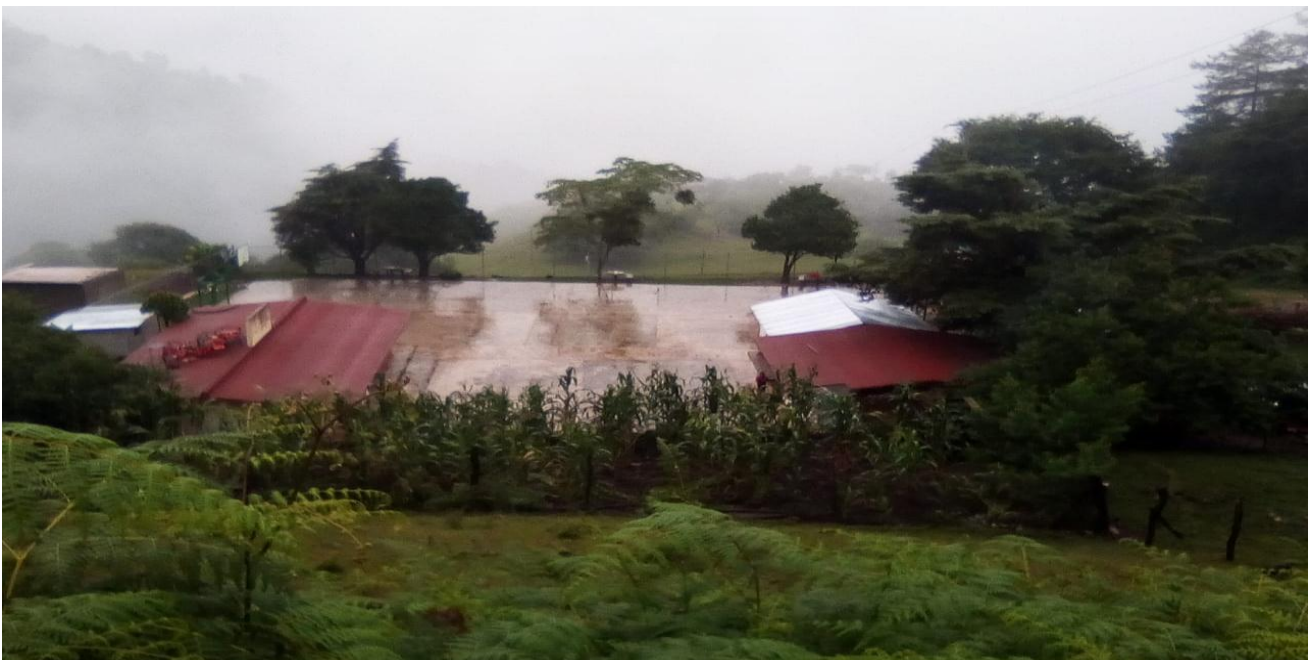
( 4 ) Imagen del techo y la parte posterior de la primaria.