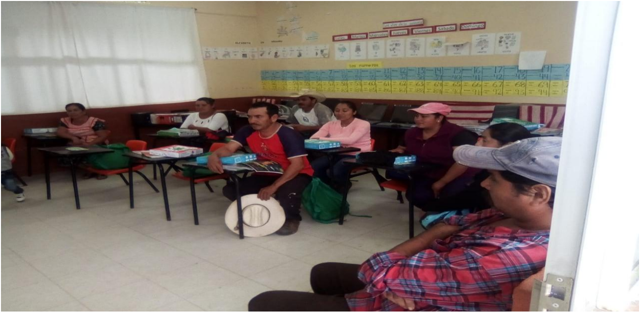
(3) Padres de familia de los alumnos que asisten a la Primaria