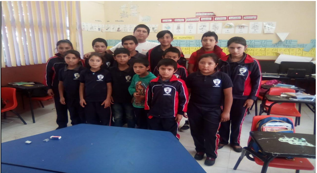
( 8 ) Alumnos con el director.