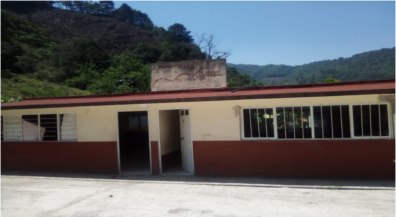
( 5 ) Fachada de la primaria.