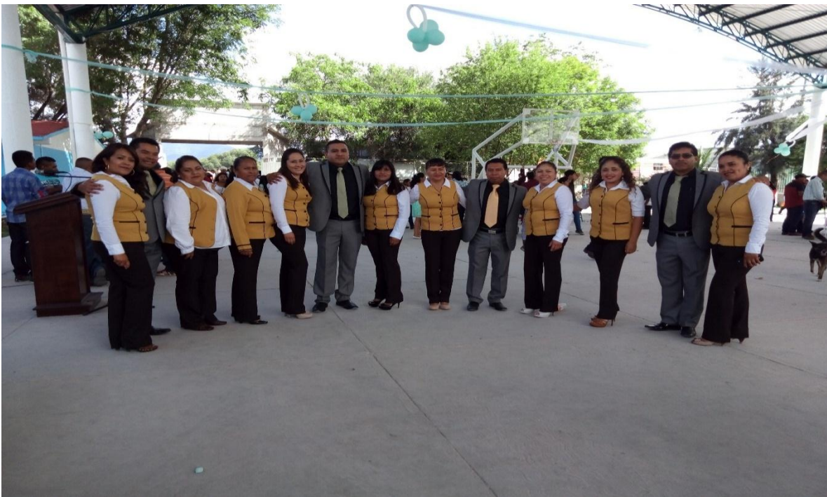
Anexo 5 (personal docente Escuela Primaria “Año de Zaragoza”)