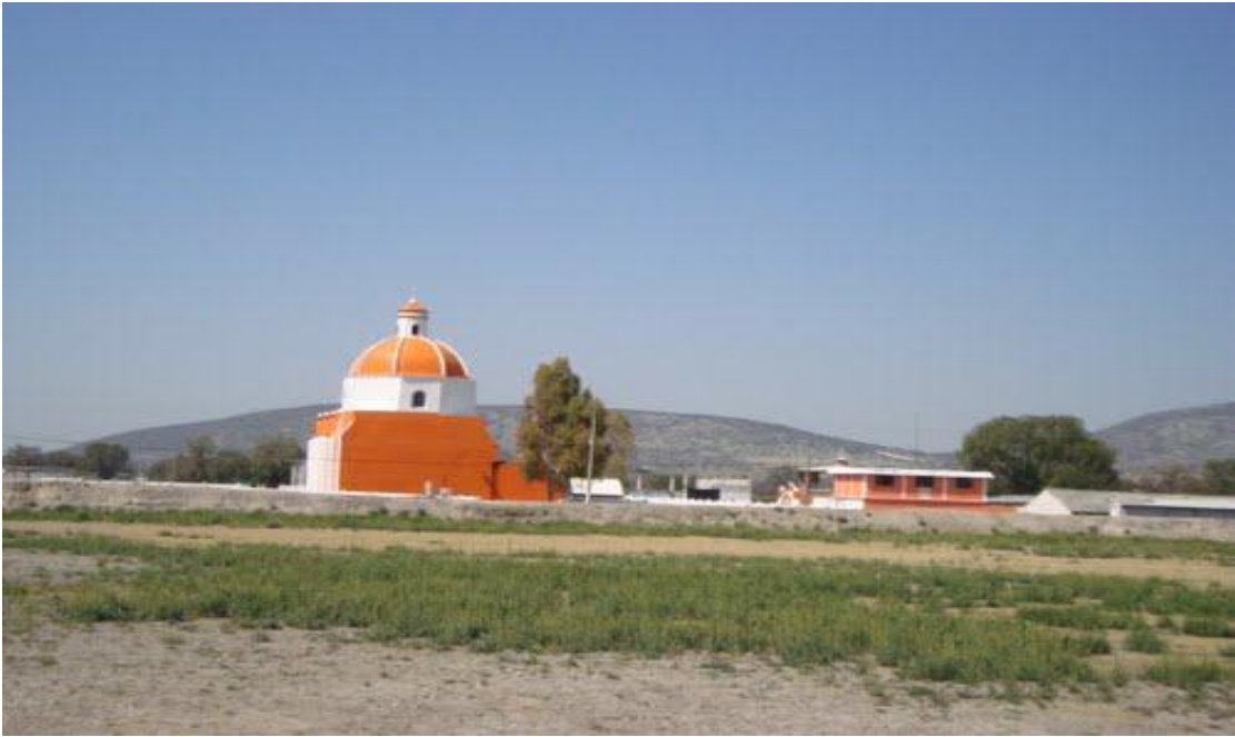
Anexo 2 (Iglesia de la comunidad)