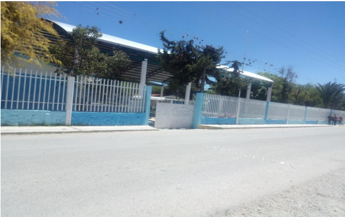
Anexo 3 (Escuela Primaria “Año de Zaragoza”)