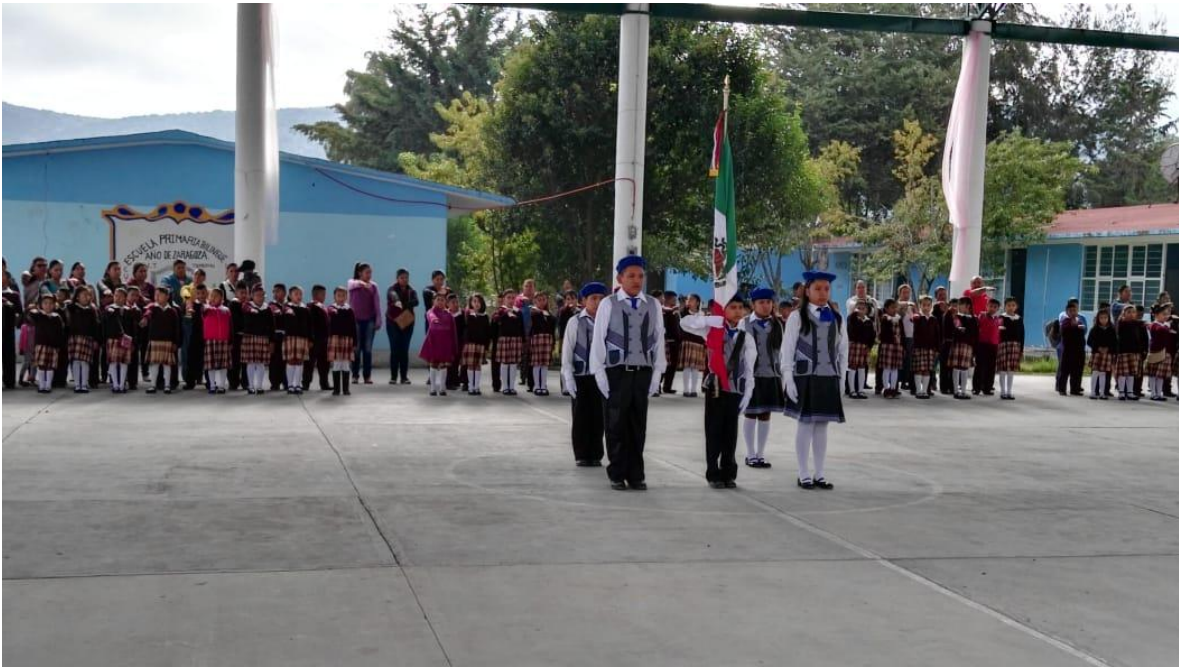
Anexo 4 (alumnos Escuela Primaria “Año de Zaragoza”)