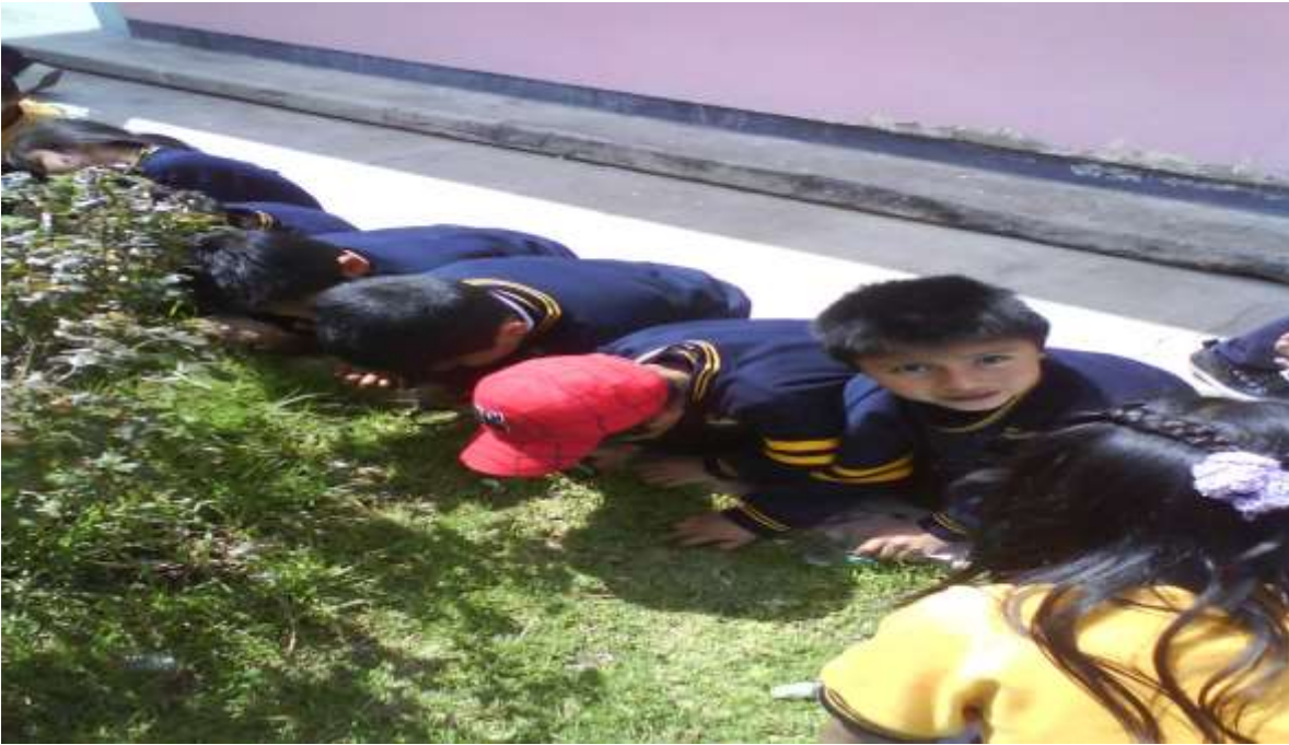
FOTO 3. Observación y reconocimiento de los seres vivos de su contexto como los caracoles.