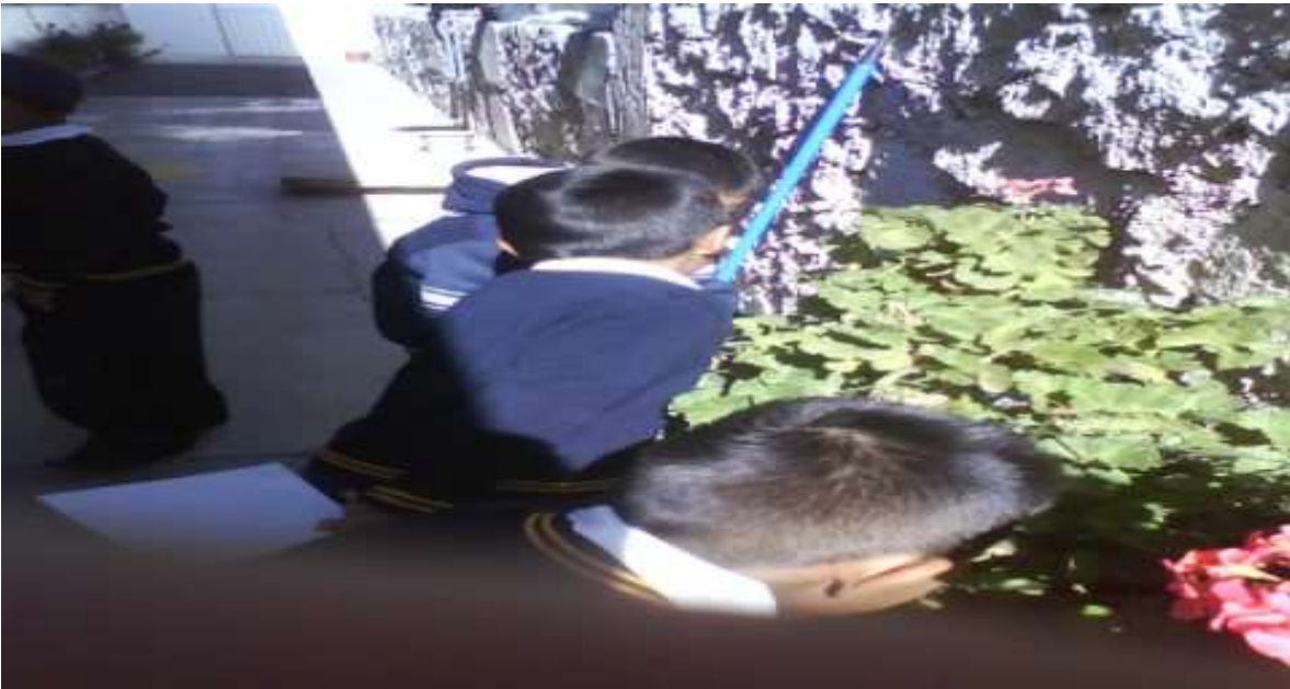
FOTO 1. Observación de las plantas de su localidad para identificar lo que está rodeado en su entorno.