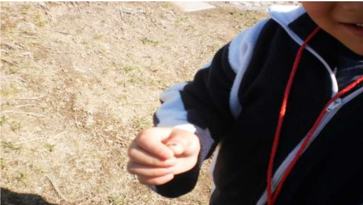
FOTO 2. Salieron a observar las hormigas.