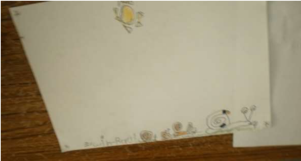
Foto 7. Es una evidencia de un registro de lo que un niño observó de los caracoles.