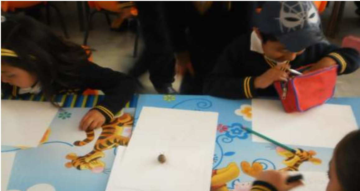
Foto 8. Observación, directa de los caracoles realizando un registro gráfico.