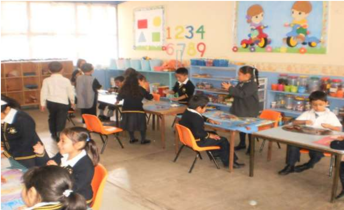
FOTO 5. Con material manipulable masa realizando sus tortugas.