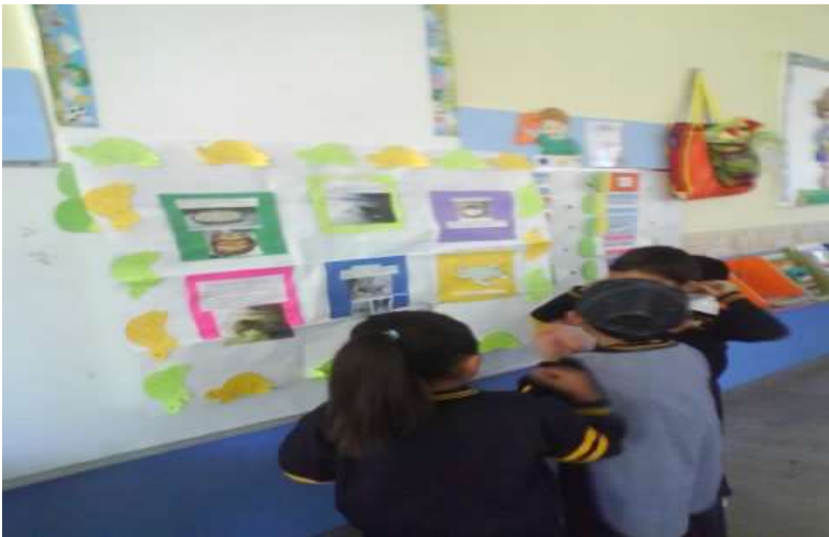
FOTO 6. Exposición de las tortugas por los niños guiándose de un mural.