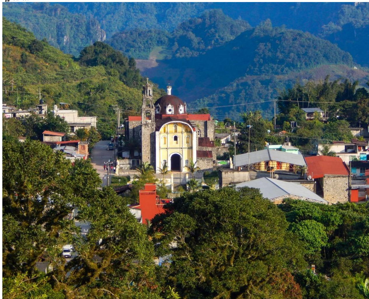
Anexos 1: Fotografía de la comunidad de Nanacatlán Zapotitlán donde se puede apreciar la iglesia.