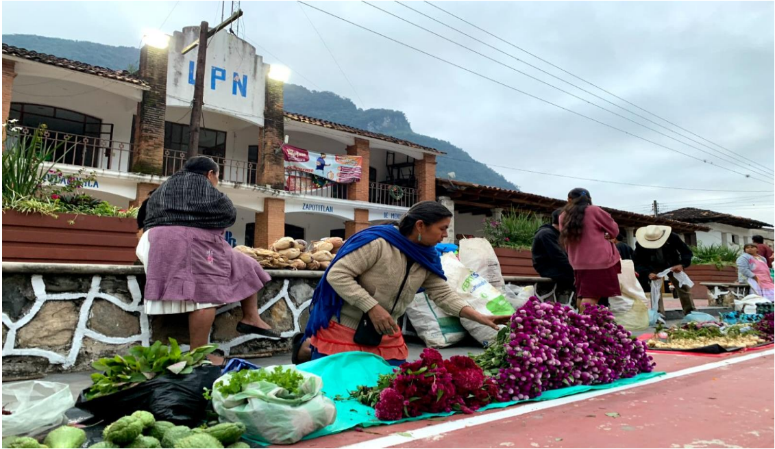
Apéndice C: 1 de noviembre día de los grandes, altar adornado con flores de compaxúchitl, pata de león, palma, diferentes frutas, ofrenda con alimentos que les gustaba en vida los muertitos.