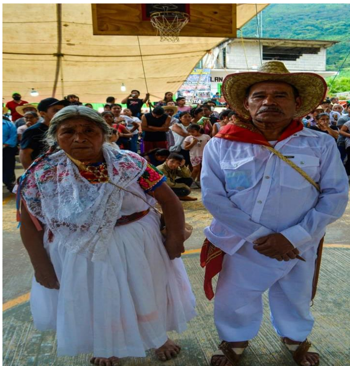
Anexo 3. Feria Santiago Apóstol se puede apreciar la danza de los Santiagos.