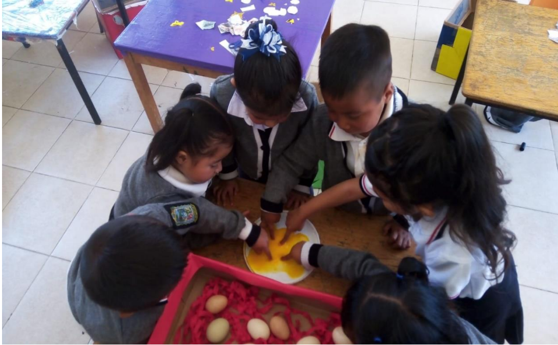
Anexo 13. Actividad del huevo