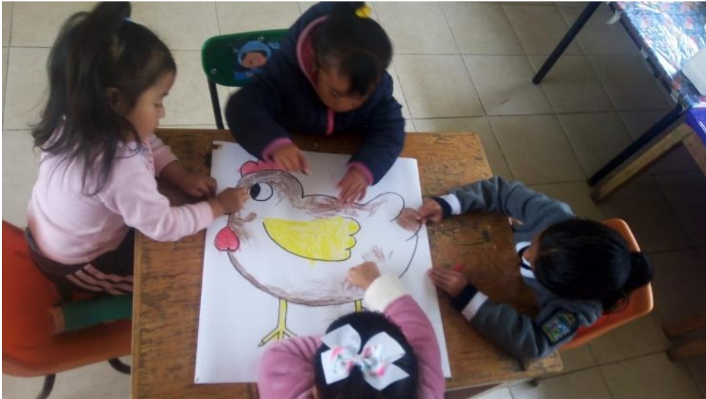
Anexo 21. Fortalezas y áreas de oportunidad de la primera sesión