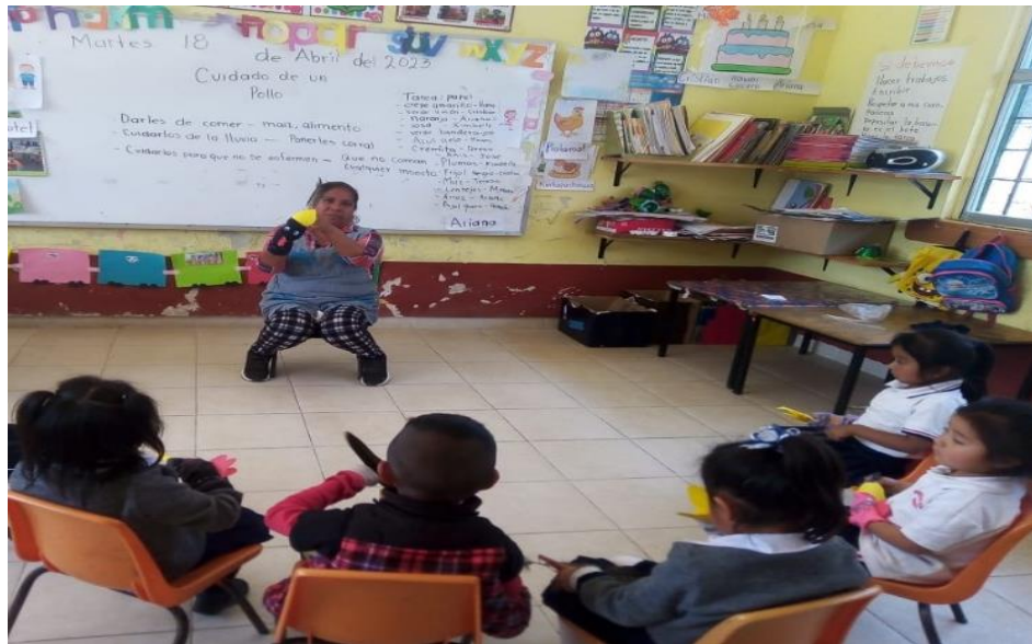
Anexo 25. Fortalezas y áreas de oportunidad de la Quinta sesión