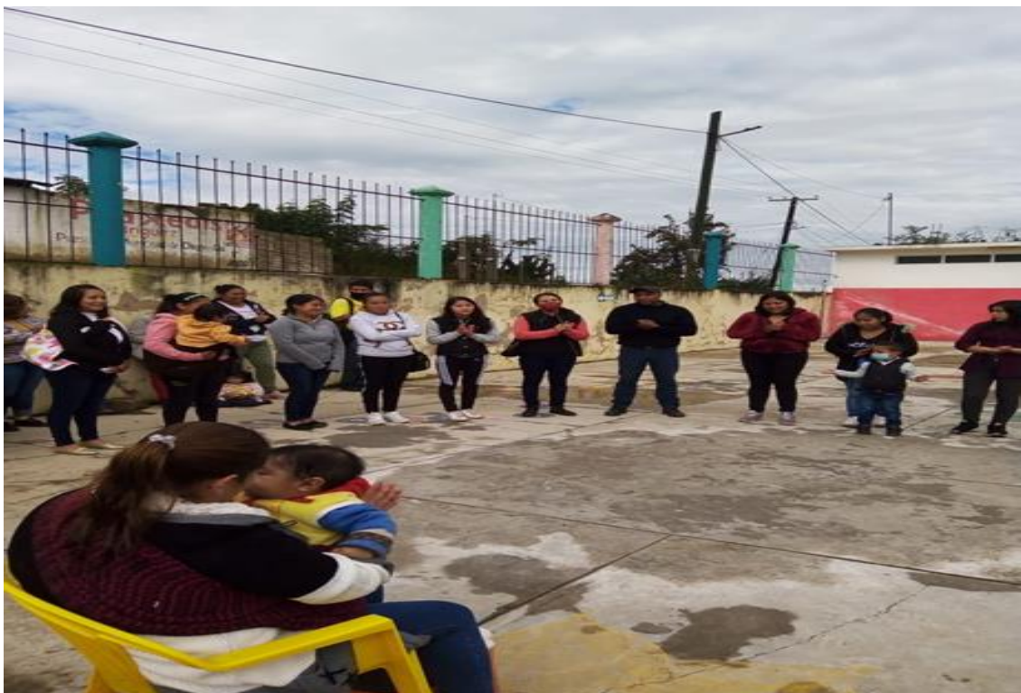
Anexo 8. Comité de asociación de padres de familia.