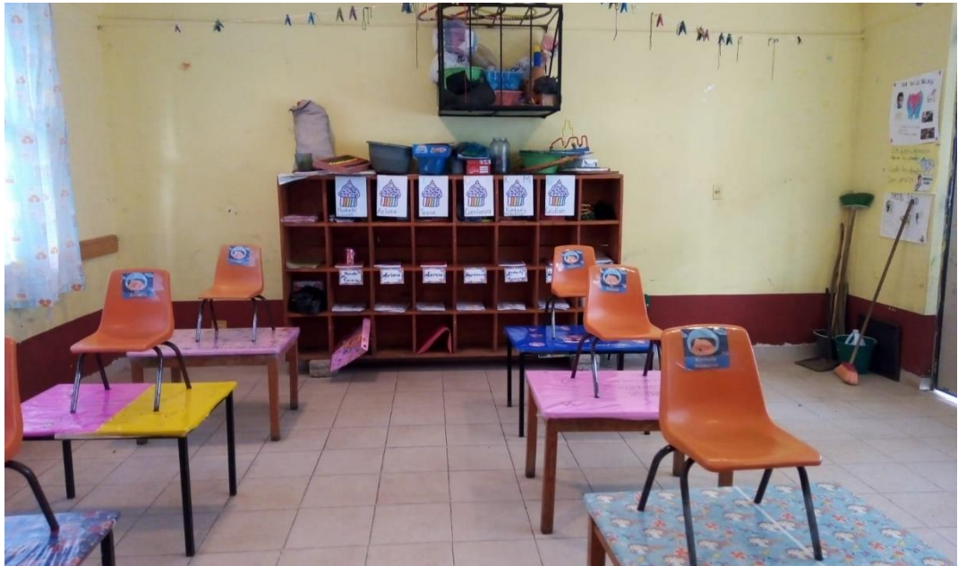
Anexo 9. Aula escolar de primer grado grupo A.