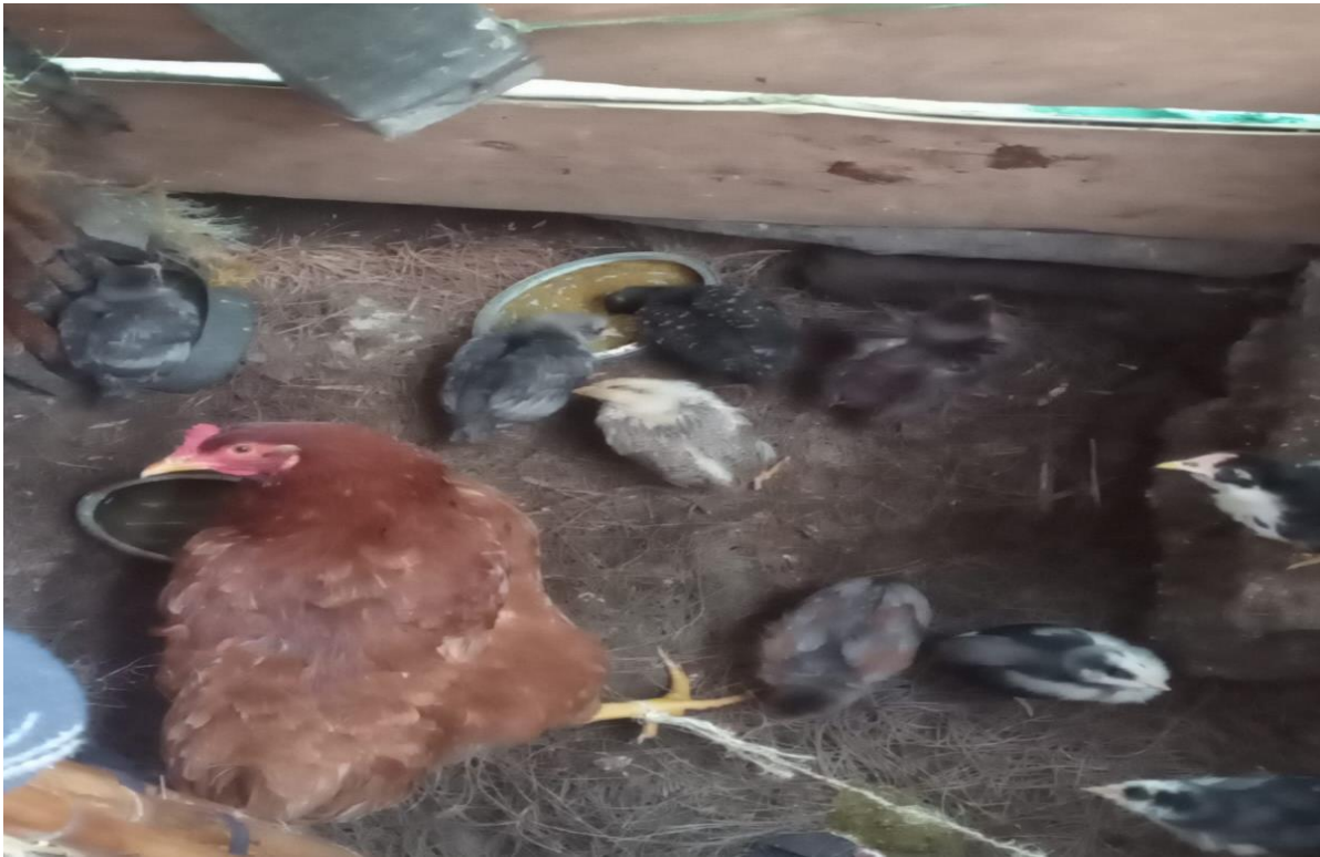
Anexo 3. Practica cultural, crianza de pollos