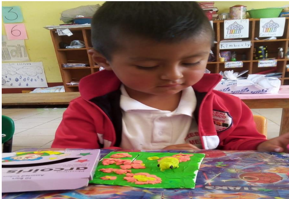
Anexo19. Elaboración de maqueta