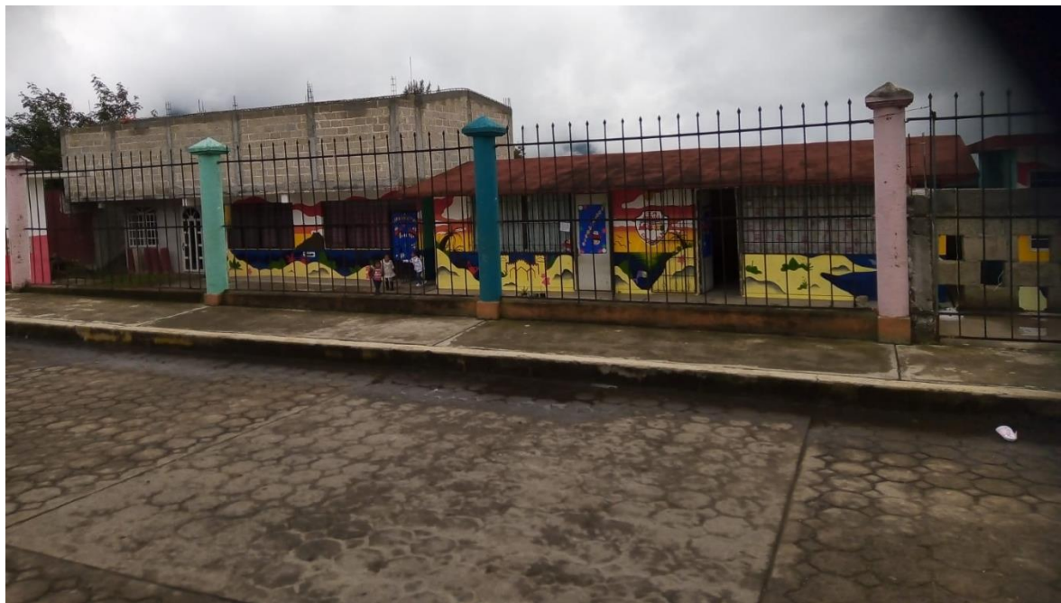
Anexo 6. Escuela preescolar México