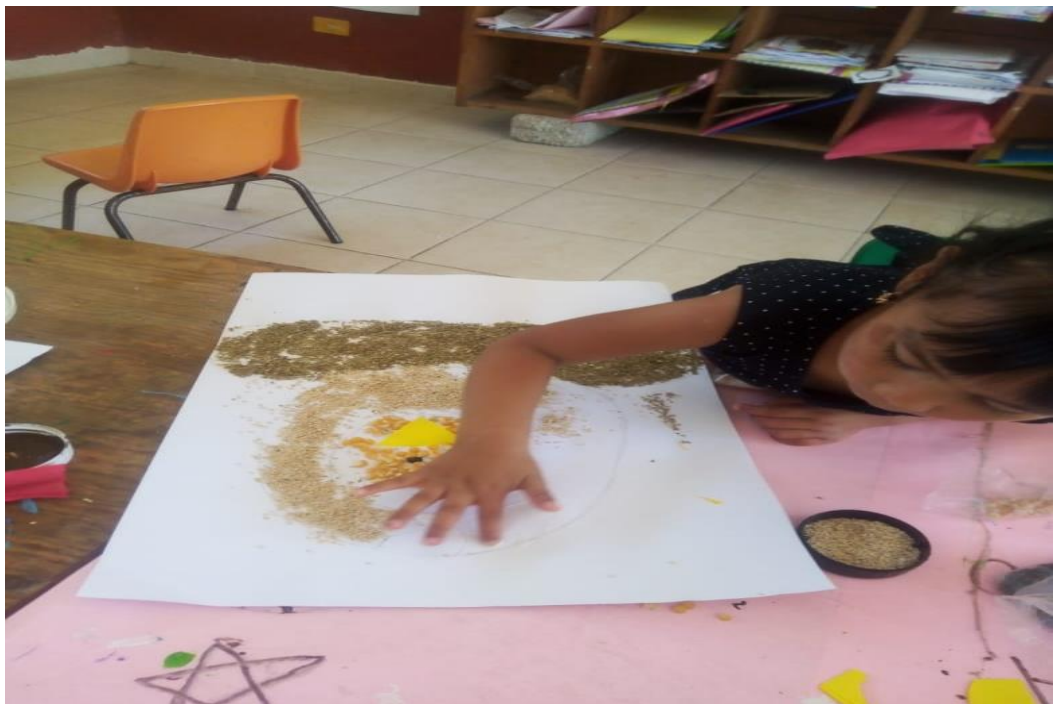
Anexo 18. Decoración del ciclo de la vida