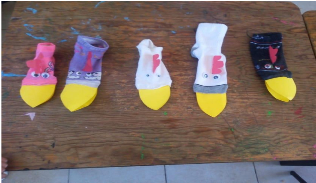
Anexo 17. marioneta de pollos