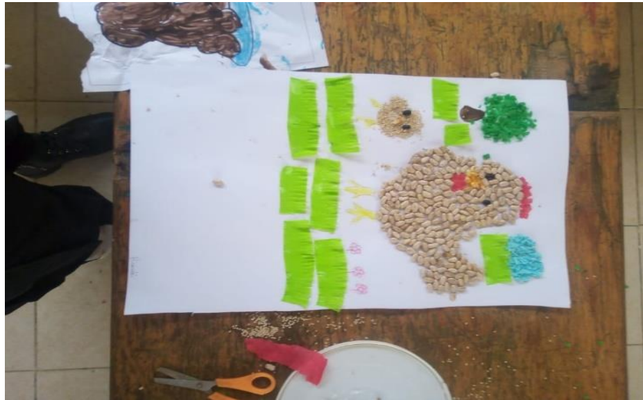
Anexo 26. Fortalezas y áreas de oportunidad de la sexta sesión