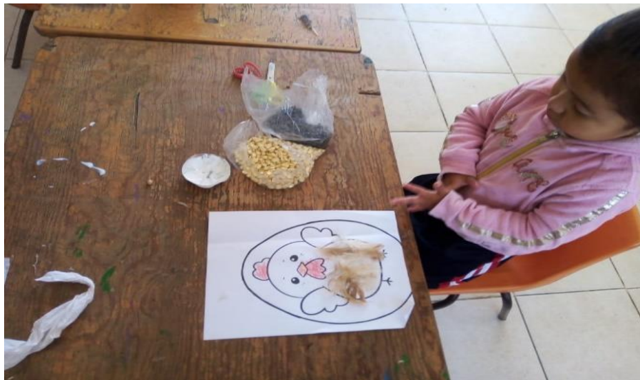
Anexo 22. Fortalezas y áreas de oportunidad de la segunda sesión