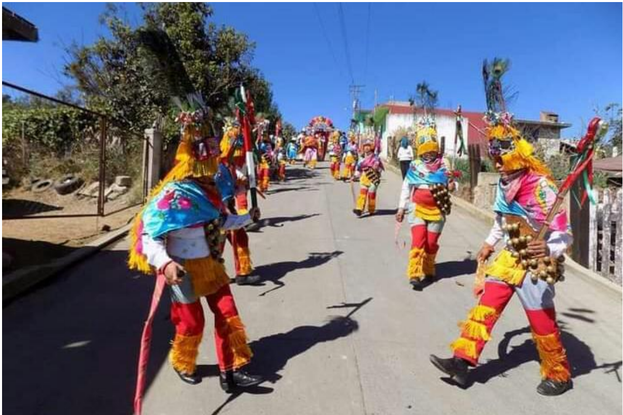
Anexo 4. Danzas de la comunidad