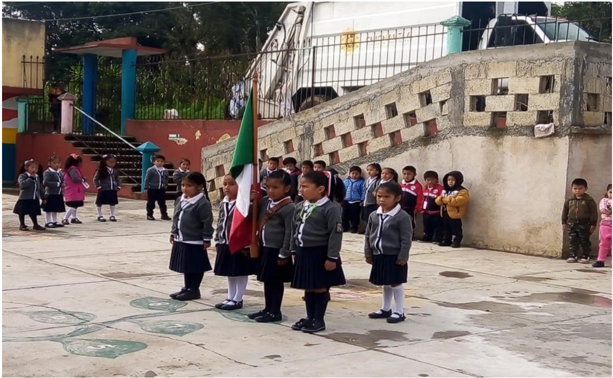
Anexo 7. Escolta de tercer año de preescolar.