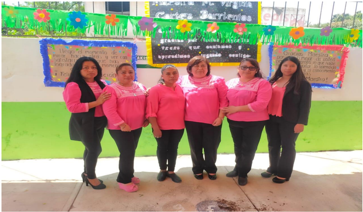
Anexo 5. Organización de las docentes de escuela preescolar México