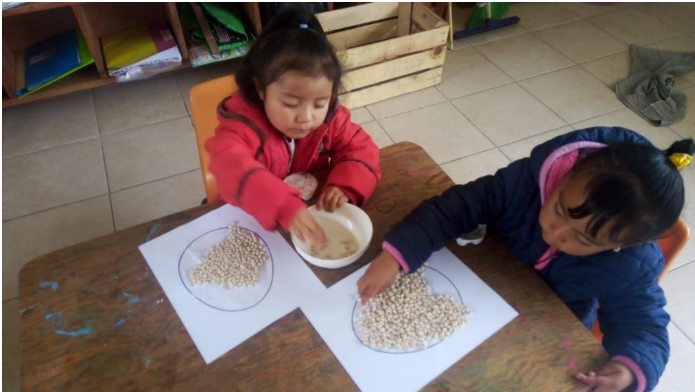
Anexo 14. Decoración del huevo