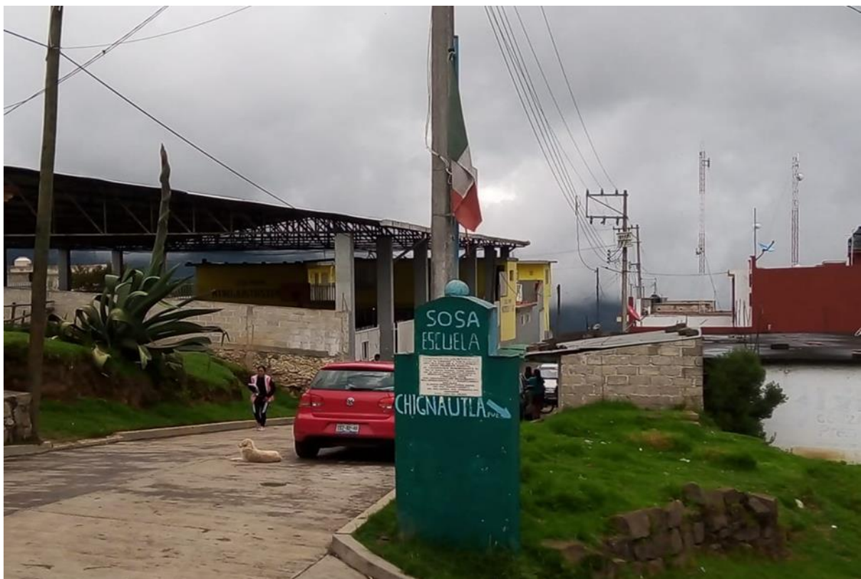
Anexo 2. Parada Sosa Chignautla.