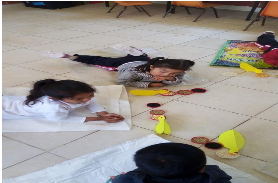
Anexo 23. Fortalezas y áreas de oportunidad de la tercera sesión