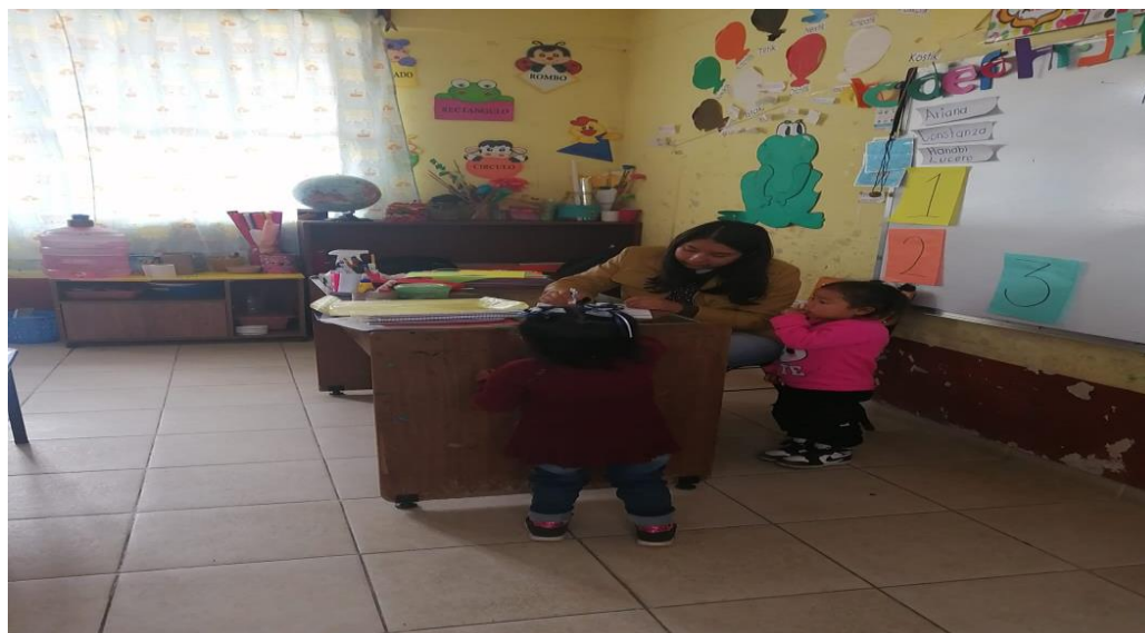
Anexo 12. Diagnostico sociolingüístico con los niños de primer año