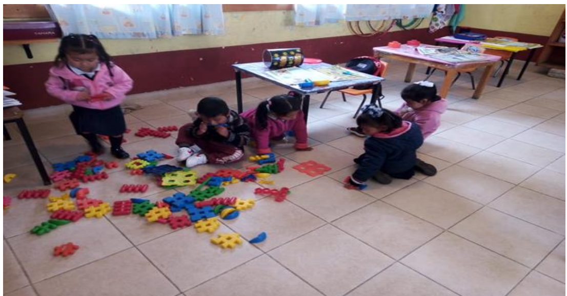
Anexo 10. Alumnos de primer grado manipulando material de ensamble