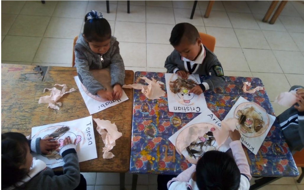
Anexo 15. Simulación de un nacimiento