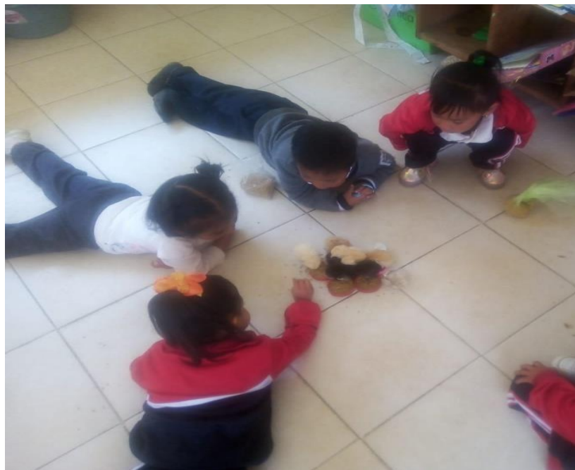
Anexo 27. Fortalezas y áreas de oportunidad de la séptima sesión