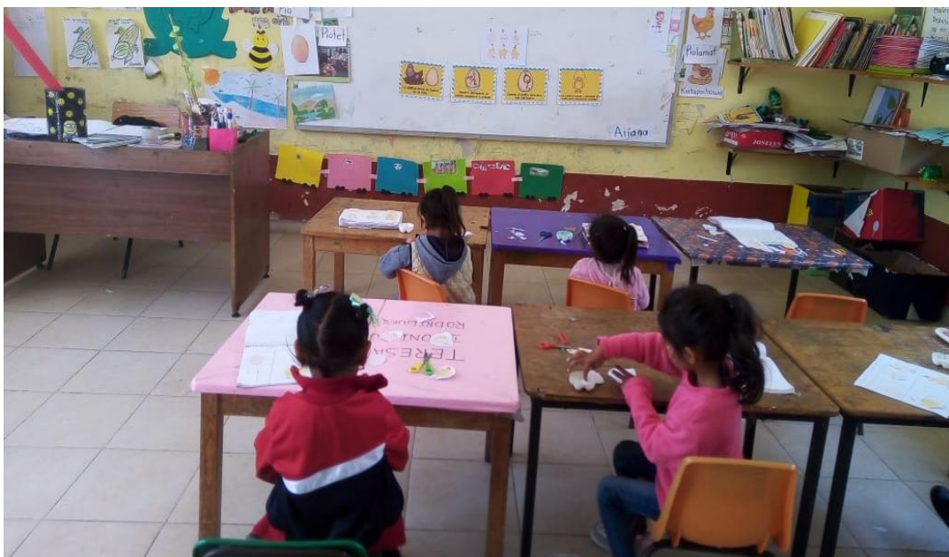
Anexo 20. Inventa un cuento