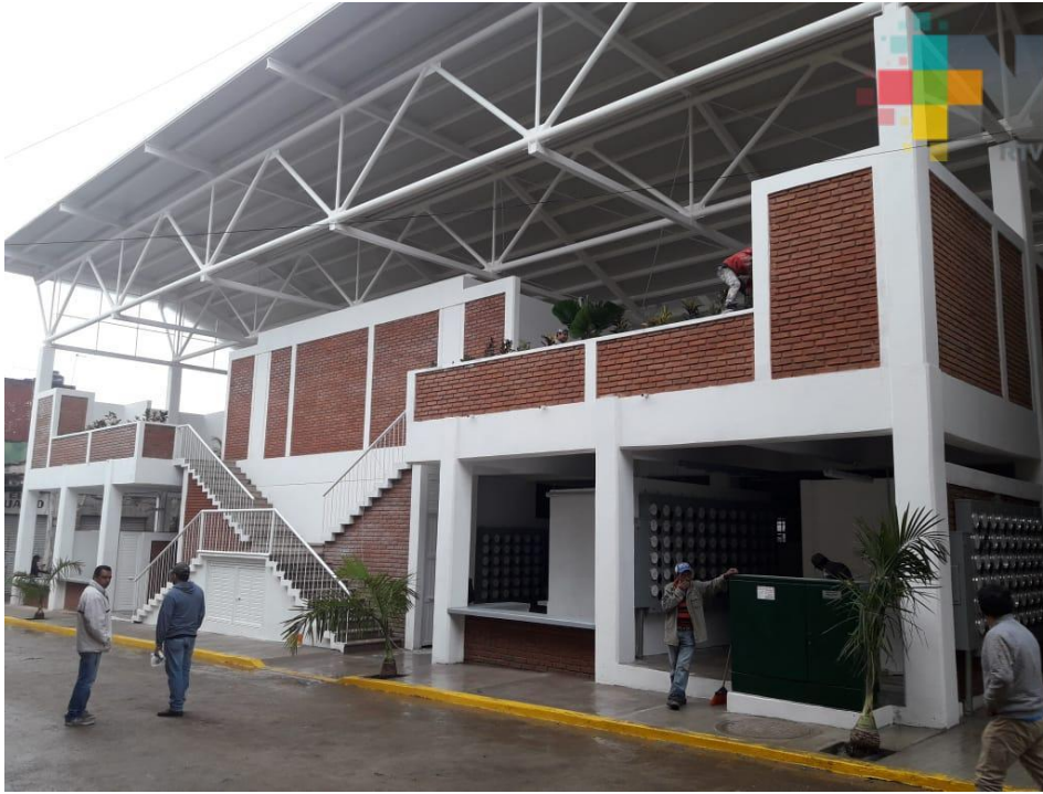
Mercado municipal, principal fuente de ingresos de algunas familias de la comunidad