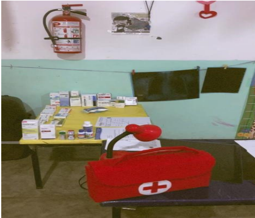
Stand de hospital donde los padres de familia fueron los pacientes.