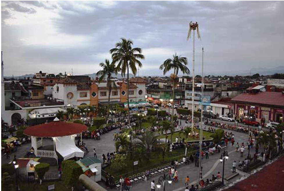
Fotografía del municipio de Tlapacoyan, parque municipal centro de la comunidad.