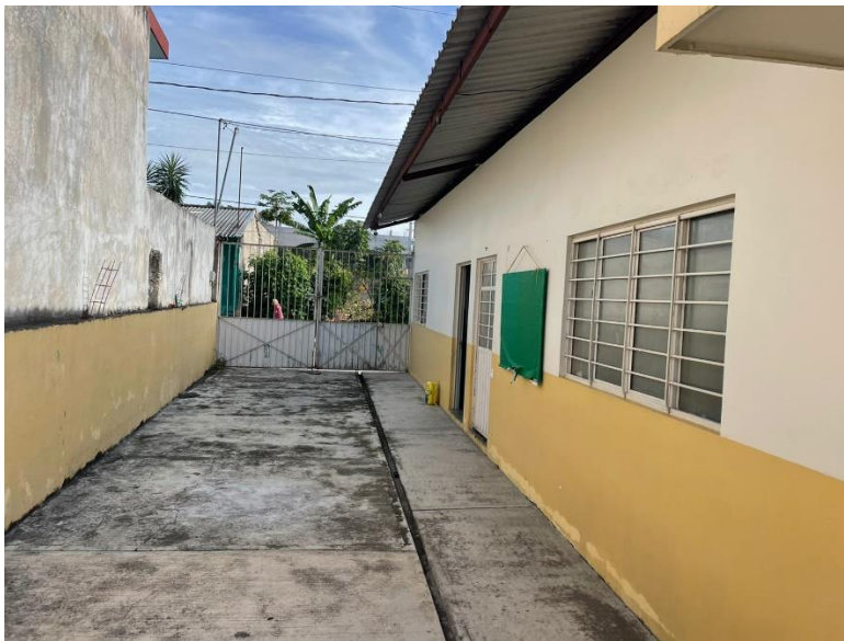
Patio del preescolar mis pequeños pasos