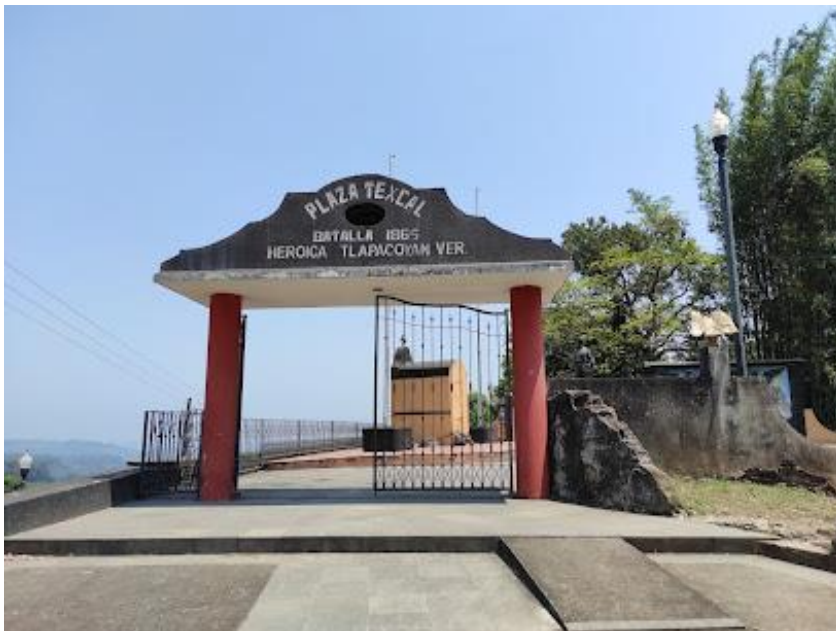
Plaza texcatl, lugar turístico, donde se dio el enfrentamiento.