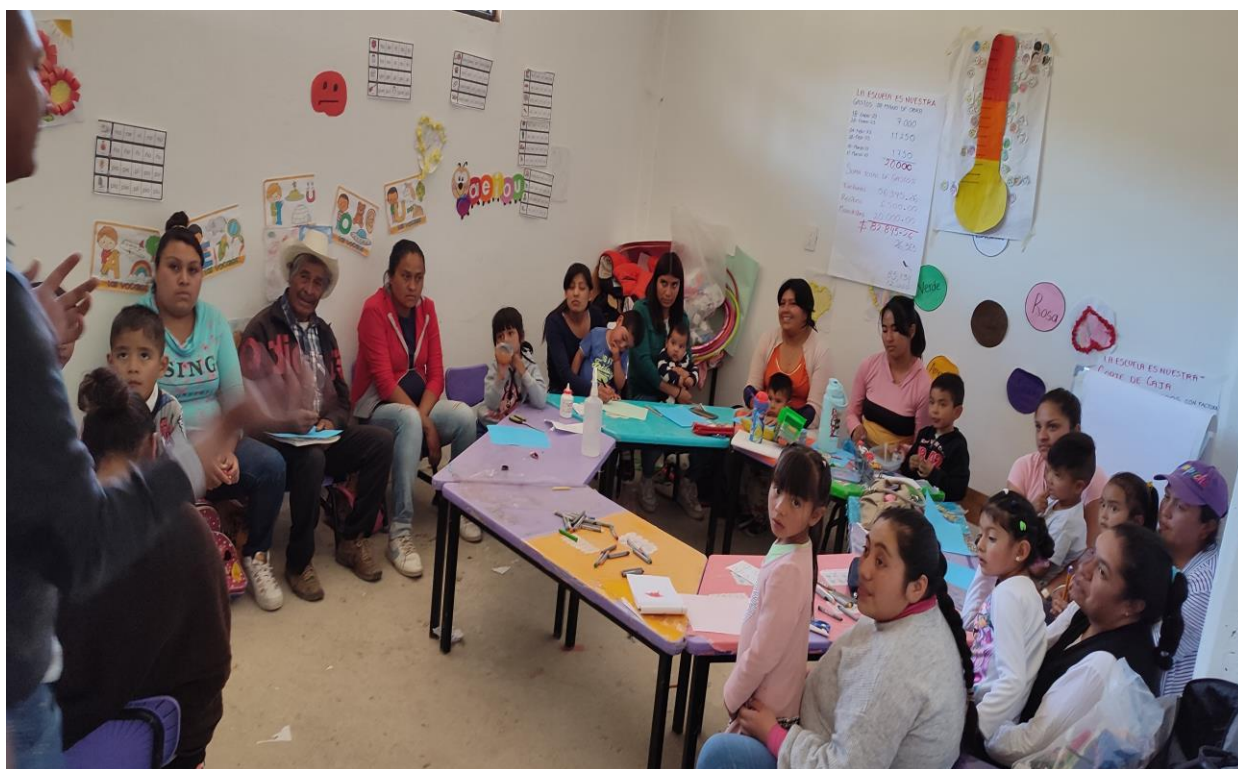
Anexo: 6 Sesión final “entregando informes”.