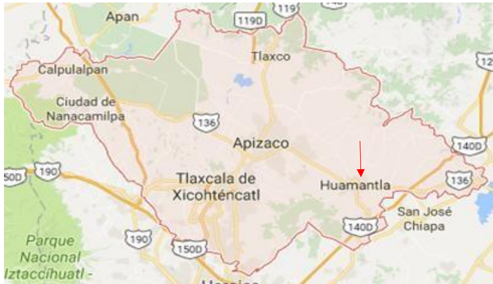
Fotografía que muestra donde se localiza la ciudad de Huamantla, fuente Google maps.