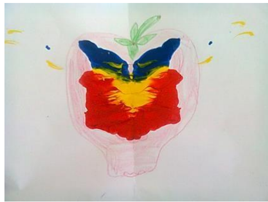
Fotografías de la utilización de pintura.