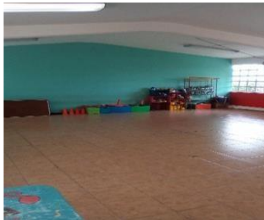
Fotografía del interior y el exterior del salón de música.