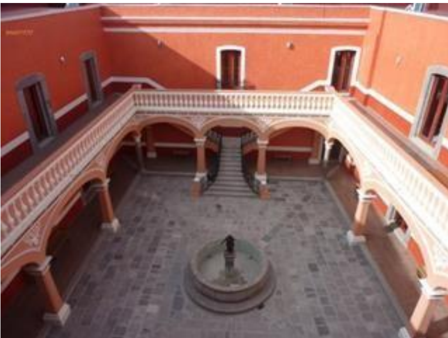
Interior del Museo Nacional del Títere (MUNATI)