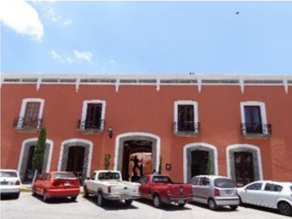
Fachada exterior del Museo Nacional del Títere