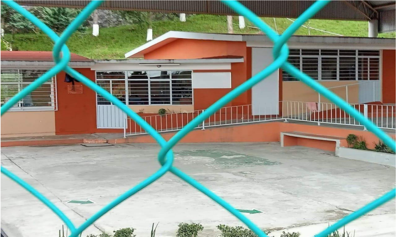
Jardín de niños Gabriela Mistral ubicada en el cuartel primero Jalacingo Veracruz