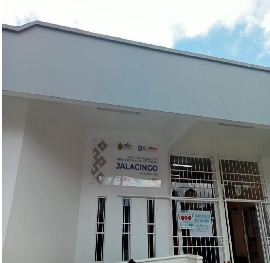
Centro de salud ubicado en el centro del municipio de Jalacingo