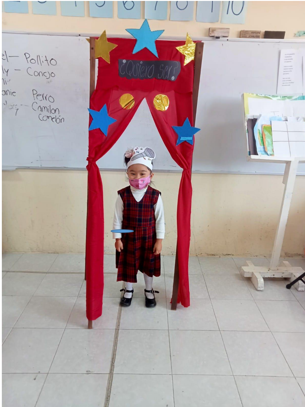
Representación de los alumnos sobre lo que quieren ser de grandes con la expresión de lo que se hace en esa profesión u oficio.