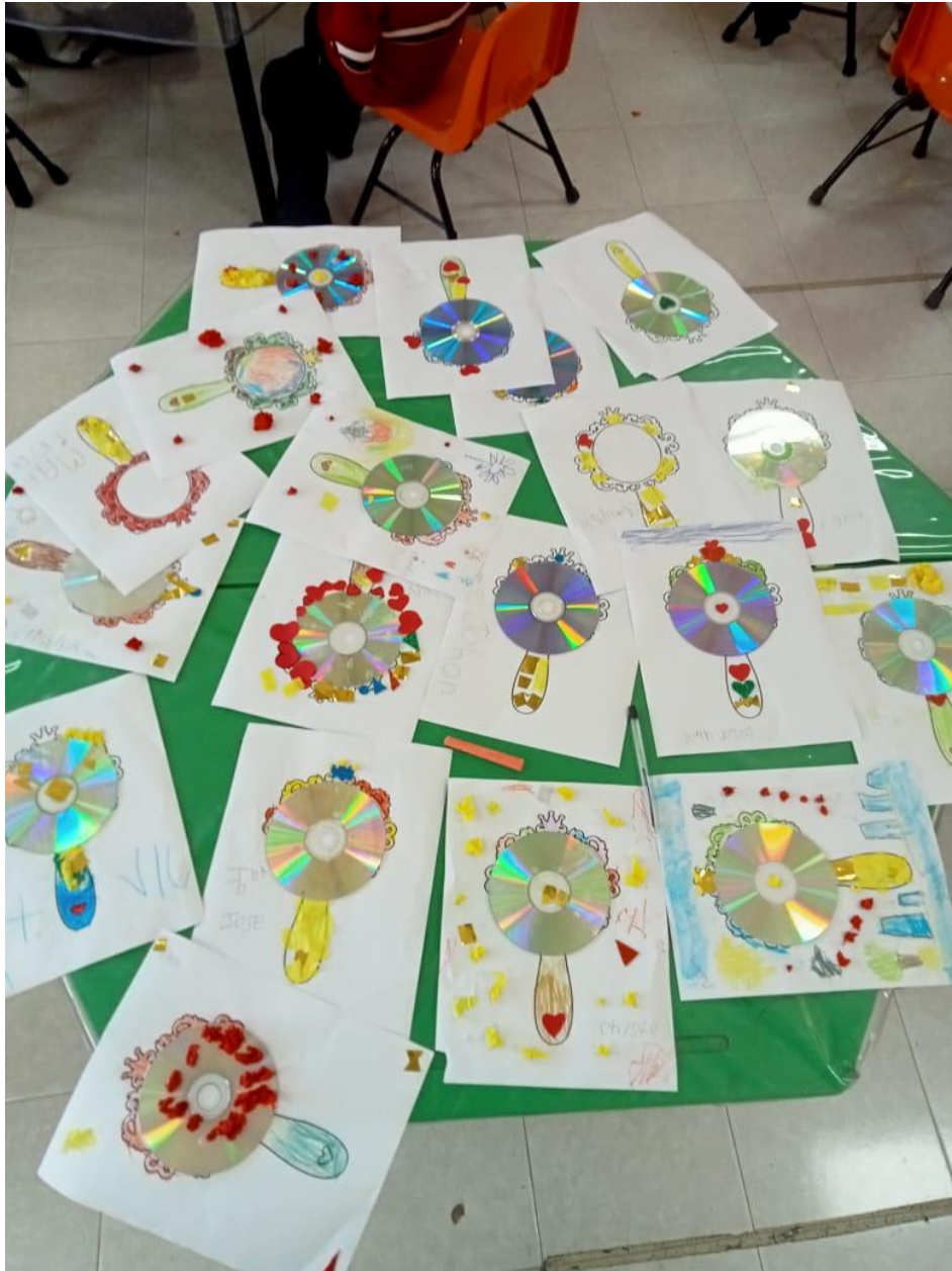
Decoración de los espejos mágicos elaborados por los alumnos con materiales reciclados.