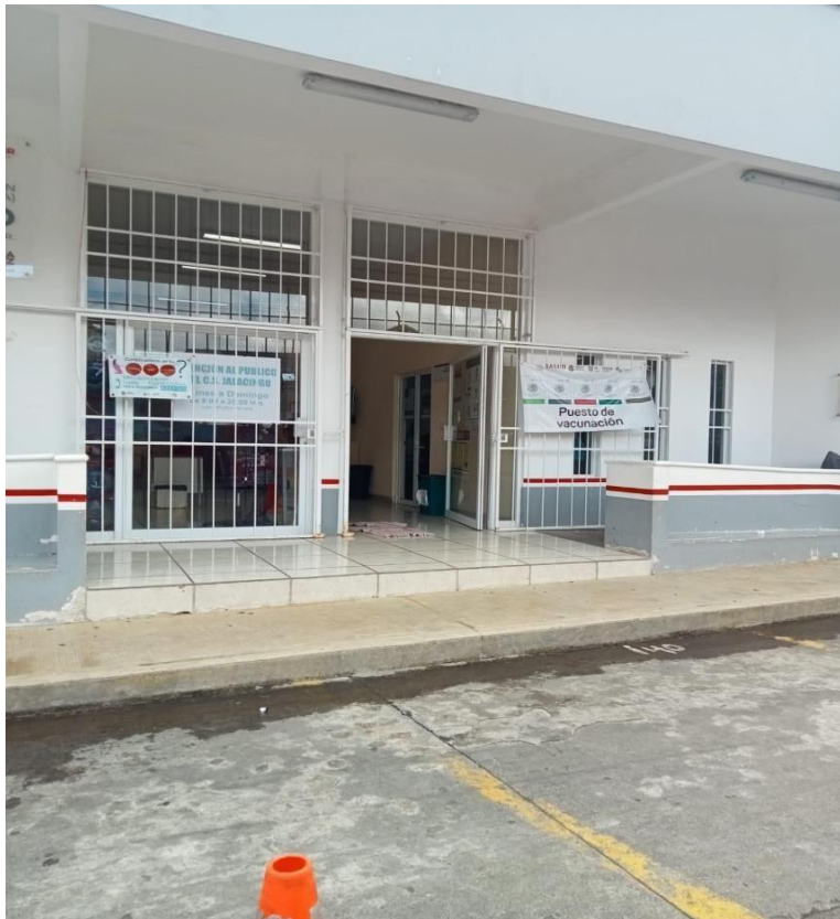
Centro de salud CESSA ubicado en el centro de Jalacingo