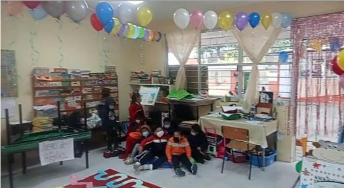
Aplicación de la Ludoteca como estrategia didáctica en el aula de tercer año grupo B.