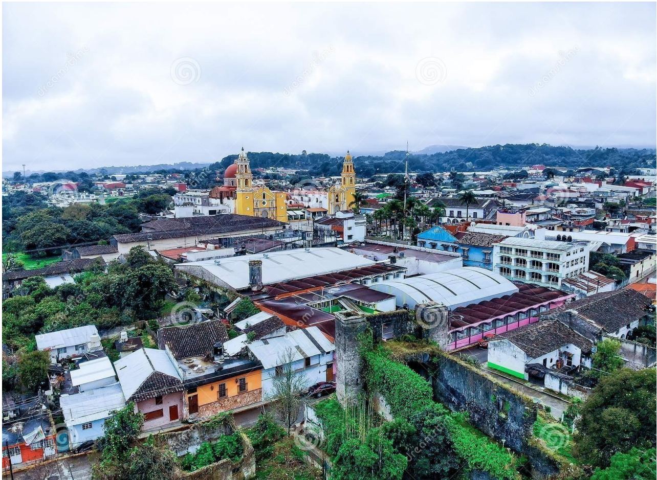
Municipio de Jalacingo ubicado en la zona central del estado de Veracruz región de la llave de la capital