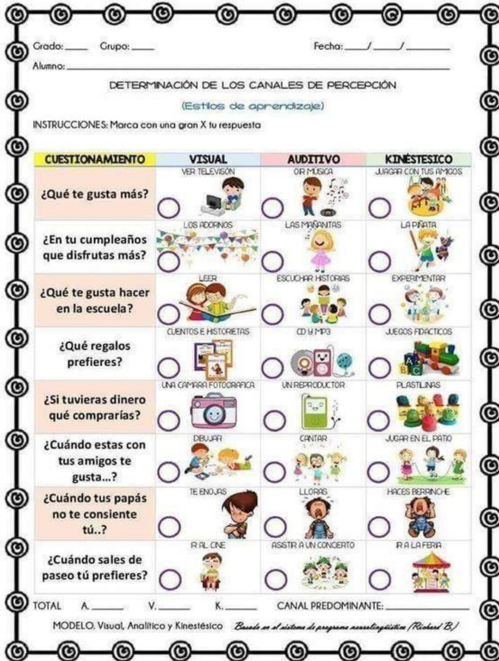
Test de estilos de aprendizajes para niños de preescolar