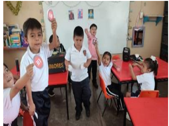
Dinámica de verdad o mentira.