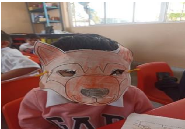
Máscaras de representación del cuento del lobo