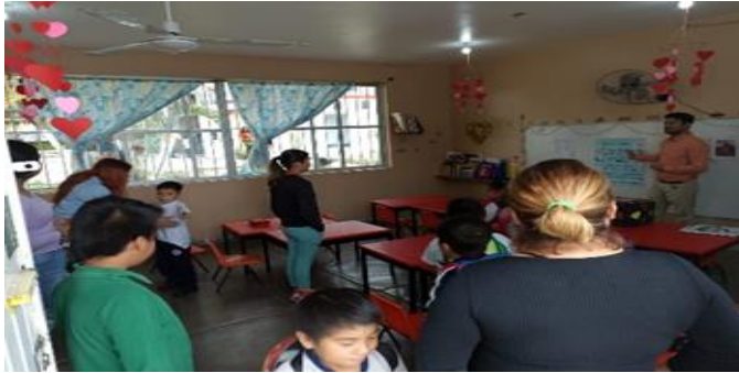
Sesión 1. Actividad de inicio