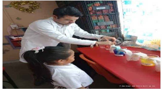
Sesión 2. Actividad de inicio y cierre.