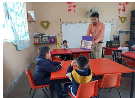
Diseñando el libro de los valores