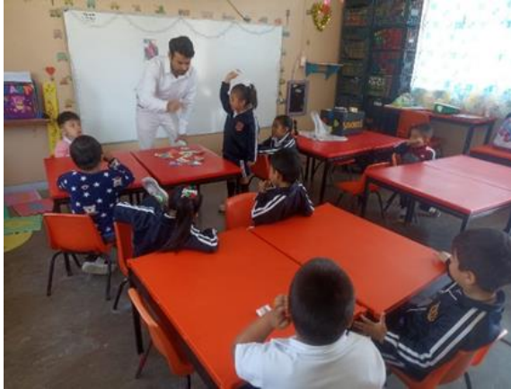
Juego de rimas