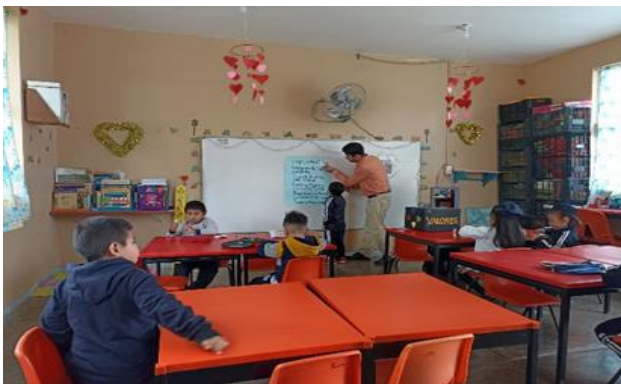
Elaboración de mi acuerdo de convivencia