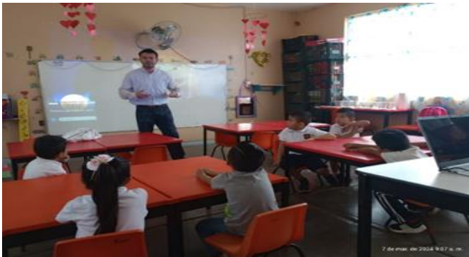
Actividad 3 sesión video ¿a quiénes más debemos respetar?