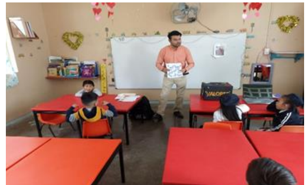
Sesión 4 la cajita de los super poderes.