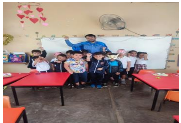
Presentacion la aldea de los superhéroes