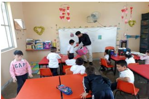
Juego de la tomboloa.