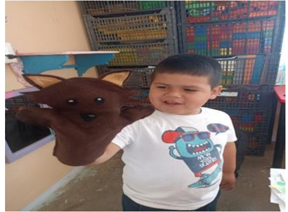
Presentación del cuento del lobo con títeres.