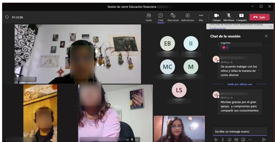
Figura 7. Capacitación virtual sobre educación financiera con docentes de CCDI.