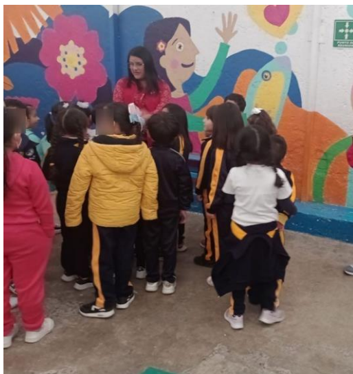
Figura 10. Dinámica de presentación con niñas y niños.

Durante el año 2024 y los primeros meses de 2025, asumí un nuevo rol como Oficial de Proyecto en la 'Red de CCDI'. Entre mis principales responsabilidades se encontraba la coordinación de proyectos implementados en diversos Centros Comunitarios de Desarrollo Infantil (CCDI), los cuales tenían como objetivo principal fortalecer el desarrollo integral de la niñez y la capacitación de docentes. Para ello, se retomaban distintos modelos pedagógicos, adaptándolos a los contextos socioculturales específicos de cada comunidad. Actualmente, el programa que orienta el diseño y la implementación educativa de quienes laboran en estos espacios es el modelo vigente desde 2021, conocido como la Nueva Escuela Mexicana (NEM)