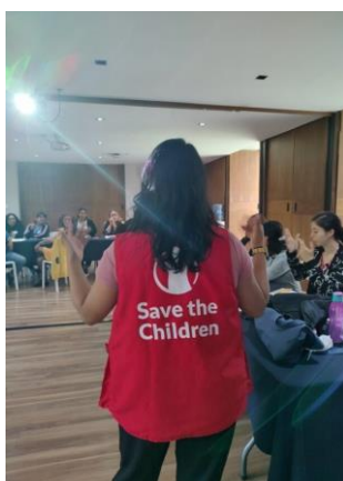
Figura 8. Capacitación a docentes de CCDI.

El proyecto concluyó con una sesión de reforzamiento formativo, en la cual se revisaron elementos clave de la metodología ELM, promoviendo espacios de reflexión colaborativa y actualización pedagógica. Esta experiencia consolidó mis habilidades en liderazgo educativo, análisis de procesos formativos y toma de decisiones orientadas a la mejora continua. Asimismo, reafirmó la importancia de promover comunidades de práctica que favorezcan el intercambio de saberes entre docentes, generando un impacto directo en la calidad de los entornos de aprendizaje ofrecidos a la niñez, pues aprender con otros y de otros sin duda tiene un impacto directo dentro de las aulas. En cada uno de los encuentros realizados, se planteó una pregunta central: ‘¿Qué transformación notaron dentro de sus aulas?’ Esta interrogante propició el intercambio de experiencias significativas entre los participantes, generando espacios de reflexión profunda y catarsis colectiva. Las narraciones compartidas permitieron reconocer avances, cambios de actitudes, logros y también conocer las dificultades en el propio proceso.