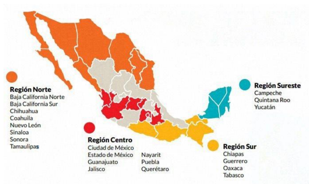
Figura 1. Mapa de impacto. Adaptado de Informe anual 2023 , por Save the Children, 2023. © Save the Children.

Durante el 2024, estos ejes lograron alcanzar una cobertura en 22 estados de la República Mexicana. (Save the Children, 2023a)