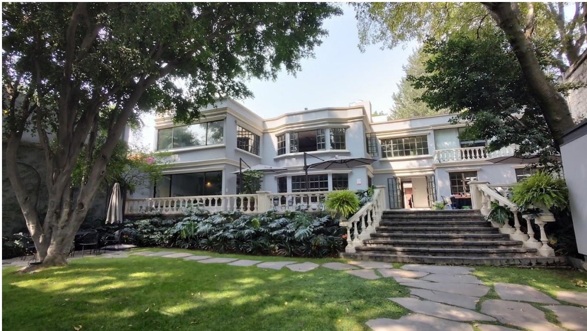
Figura 2. Instalaciones de Oficina Nacional

La Oficina Nacional de Save the Children México cuenta con las áreas de contabilidad, recursos humanos, oficinas de dirección, área de cocina, baños, una bodega y un patio común.