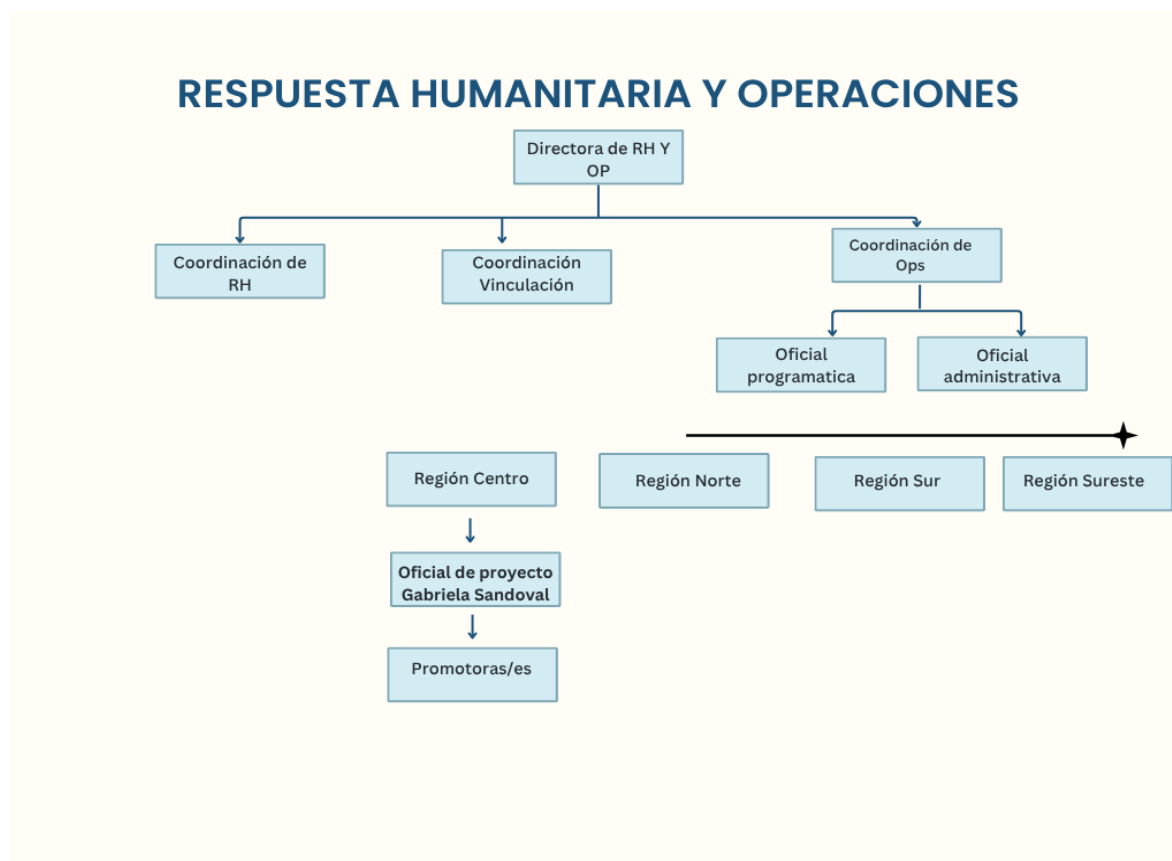
Figura 3. Organigrama.

Actualmente, la organización cuenta con una plantilla de 150 personas a nivel nacional. Sin embargo, forme parte de la Dirección de Respuesta Humanitaria y Operaciones, específicamente en la región Centro de CDMX y Estado de México.