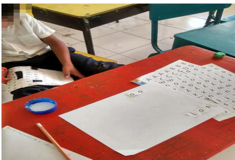
Figura 7. Construyendo palabras con diferentes letras.

Las palabras que se les dictó las armaron correctamente, al igual que el modelado con plastilina, la dificultad surgió al momento de resolver los crucigramas, a pesar de que se les presentó la palabra de manera visual, hubieron algunos errores, esto porque no se encuentran familiarizados con palabras un tanto complejas o fuera de su vocabulario, por lo que el resultado de esta actividad refleja un aproximado del 60% de efectividad.