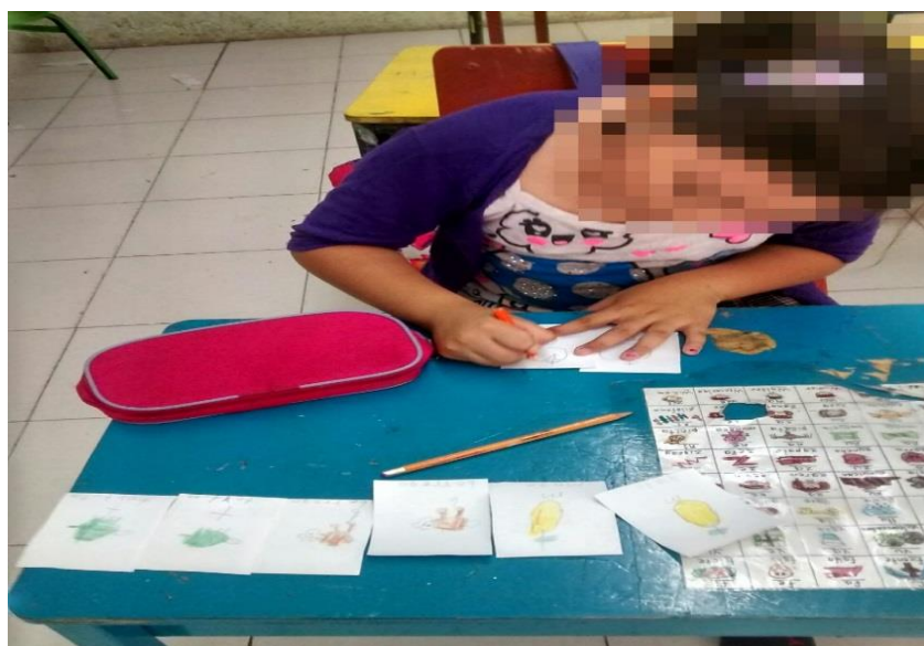
Figura 9. Elaborando su propio memorama.