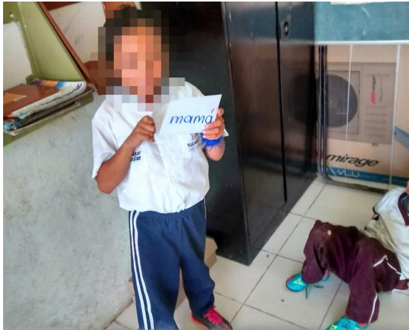
Figura 1. Encontrando diferentes letras y palabras.

80% de efectividad al formar las palabras completas, sin embargo hubo algunos errores en la formación de algunas letras, como en el caso de la “s” que la escribieron al revés.