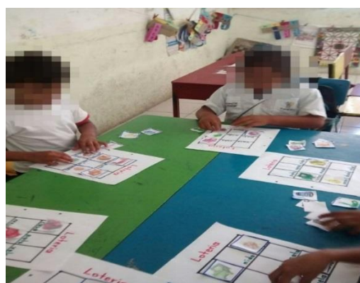
Figura 16. Armando su propia lotería.