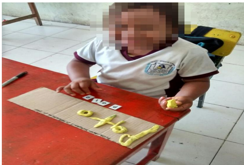
Figura 2. Moldeando palabras con plastilina.