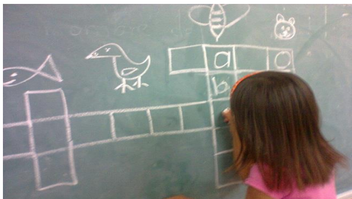
Figura 6. Completando el crucigrama en el pizarrón.

El resultado del armado de crucigramas en el pizarrón y con sus tarjetas móviles fue favorable; los ejercicios de las fotocopias, fueron fáciles cuando contaban con el encabezado del trabajo para que colocaran cada nombre en su lugar, tomando como referencia la cantidad de letras y la letra inicial de cada imagen; la dificultad surgió cuando las palabras no estaban preestablecidas y no contaban con letras para completar, Dando como resultado un 70% aproximadamente.