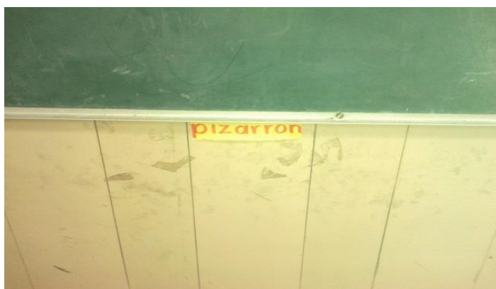
Figura 11. Etiquetando los nombres de algunas áreas del salón.

Esta actividad trajo como resultado que los niños relacionaran la imagen con el texto, basándose en la letra inicial del nombre de cada área, las sílabas que ya conocen les resultó fácil, mientras que las que aun presentan ciertas dificultades, las confundieron, por ejemplo “ventilador”, ya que no conocen la letra “v”. Al escribir palabras como “mesa” les resultó sencillo, pero “escritorio” tuvieron algunos errores como por ejemplo, “esquitorio”. Esto sucede por dos aspectos, la falta de conocimiento por las sílabas trabadas o por error en el lenguaje, es decir, escriben como hablan. Logrando un resultado favorable del 80% aproximadamente.