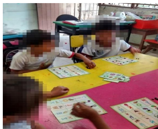
Figura 14. Jugando a la lotería de letras.