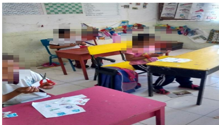
Figura 5. Uniendo imagen-texto.

Esta actividad fue sumamente favorable, porque los alumnos hallaron correctamente todos los nombres con sus imágenes, la dificultad surgió en el trabajo de Cristófer, que colocó invertidamente los nombres de los dibujos porque no hizo el intento por leer. Dando como resultado un 80% aproximadamente.