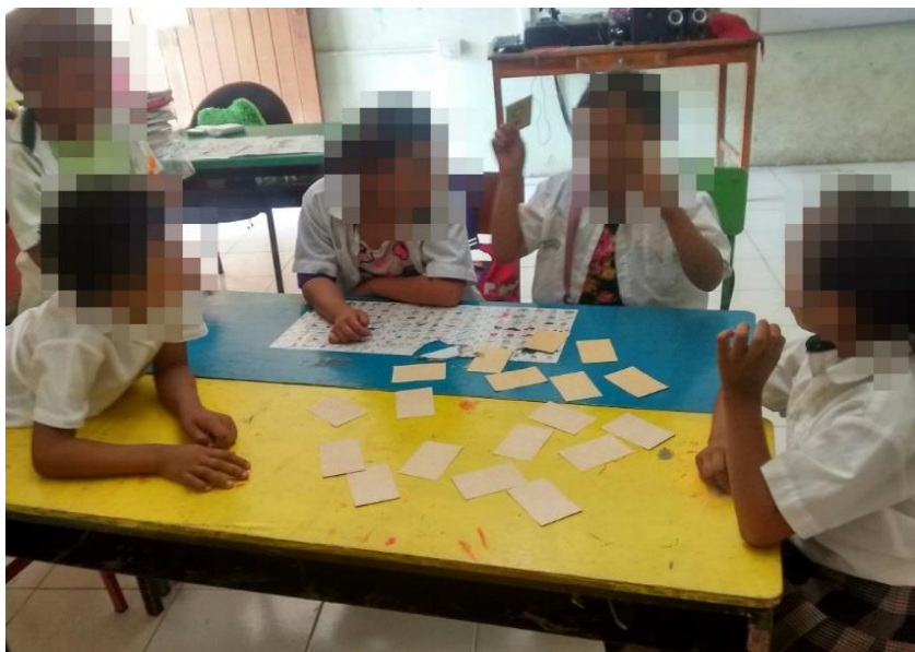
Figura 8. Jugando al “Memorama de imágenes”.

alumnos realizaron imágenes idénticas, tomaron en cuenta el mismo tamaño, forma y colores, por eso la actividad tuvo un porcentaje del 90% aproximadamente porque se tomó como principal aspecto la similitud en la escritura.