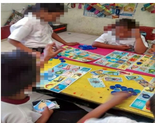
Figura 13. Jugando a la lotería tradicional.

El primer y segundo juego se realizó sin dificultades, siguiendo el repaso de cada letra pero basándose en la imagen; la dificultad surgió cuando en el tercero y cuarto juego las cartillas no contaban con los dibujos que contenían las barajas, por lo que a algunos alumnos les tomaba tiempo localizar las palabras iguales y la lectura de las mismas para hacerlas coincidir, por esta razón, se puede afirmar que el resultado positivo fue de un 95% aproximadamente.