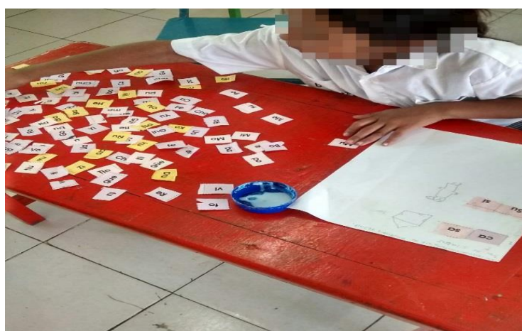
Figura 10. Armando palabras con sílabas.

El listado de palabras fue favorable, aunque durante el proceso tuvieron errores al armar palabras, al final pudieron formar palabras sencillas y conocidas para ellos con las que se encuentran familiarizados. La lectura de las mismas la realizaron correctamente, aunque en ciertas ocasiones dudaban o tardaban en juntar las sílabas por lo que la lectura de manera individual, fue tardado pero satisfactoriamente.