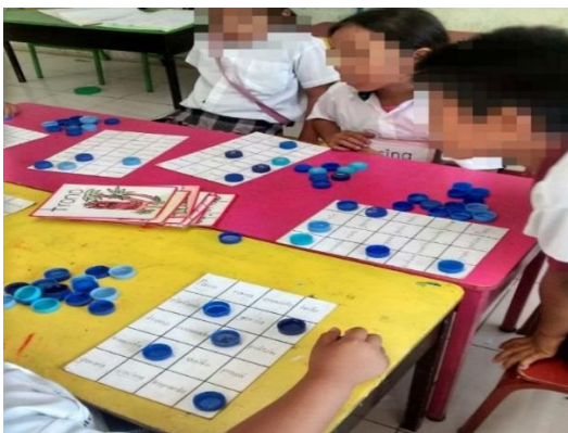
Figura 15. Jugando a la lotería imagen-texto.