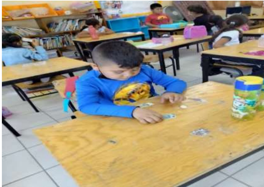
Ilustración 3 alumnos de clase /JGGR

El grupo de 1º, 2º. 3º tiene un total de 23 alumnos, 11 hombres y 12 mujeres, de edad entre los 6 y los 8 años de edad. 6 alumnos se dieron de alta en el presente ciclo escolar, 2 hombres y 2 mujeres, uno de los niños es repetidor y el grupo en general presenta las siguientes características: