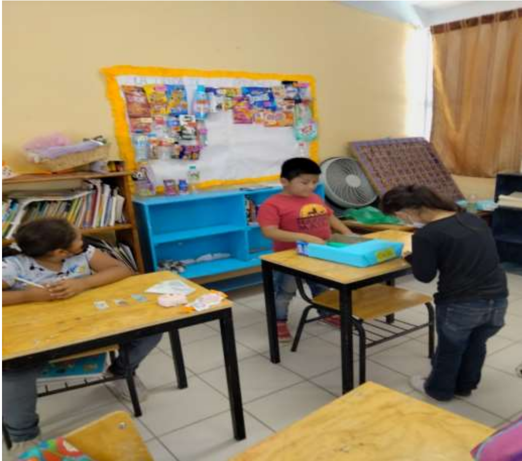
Ilustración 6 venta en clases / JGGR

Producto esperado: problemas resueltos con una estrategia convencional.