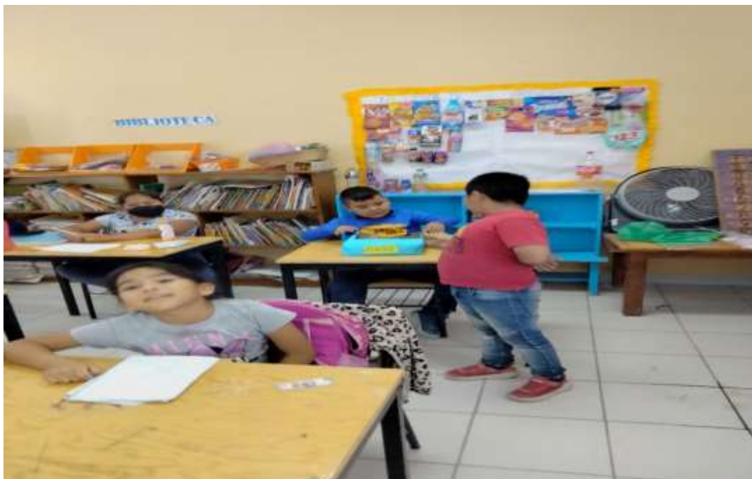
Ilustración 4Tiendita en la clase/JGGR