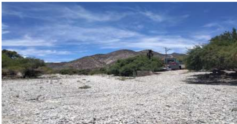
Ilustración 1 comunidad La Boca Villa de la Paz / JGGR

La escuela Primaria Francisco Javier Mina, C.C.T. 24DPR0350L, zona escolar 027, sector VIII se encuentra ubicada en la comunidad de La Boca Villa de la Paz, S.L.P. es una comunidad ubicada en la parte sur del municipio de Villa de la Paz en la zona montañosa de Real de Catorce por tanto su relieve es montañoso y su flora y fauna son de la zona semidesértica de la región del altiplano potosino.