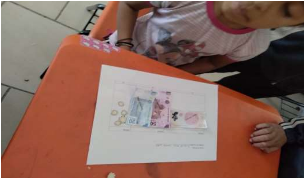
Ilustración 8 valor posicional de los números JGGR

Cierre: Cada alumno presentara su trabajo y mencionara el valor posicional del numero formado y aprenderán el valor de cada moneda y billete para poder comprar, trabajar en el grupo con ellos para realizar operaciones básicas ya que con la manipulación les fue más sencillas la actividades. Tiempo estimado 10 minutos.