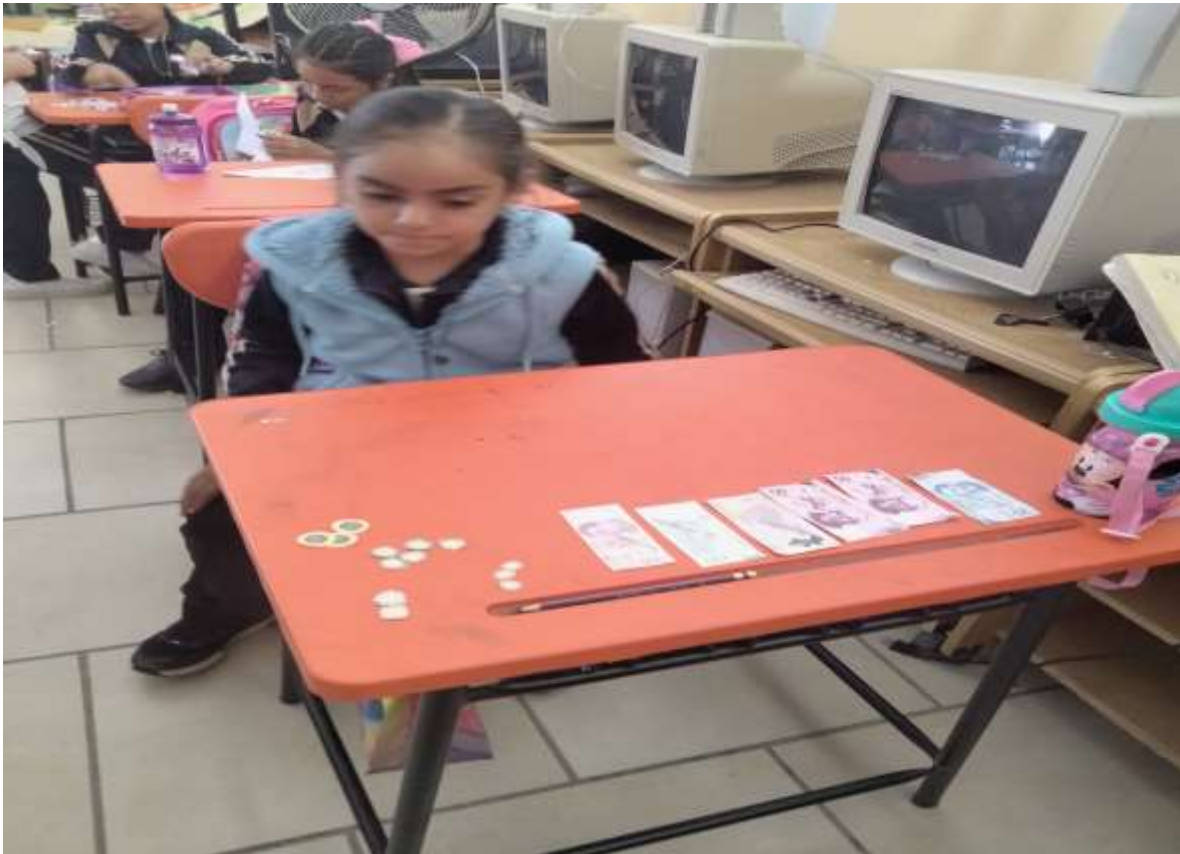
Ilustración 7ordenar monedas y billetes de menor a mayor JGGR

Desarrollo: Ya con la información dada se les repartirán monedas y billetes para ver el valor de cada uno, se clasificaran de menor al mayor después tomaran tres billetes y cinco monedas y las acomodaran en su mesa de menor a mayor para determinar que numero formaran, después cada alumno pegara los billetes en una hoja de maquina y será acomodado en una tabla donde especificado la unidad, decena y centena. Tiempo estimado 30 minutos.