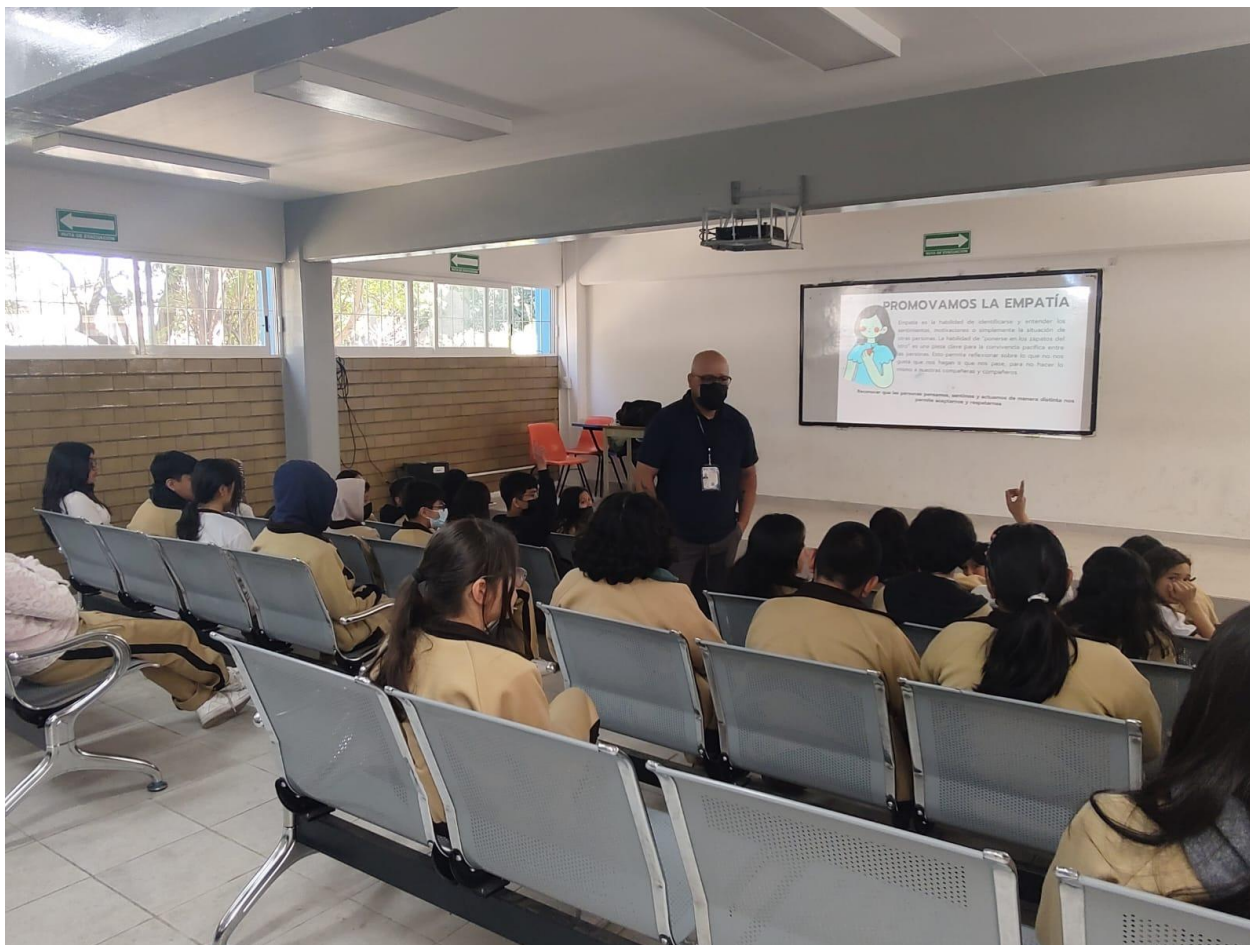
Sesiones presenciales en secundaria.

Los niveles en los que participé iban desde preescolar, secundaria y bachillerato, incluyendo también un grupo de secundaria para trabajadores y escuela para padres, todos con el objetivo de realizar intervención primaria, es decir, que las jornadas sirvieran de manera preventiva con los temas que solicitaban las autoridades institucionales respecto a las problemáticas que se llegaban a presentar, por ejemplo: salud emocional, adicciones, salud sexual.