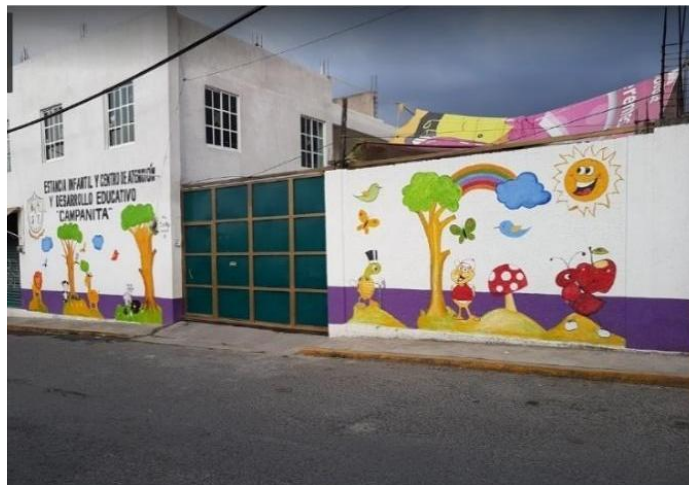
ILUSTRACIÓN 3 - FACHADA DEL CENTRO DE ATENCIÓN Y DESARROLLO CAMPANITA 18

El Centro de Atención y Desarrollo Educativo “Campanita” se encuentra ubicado en Av. 5 de Mayo No.15, Santiago Yancuitlalpan, Estado de México.