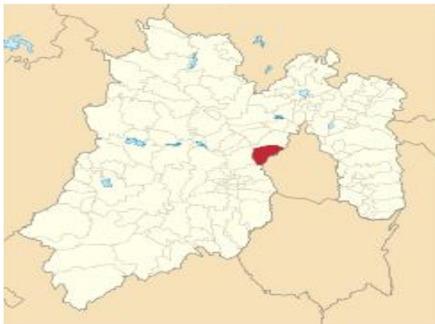
ILUSTRACIÓN 2 -UBICACIÓN DEL MUNICIPIO DE HUIXQUILUCAN 3