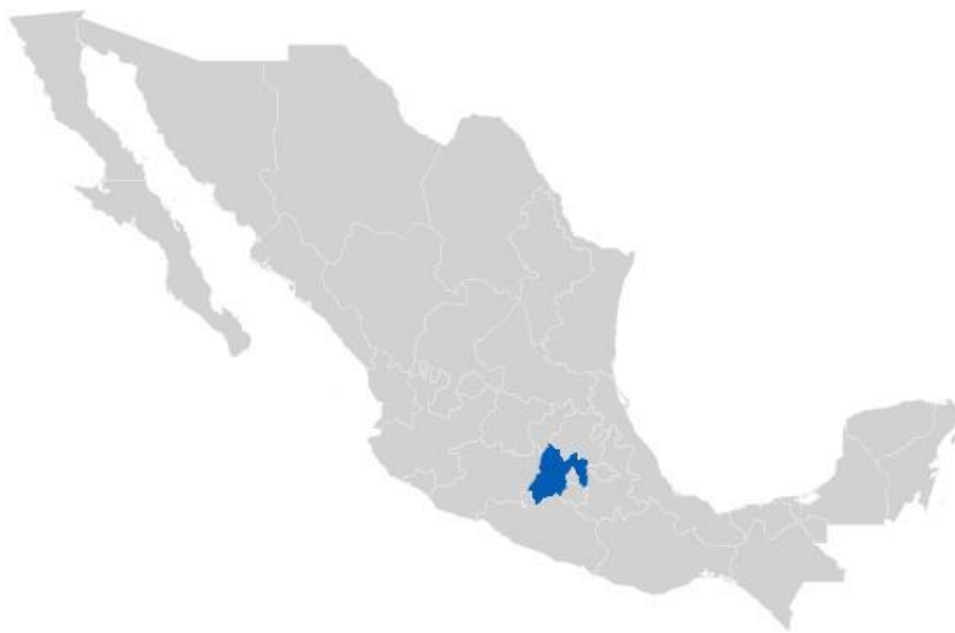
ILUSTRACIÓN 1 - UBICACIÓN DEL ESTADO DE MÉXICO EN LA REPÚBLICA MEXICANA 2