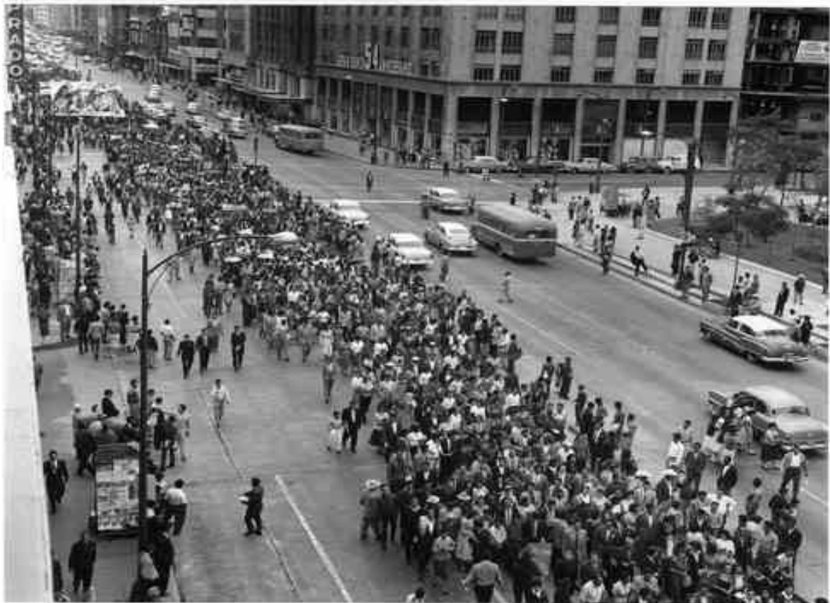
FOTO NÚM 3. Marcha histórica de la CNTE en 1979.

Touraine estableció que un movimiento social como el movimiento obrero condujo a que el trabajador deviniera en sujeto histórico debido a las condiciones de explotación en las que vivía, las cuales activaron las reivindicaciones de estos trabajadores vinculados a la lucha de clases, al sindicalismo y a los partidos revolucionarios de la sociedad industrial en la cual le tocó vivir con lo que, la noción de movimiento social evidencia la existencia de un tipo muy específico de acción colectiva llevada a cabo por los trabajadores que perdura hasta nuestros días.