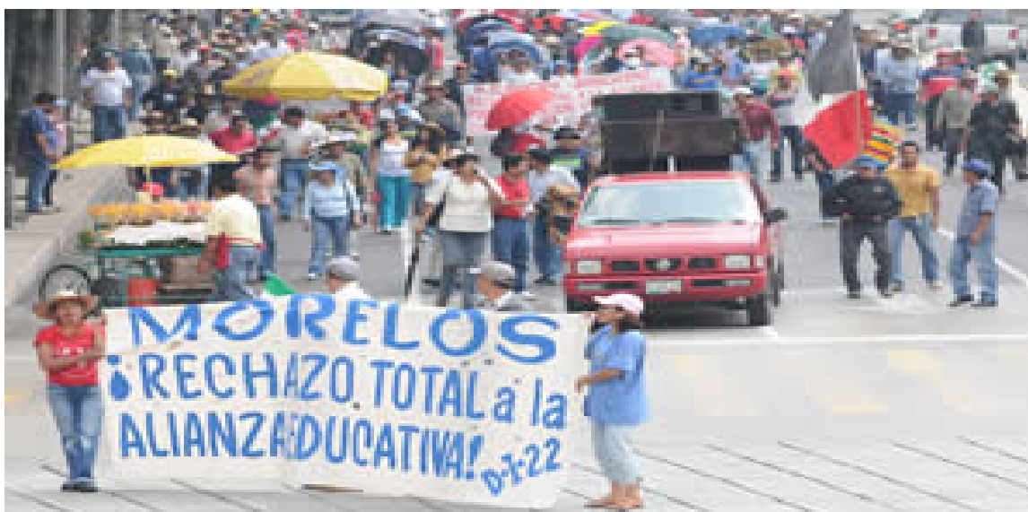
FOTO NÚM 4. Marcha de Morelos en el D.F. contra la imposición de la A.C.E. en 2008

“...una convicción de que la naturaleza de las personas y de los sistemas se hace más transparente en sus momentos de lucha... (y que) en los estudios cualitativos de casos, se intenta facilitar la comprensión al lector, ayudar a comprender que las acciones humanas importantes pocas veces tienen una causa simple y que normalmente se producen por motivos que se pueden averiguar”. (1999: 43)