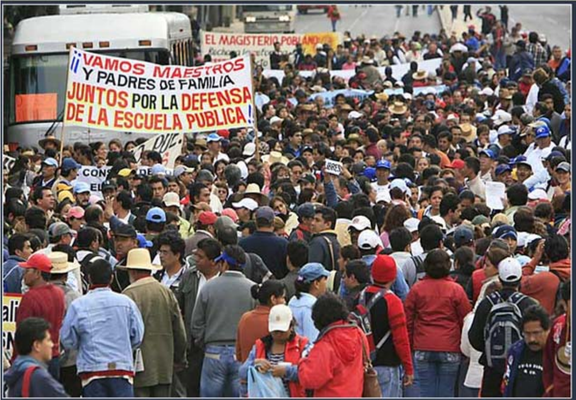
FOTO NÚM 5. Marcha multitudinaria en Cuernavaca, Morelos durante el 2008.

Este tipo de estudio asegura la validez y confiabilidad a través de la triangulación de la información.