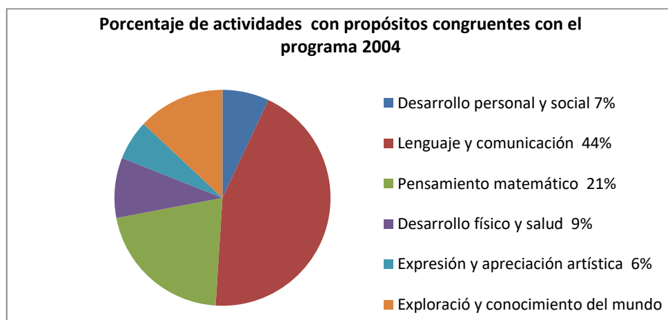
Figura 1. Porcentaje de actividades con propósitos congruentes con el Programa de Educación Preescolar 2004 (INEE, 2013).

Sin embargo de acuerdo al Instituto Nacional de Evaluación INEE, en la educación preescolar se le ha dado poca importancia al trabajo en este campo formativo, pues como lo demuestran sus investigaciones es uno de los campos formativos de los cuales tienen un porcentaje bajo de actividades con propósitos congruentes al PEP 2004.