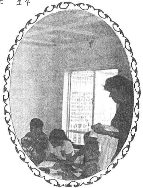
Modelado y bordado