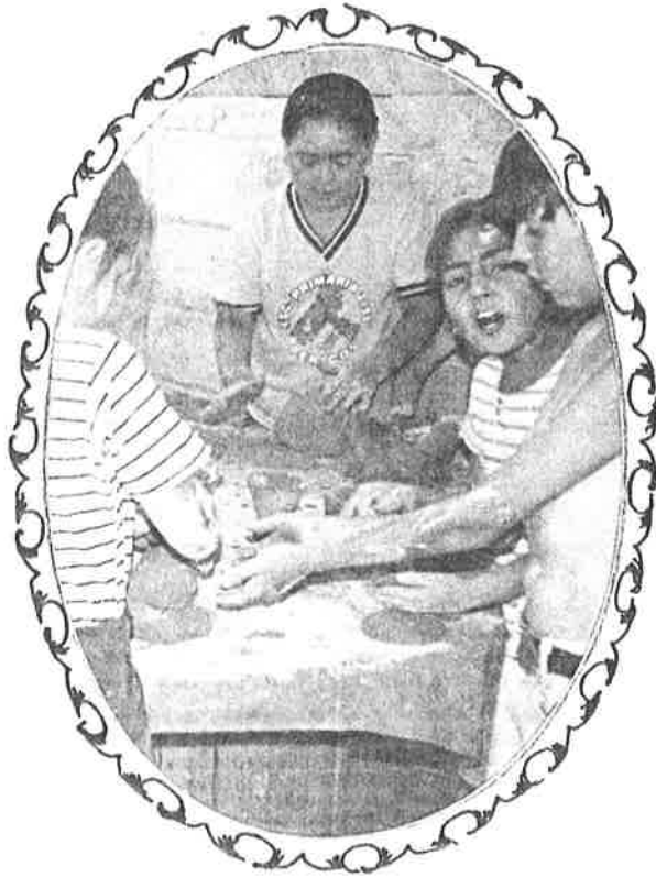
Modelado y práctica.