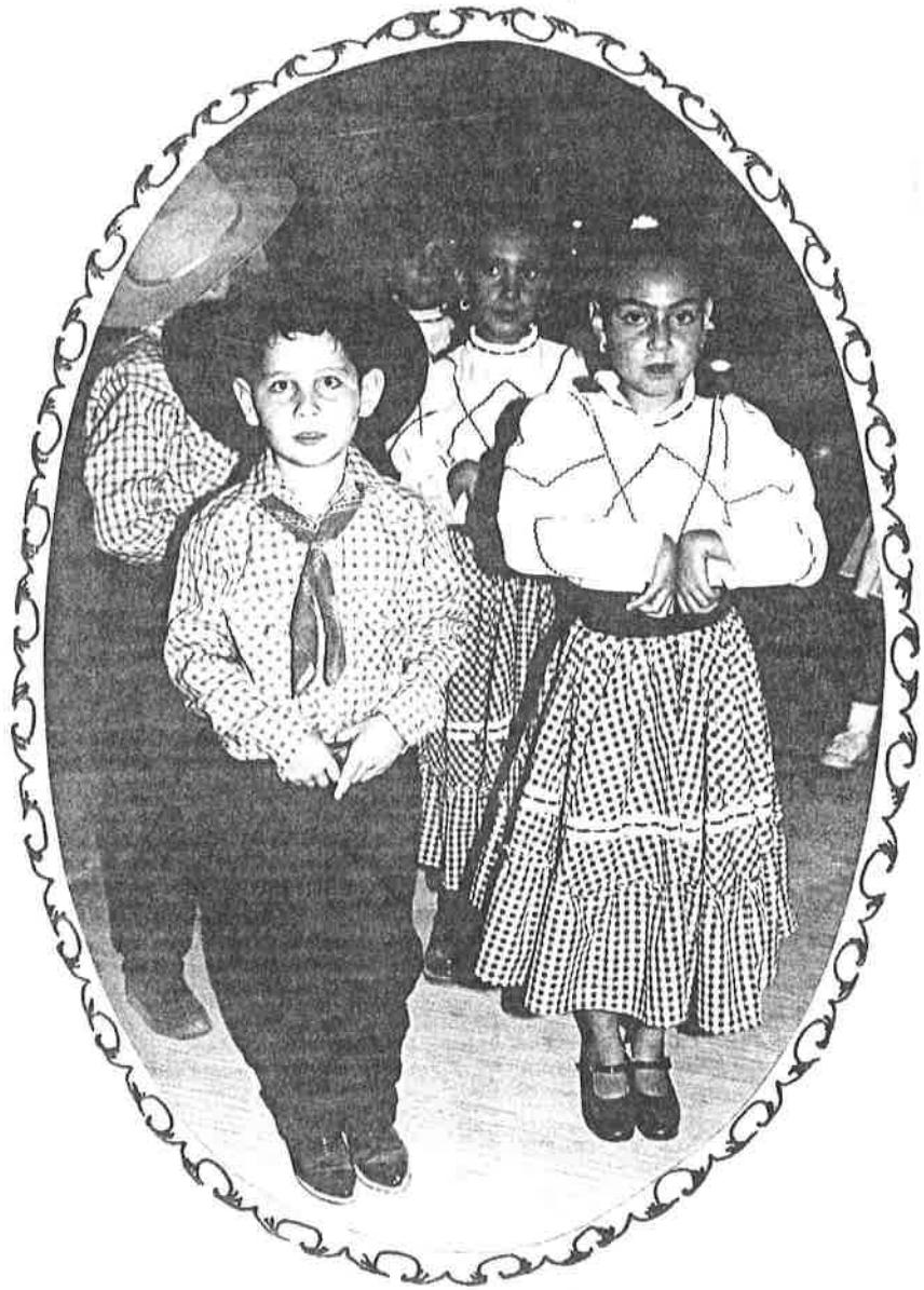
Cuadro de Tamaulipas