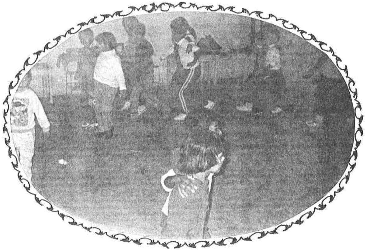
Grupo en práctica.