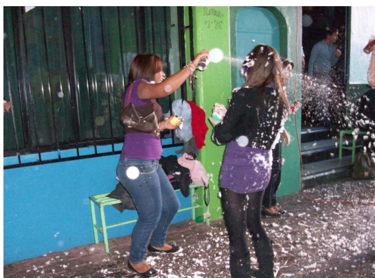
Foto 3. Convivencia de los alumnos para una mejor interacción.

El papel del docente es propiciar el aprendizaje de sus estudiantes con estrategias innovadoras, el del alumno es prepararse para vivir en su medio social. Así como trabajar en grupo, participar en la elaboración de la planeación de acuerdo a sus intereses, descubrir conocimientos, reflexionar e investigar.