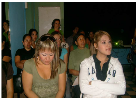
Foto 19. Los docentes en taller para el intercambio de experiencias

Es fundamental dentro de la institución que el director innove y busque situaciones favorables para que los docentes interactúen entre sí, una de ellas es la creación de talleres de convivencia, estos espacios invitan la reflexión e intercambio de experiencias, se pueden utilizar videos, collages, exposiciones, etc., y con esto seguir preparándose para mejorar las prácticas cotidianas.