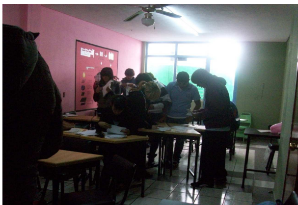
Foto 6. Interacción de los alumnos para la toma de acuerdos en el trabajo

En la nota de campo que se registró el 04 de febrero en el grupo de tercero de secundaria nos muestran cómo se puede trabajar de manera organizada: