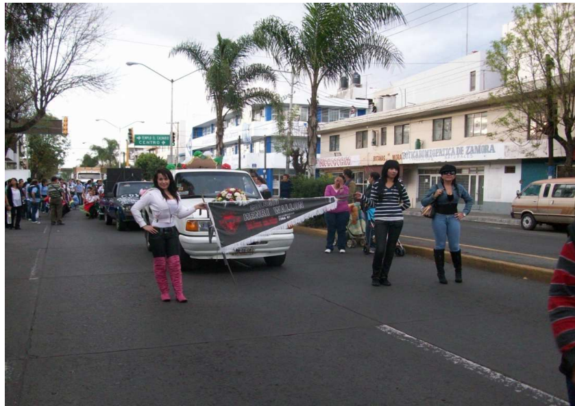
Foto 2. La integración de alumnos y maestros con la comunidad

EL DIRECTOR LÍDER IMPULSA LA EDUCACIÓN BASADA EN VALORES Y TRADICIONES; RESPETANDO LA IDENTIDAD PROPIA DEL ALUMNO Y MAESTRO; PROPICIA EL TRABAJO EN EQUIPO, EL APRENDIZAJE CRÍTICO - REFLEXIVO; Y FOMENTA EL USO DE LAS TECNOLOGÍAS SOLORIO.