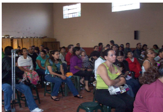
Foto 21. Talleres de padres de familia para convivir y crecer como personas y como los principales formadores de sus hijos.

Por ello la armonía en la escuela implica una formación humana integral, y es desde el accionar y la actuación pedagógica. Pero en coordinación con los padres de familia, promoviendo con ello el respeto hacia los demás para que sus relaciones sean buenas y satisfactorias. Para ello se debe preparar día a día, con esas ganas de ser mejores y sólo asistiendo a conferencias que les permitan aprender constantemente, aceptando que la forma de mejorar es cambiar el actuar, no quedarse pasivos.