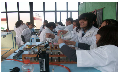
Foto 8 Actividad entendida y realizada con éxito en el laboratorio

De ahí que el lenguaje y el discurso sean importantes para construir alguna situación, llámese en política, en lo social, en lo educativo y en lo económico, ya que por medio del lenguaje se crea el discurso, que si se adapta a la realidad que se vive, puede llegar a ser muy productivo. De la Torre dice, el lenguaje: “Es como una visión o elemento cuántico a través del cual percibimos, construimos y comprendemos el mundo que nos rodea. La realidad que queremos la vamos conformando a través del lenguaje y de las palabras”. (2007:63).