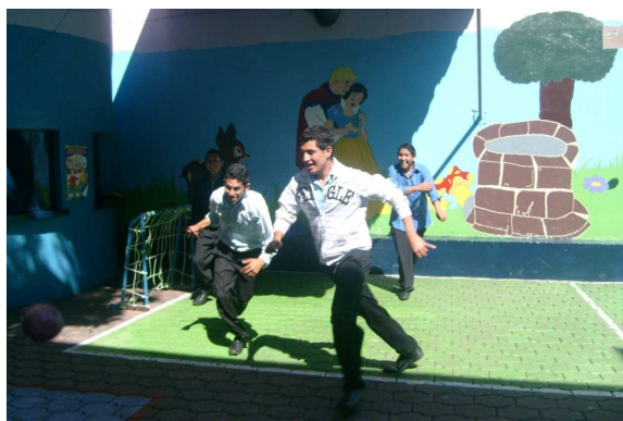
Foto 10 de alumnos en deporte, relajarse y socializar fuera del aula.

Por otra parte, es fundamental reconocer que por medio del mismo, los adolescentes van conociendo lo que es saber integrarse, entienden que hay más unión con la gente que les rodea, conocen las diferencias que hay entre unos y otros, aprenden a convivir, maduran de una forma eficaz y sobre todo, admiran al que posee impedimentos físicos y aún así entra a la contienda.