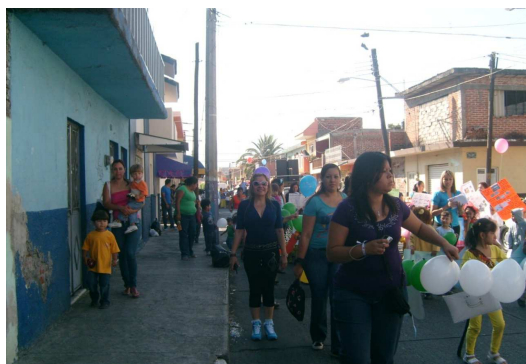
Foto 4. La participación de los padres de familia en actividades de relación con sus hijos y la comunidad escolar

Un ejemplo de lo anterior son las participaciones dentro de la comunidad, ya sea en festivales o costumbres propias del contexto, en este caso se hace alusión al desfile de la comunidad, que significó la apertura de la semana cultural de la institución en su XI aniversario, llevado a cabo el pasado 23 de Mayo. En el diario de campo hay una nota que ejemplifica esto: “Se observó que interactuar con la comunidad es parte fundamental relacionarse desde la etapa preescolar con los padres de familia, implicarlos en el proceso educativo de sus hijos, se visualizó que acompañaron de los niveles de preescolar y primaria, se notaba en las caritas de los niños la alegría porque estaban con sus padres y maestras” (DDC05L230510GS).