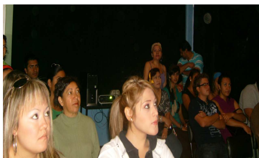
Foto 15. El fomento a la reflexión y el saber de los profesores para lograr una formación integral

Es por ello que los profesores generan el compromiso de reflexionar en cuanto a su saber docente y con ello buscan y aplican estrategias de planificación y organización, vinculando con ello la vida de los alumnos con la escuela en una formación integral.