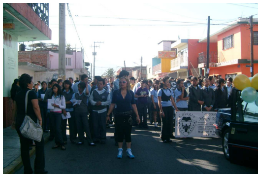
Foto 5. El comportamiento de los alumnos de secundaria fuera de la institución

En la primaria era diferente, tenía una maestra y era “chida”, acá son muchos maestros unos buenos otros no, es un cambio muy grande, dejé a mis amigos, ahora tengo que buscar otros, a mí me gusta tener amigos, y me quería ir con ellos a la escuela donde fueron, pero ya nos separaron hay otras secundarias y mis papás me trajeron a esta, tengo que obedecer y para qué, si ni vienen conmigo como en la primaria, sólo es puro regañarme si me porto mal o no hago tareas, y eso sí, es por culpa de los nuevos amigos, así no se puede. Además apenas estamos haciendo algo en la clase cuando el timbre suena y viene otra clase, y otro maestro, no nos dejan en paz un ratito. Es otro rollo estudiar en la secundaria”. (CA6240210GS)