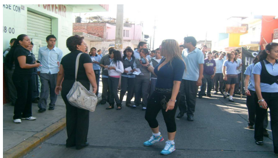
Foto 22. Actividades de los alumnos en un ambiente de respeto.

Y para lograr la armonía deseada en las escuelas, sin que haya obligación ni coerción es necesario que el director implemente actividades encaminadas a fomentar el respeto entre los alumnos y docentes tales como; conferencias que los hagan concientizarse acerca de lo valioso que es interactuar de una manera agradable sin violar derechos de nadie, convivir en eventos importantes para la institución y con ello reforzar esas interacciones.