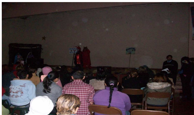
Foto 11. La expresión artística de los adolescentes para socializar con padres y maestros.

procesos de desarrollo personal, expresivo, creativo, cultural, social y de su entorno". (2006:119).