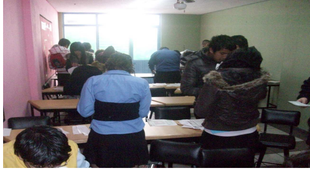
Foto 9. Muestra de trabajo cordial que prevalece en los alumnos de 3 de secundaria

También es preciso señalar que el adolescente observa en sus maestros, algunos paradigmas de comportamiento, formas de vivir y ser, y que son modelos que toman en su formación. La ventaja del nivel secundaria, es que ya el estudiante, puede conocer distintas formas de ser, actitudes y comportamientos de sus profesores, puesto que convive con varios en su cotidianidad, así mismo hace comparaciones entre unos y otros, y se inclina obviamente por los que son afines a él.