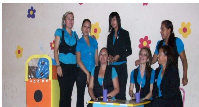
Foto 18. El apoyo del colectivo como fundamental para un buen funcionamiento de la institución.

El colectivo de apoyo es fundamental en la escuela secundaria para que ésta funcione mejor, para ello se requiere prever algunas condiciones que son necesarias y de esa manera la institución educativa ofrezca la posibilidad que directivos, administrativos, docentes y alumnos conformen una comunidad de aprendizaje lideradas por el director, siendo ésta una condición básica donde las experiencias de todos propician y suscitan conocimientos, actitudes y habilidades para el estudiante.