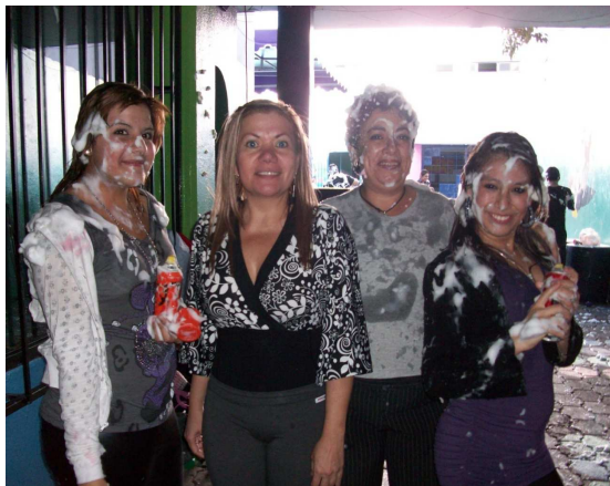
20. Maestros en actividades escolares que motivan una buena interacción.

4.5. La promoción de concursos áulicos que fomenten el respeto entre la comunidad estudiantil.