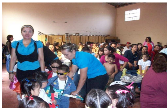
Foto 14. La convivencia con alumnos, administrativos, masestros y padres de familia.

La foto anterior nos muestra un ejemplo de la sana convivencia escolar, donde el compromiso de los docentes y padres de familia es importante; por otra parte, tenemos que considerar un colectivo normativo e indispensable en toda institución, llamado consejo técnico.