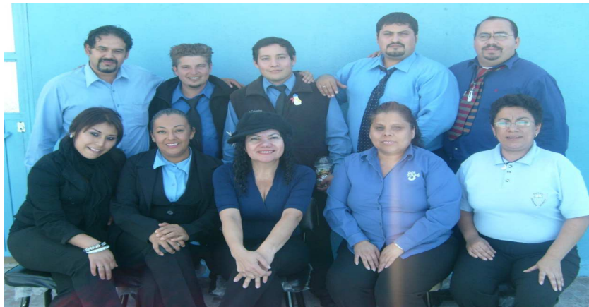
Foto 1. El directivo y docentes de secundaria comprometidos con los alumnos