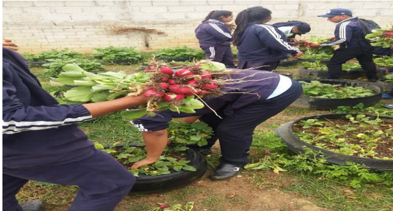
Las y los estudiantes en la cosecha de rábanos