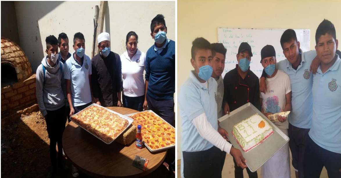
Las y los estudiantes en la elaboración de pizzas y pastel de elote