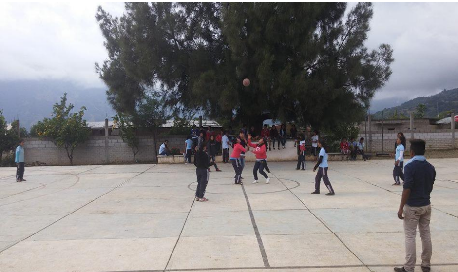
Las y los jóvenes jugando básquet val Recuperado en https://www.facebook.com/search/top/?q=bachillerato%20mazatlan 25 de junio de 2018

El bachillerato debe de representar un papel importante en crear proyecto deportivo para la comunidad. Organizar juegos infantiles, disciplinas para jóvenes y los adultos que les gustan el deporte. Este sería una estrategia para fortalecer la organización, los valores culturales y la convivencia comunitaria en el bachillerato.