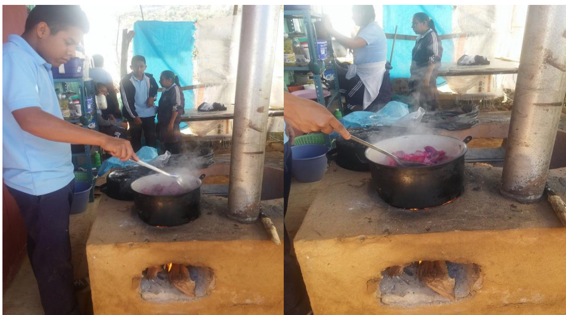
Uso de estufa ecológica por las y los estudiantes del BIC 11

las múltiples factores tanto intraescolares e extraescolar que atraviesa el BIC para su funcionamiento. El bachillerato ngu niya yanu zaku kuajbitsien se sostiene prácticamente de las inscripciones, de la cooperación de los padres de familia, de la autoridad municipal y en ocasiones se consiguen apoyos federales como el Proyecto para el Avance de la Autonomía de Gestión Escolar (PAAGES).