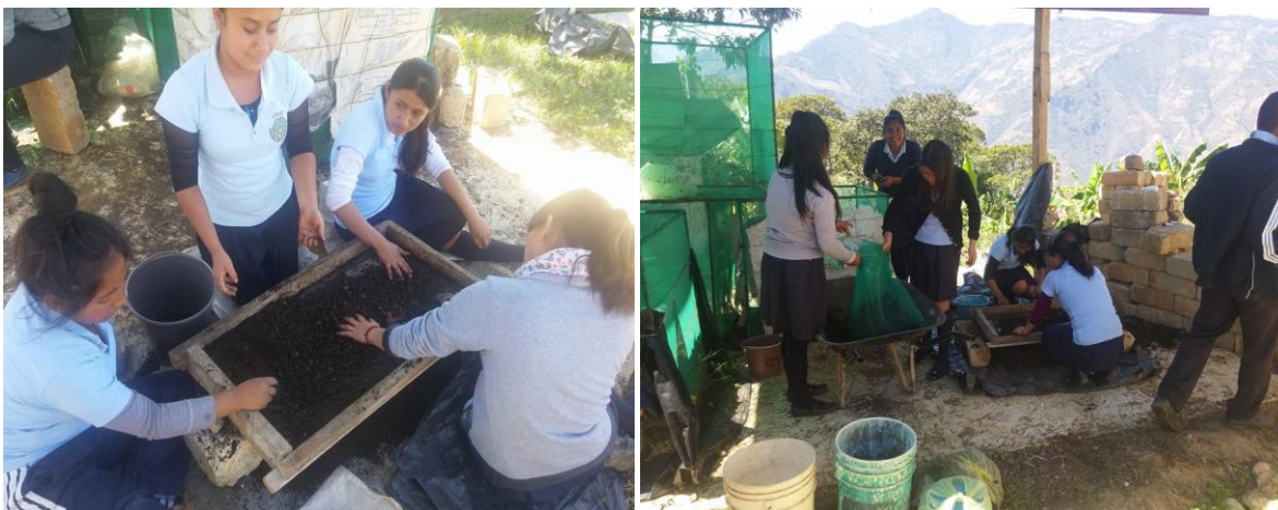
Las y los jóvenes en la preparación de la lombricomposta Recuperado en https://www.facebook.com/search/top/?q=bachillerato%20mazatlan 25 de junio de 2018