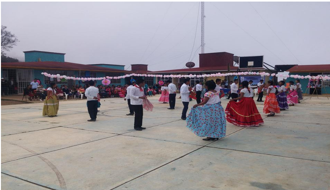
Las y los estudiantes en el bailable de flor de naranjo

Por otra parte los bailes modernos también está presente en la cultura comunitaria, generalmente es practicada por las/os jóvenes. En el bachillerato es realizada por las/os jóvenes y también es bailada en las festividades comunitarias. El género de música más recurrente es la cumbia, salsa, banda, el reggaetón, rock y la electrónica. Sin dudas el baile regional y la moderna expresa emoción interna para alegrar el corazón, además son manifestaciones estéticas que forman parte de la cultura mazateca.