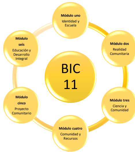
Elaboración propia recuperada del CSEIIO (2015)

Los elementos principales del Sistema Modular del MEII son: módulos, objeto de transformación, problema eje, líneas de investigación y transversalidad , en los cuales recuperan e integran los conocimientos de las distintas unidades de contenido con la intención de explorar, describir, correlacionar, construir y resolver los problemas comunitarios (a partir de una planeación modular). Y a los estudiantes se les proporcionan recursos metodológicos para desplegar una vocación en el ámbito de la investigación (CSEIIO, 2015).