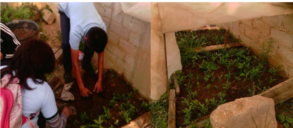
Las y los estudiantes deshierbando huerto de epazote Recuperado en https://www.facebook.com/search/top/?q=bachillerato%20mazatlan 25 de junio de 2018

El maestro responsable sobre esta actividad mencionaba que la finalidad es identificar las características de las plantas comestibles y curativas de la comunidad. Lograr una buena dieta alimenticia a través de la interacción de los vegetales, estudiar el entorno y el desarrollo sustentable como parte de la economía. De igual forma concientizar al estudiante de la importancia del cultivo de vegetales y aprovechar las parcelas para volverla productivo.