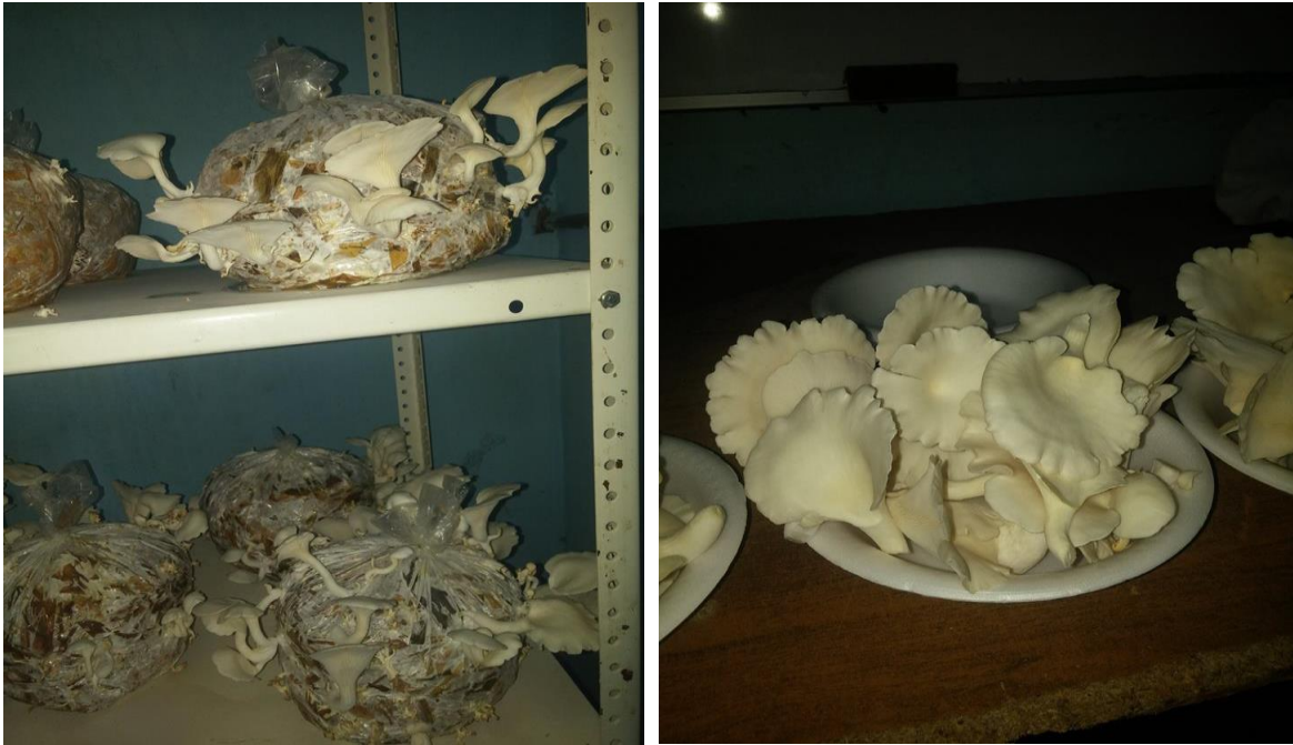
Germinación y cosecha de los hongos setas Recuperado en https://www.facebook.com/search/top/?q=bachillerato%20mazatlan 25 de junio de 2018

como en el área de producción. Convertir esta actividad en un proyecto de negocio para ayudar la economía de la comunidad. Igualmente las/os jóvenes señalaban la importancia de valorar los hongos silvestres producidos en la comunidad son fáciles de conseguirla.