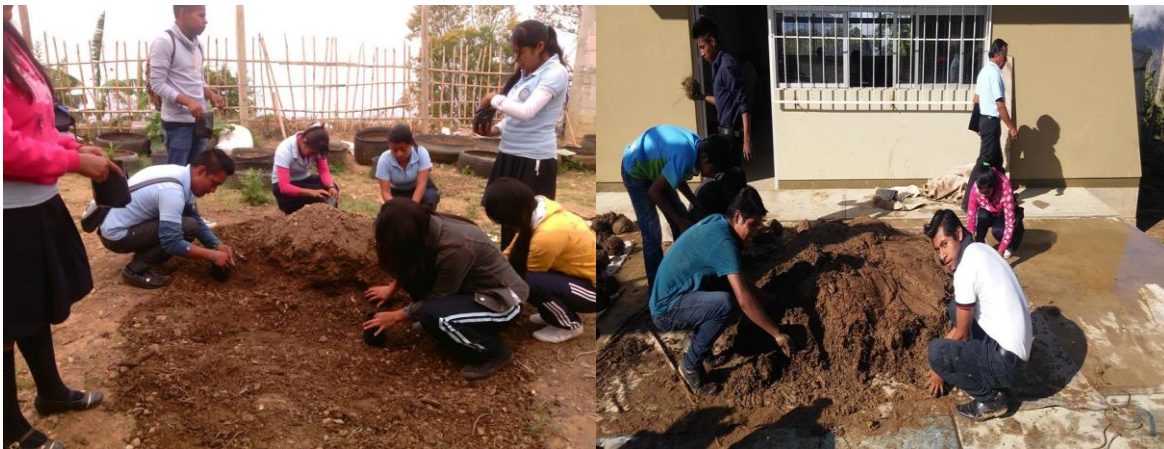
Las y los jóvenes en la preparación de abono bocashi

La propuesta es convertir el abono bocashi en un proyecto comunitario y dejar un laboratorio de abonos orgánicos, elaborar tanto para usos personales y para comercializarla en las otras regiones circunvecinas. Además, concientizar a la población que el uso de abono orgánico no es dañino para el suelo y tampoco para la salud. La principal función de este abono es el mejoramiento del suelo y la vida microbiana.