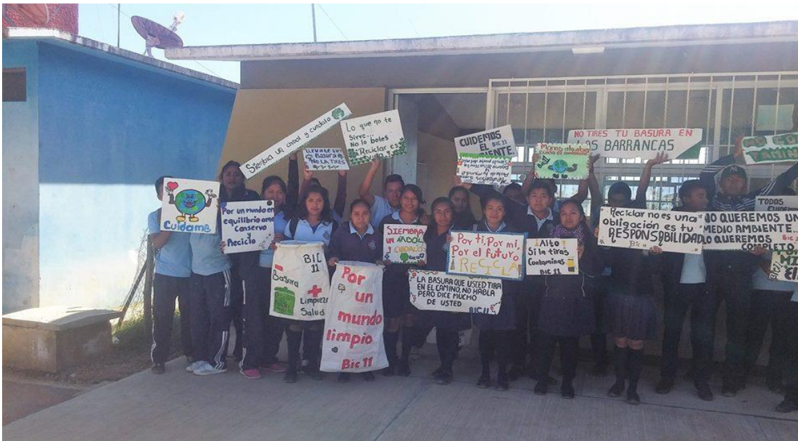
Elaboración de carteles por las y los estudiantes para el cuidado del ambiente