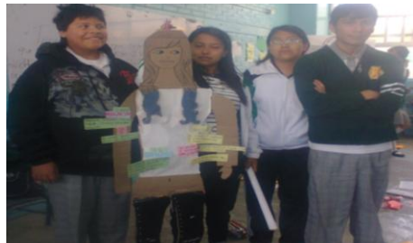
El equipo de Diamante mostrando lo obtenido de trabajar juntos para el Proyecto de Bimestre.

Esto se puede ver cuando después de un tiempo de trabajar en el aula con la intervención, los “Estudiantes de Cristal” mencionan que este tipo de trabajo les permitió: “Conocer más a mis compañeros”, “Ver los puntos de vista de los demás”, “Aprendí a estar con otras personas”, “Conocer ideas diferentes”, “Unir personas tan distintas una con otra” (Carpeta de aprendizaje: Santos: 2014).