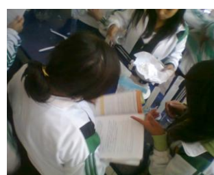
Secuencia de fotos del equipo 8 durante la aplicación de la técnica Folio giratorio, realizada en el grupo 3° A”

Es necesario mencionar que las diversas estructuras y técnicas fueron aplicándose lentamente, por lo que se observaba en esos momentos, como los estudiantes tenían dificultades al realizar la actividad porque en este caso dependían de la participación de todos y ellos estaban acostumbrados a que uno