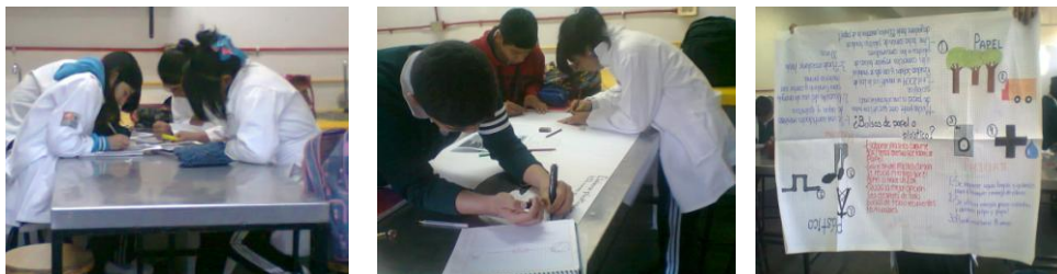
Estudiantes del 3 “D” apoyándose al realizar la Técnica “Lectura compartida”

Y esto lo podemos alcanzar cuando en las aulas los “Búhos” implementamos estrategias como el trabajo cooperativo, que después de implementarse y a voz de los estudiantes les permite: “Convivir y conocer un poco más a mis compañeros”, “Aprendí a ayudar (no que me dejen copiar), comprender (no dar excusas), convivir (no solo con los que me caigan bien) y abrirme con las personas que antes ni siquiera soñaba que me llevaría bien”. Estos comentarios muestran algunos avances; sin embargo, desde mi percepción, una convivencia entre todos los estudiantes requiere reunirse en equipos no sólo por interés educativo, sino como una forma de reconocer la importancia de los “otros” como personas. Por lo tanto he de señalar que existen contra-factores que influyen en el desarrollo de la convivencia como lo son: la educación que se recibe en casa, la irresponsabilidad de los estudiantes, el no generar ambientes de confianza y el no querer apoyar a los otros.