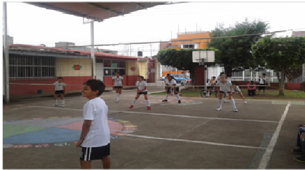
Taller de voleibol infantil con niños de todas las fases de los tres ciclos, y escuelas particulares en la formación de la liguilla de Los Reyes, Mich. Promovido también por la escuela integral.