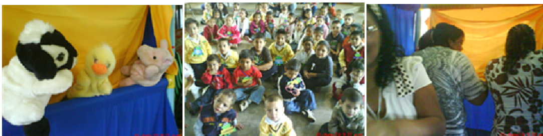
Fotomontaje 6. Actividad colectiva con la participación de docentes y alumnos de todas las fases.

R.O.eieb31/08/10 Por medio del teatro guiñol se inicia con una actividad colectiva organizada por los docentes, en donde se abre la posibilidad de manifestar la expresión, las habilidades, destrezas y creatividad entre compañeras. Con la finalidad de integrar a los niños de nuevo ingreso al nuevo ciclo escolar, evitando así mecanizar la entrada al salón y quitar el concepto de lo que es la escuela tradicional. Se toma el tema de un cuento inventado por el colectivo para hacer un rompehielos después de la actividad neuronal. Los infantes se tranquilizan y tienen más confianza, propiciando así la integración.