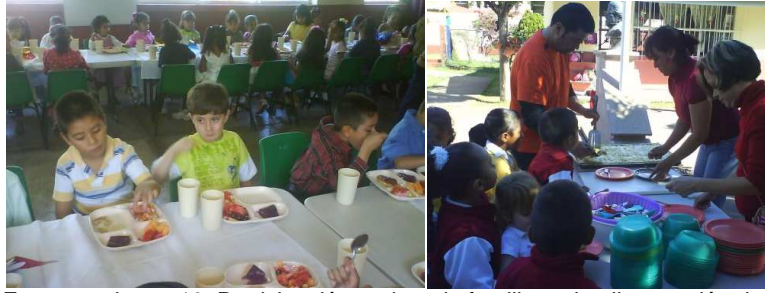
Fotomontaje no. 13. Participación padres de familia en la alimentación de los niños

R.O.eieb10/02/2010. Se organiza un rol de padres de familia junto con el colectivo docente y el de cocina “Lacosali” (la comunidad sanamente alimentada) para la preparación de una alimentación sana y nutritiva para niños en edad preescolar, con la participación de todas las fases según el rol, hasta terminar con la comisión de la alimentación durante el año escolar, en la línea de transformación la familia sanamente se alimenta. Docentes y padres realizan el menú, qué insumos y los recursos que se necesitan. Se establecen comisiones y el trabajo en común se lleva a cabo, durante la mañana de trabajo y así hasta terminar su comisión al cambio en el rol se tienen responsabilidades para que todo marche bien.