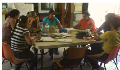
Fotografía No. 14 Reunión colectivo docente, la comprensión implica la posibilidad de la transmisión.

R.O.eieb26/10/2010.El colectivo docente se reúne al final de la jornada de trabajo para analizar e intentar hacer una reorganización de actividades, se hace una evaluación del quehacer de cada una de las compañeras, se proponen comisiones, es difícil llegar a los acuerdos ya que existen puntos de vista diferentes, se debate, se pide la palabra y se nombra una moderadora para tener mejor comunicación.