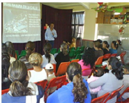
Fotografía 5. Asamblea padres de familia, problemas comunitarios

En esta parte los profesores no dirigen, ni imponen, sólo se integran al trabajo organizado también por los padres de familia, se dialoga pero ellos tienen el apoyo del docente, dejando que los mismos se organicen y actúen de manera libre y solidaria hacia un fin común, expresan sus ideas e inquietudes entre todos. No hay censura, se proponen alternativas de trabajo, la conciencia y la sensibilización son fundamentales.