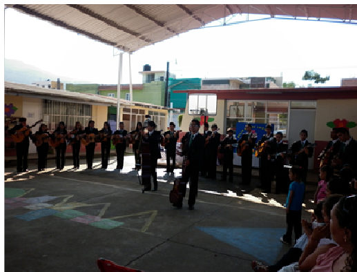
Vinculación con otras instituciones educativas como el Tecnológico Superior de Los Reyes en actividades científicas, culturales, deportivas.