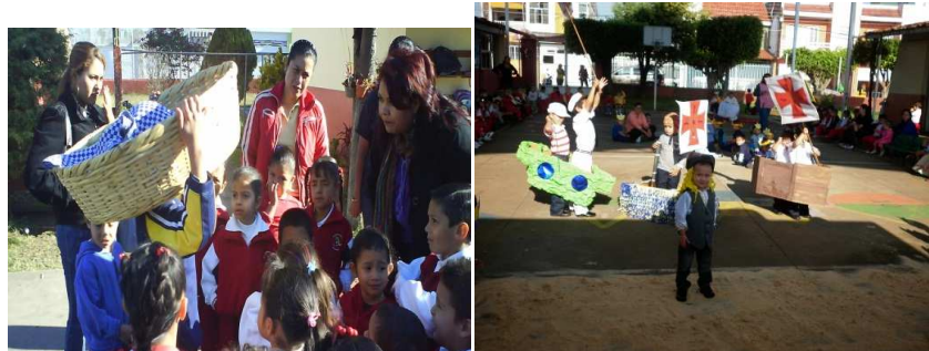
Fotomontaje 10. Actividades colectivas docentes alumnos

R.O.eieb.12/10/2010. Diariamente en la escuela integral se realizan activaciones colectivas antes de entrar al salón de clase o realizar alguna otra actividad, los docentes motivan a los alumnos con movimientos corporales, música, ejercicios, coros, juegos para posteriormente mantener una actitud positiva y relajada ante cualquier situación. Las profesoras mantienen una actitud de alegría y bienestar apoyándose unas con otras.