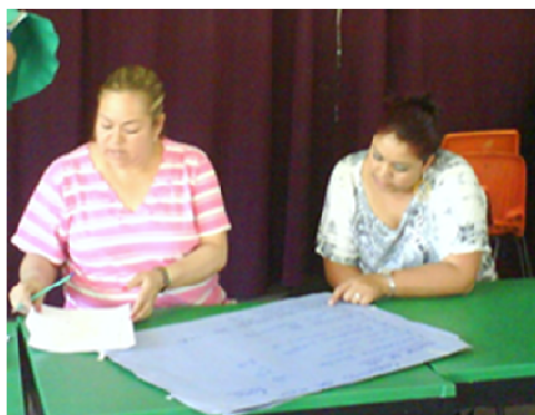
Fotografía 6. Organización de actividades en comisiones

les interesa el tema se involucran y siguen proponiendo. Los profesores dan apertura a todas las propuestas realizadas.