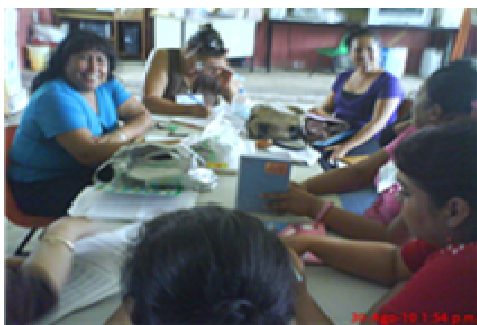
Fotografía no. 10. Profundizando la práctica entre compañeras

Entonces, ¿Por qué no decir que cambiar desde adentro para salir a los demás es una realidad que se puede dar?, un cambio interno de actitud hacia lo que realmente es la práctica docente. Dar, sólo dar. Sin competir entre los maestros.