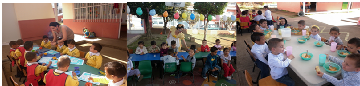
Fotomontaje 3. Alumnos de la primera fase (3 años de edad).

Son dinámicos, activos, emprendedores, participativos dentro y fuera del aula y en actividades colectivas. Manifiestan confianza, se expresan libremente, dialogan entre sí, debaten, demandan atención, juegan constantemente, descubren, experimentan situaciones nuevas, su lenguaje está en desarrollo, se reconocen entre sí y con los niños de las otras fases de la misma escuela, identifican a todo el colectivo de profesoras como parte de su contexto.