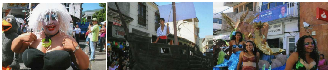
Fotomontaje No. 15. Docentes en actividad comunitaria. Caravana de la fantasía 30 de abril.

Por medio de las actividades colectivas se dan los lazos fraternos entre compañeras y en los niños junto con los padres de familia, se entrelaza el sentir con la construcción del conocimiento de forma colectiva y diversa.