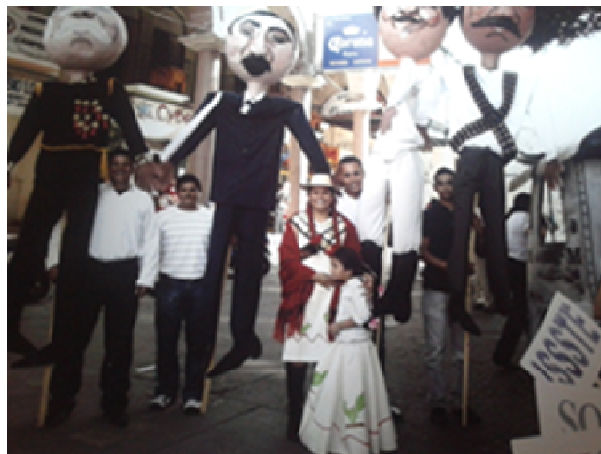
Actividades colectivas participación maestros, alumnos, padres de familia y comunidad