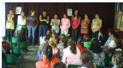
Fotografía no. 11. Formación de colectivos de padres de familia. Los docentes dejan actuar libremente la organización entre ellos.

R.O.eieb04/10/2010.Los padres de familia se reúnen para organizar los colectivos escolares para la participación en la planeación de las áreas de conocimiento, los grupos que se formaron