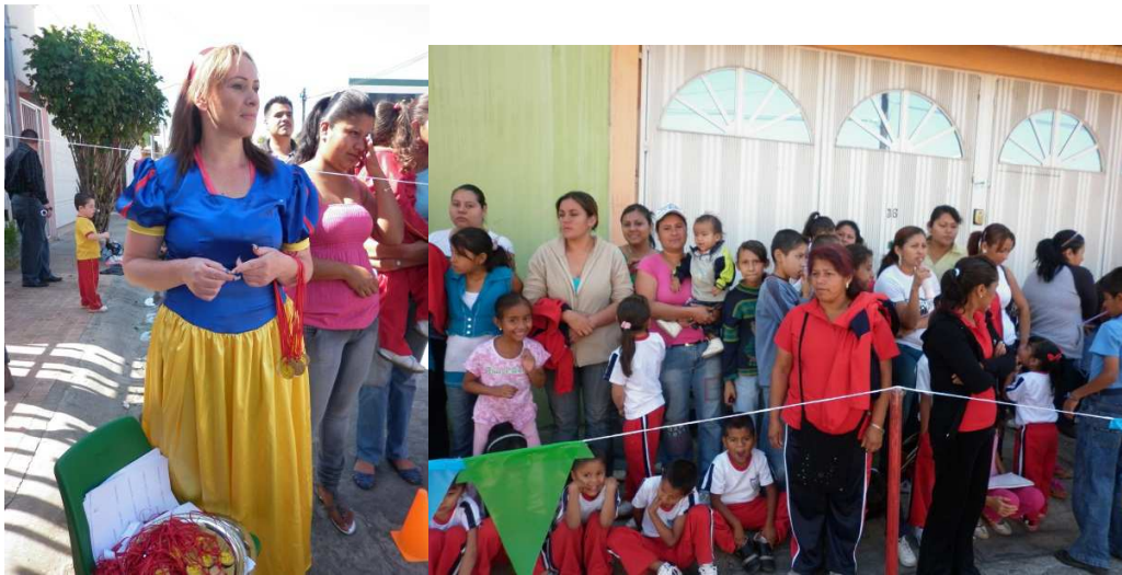
Maestros, madres de familia y alumnos participando de manera colectiva e interdisciplinaria.