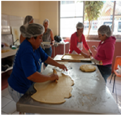
Fotografía 3. Aula cocina para el proyecto productivo

Es de organización completa, con capacidad de 140 alumnos, con un colectivo de nueve educadoras en la que se encuentra una organización que está formada por un coordinadora, la cual es elegida por consenso dentro de un rol de comisiones que periódicamente se realiza, las educadoras se responsabilizan a ser solidarias en el colectivo escolar, como en el comunitario.