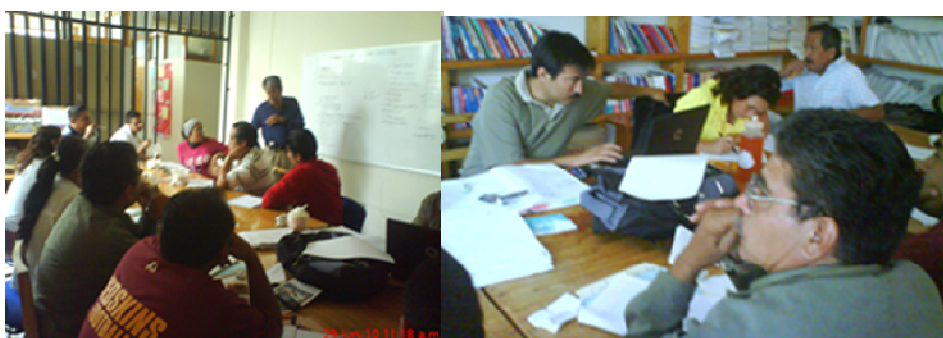
Fotomontaje no. 5. Reuniones estatales de docentes con actitudes positivas al trabajo solidario para sistematizar la experiencia entre colectivos

R.O.eieb29/06/2010. En la Cd. de Morelia como punto de encuentro, se reúnen todos los colectivos de las escuelas integrales del estado, para así tomar decisiones, evaluar y reorganizar planeaciones, toma la iniciativa un compañero de la coordinación estatal, da a conocer como propuesta los avances del foro de evaluación, en qué consiste y cómo le vamos hacer, interviene también la comisión por parte de la SEP (Secretaría de Educación Pública). Hay debate, existen diferentes puntos de vista, pero se mantiene la tolerancia, cada colectivo tiene problemática distinta pero todos con un objetivo en común, hay algunos compañeros de nuevo ingreso y no captan muy bien el proceso preguntan sus dudas, confunden lo que es el proyecto productivo y los talleres. Se siente compañerismo y armonía, se capturan los datos para posteriormente sistematizar las propuestas que de ahí salgan. Varios docentes hacen observaciones y manifiestan nuestras debilidades. Continuando la reunión tomando acuerdos y tareas.