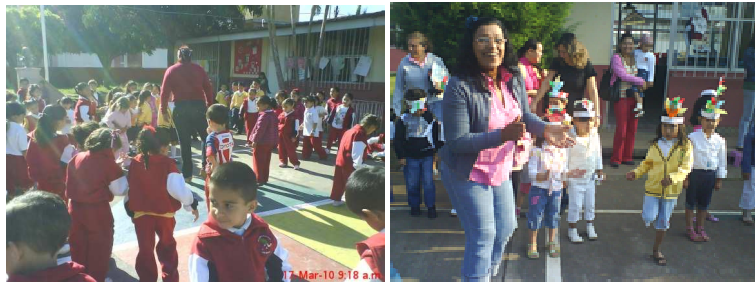
Fotomontaje no.9. Actitudes docentes frente a la colectividad. Activación colectiva antes de una mañana de trabajo

R.O.eieb.12/10/2010. Diariamente en la escuela integral se realizan activaciones colectivas antes de entrar al salón de clase o realizar alguna otra actividad, los docentes motivan a los alumnos con movimientos corporales, música, ejercicios, coros, juegos para posteriormente mantener una actitud positiva y relajada ante cualquier situación. Las profesoras mantienen una actitud de alegría y bienestar apoyándose unas con otras.