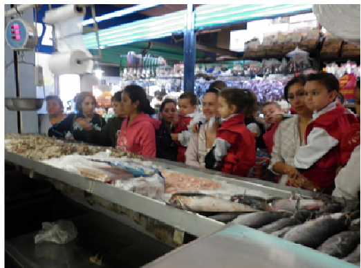
Visitas comunitarias "el comercio de mi comunidad".