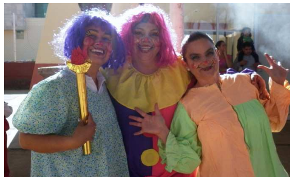
Compañeras docentes después de la activación dando la bienvenida a las escuelas integrales.