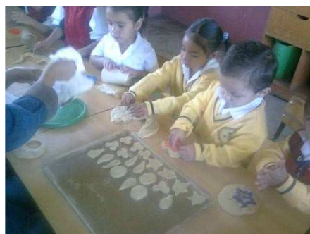
Fotografía No. 13. El trabajo como principio educativo

R.O.eieb25/02/2010 Después de las actividades previas al proyecto productivo, se organizan los niños de la 1ra. Fase para entrar en el procesamiento de alimentos,