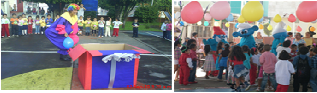
Fotomontaje no. 7. El amor es la transformación definitiva

R.O.eieb02/09/primer día de clase, con la previa organización del colectivo docente, se llega al acuerdo de atender los niños de nuevo ingreso y de reingreso el día 3 de septiembre se integran todos los alumnos en general. El cambio que tendrán es el primer desprendimiento de la familia, por lo tanto, se les dará una atención de cordialidad, amor, tolerancia y respeto a su sentir. Así mismo a los padres de familia, ya que muestran una angustia mayor a la separación. La puerta permanece cerrada por la seguridad de los educandos, la profra. de cultura física inicia con la bienvenida, con una actividad colectiva, invitando a los chicos a participar poco a poco, ya que es una situación nueva para ellos. También en eventos especiales como el día del niño la actitud es la misma.