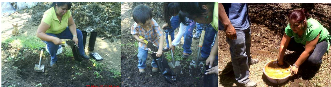
Fotomontaje no. 11. Teoría-práctica. Realización de la composta, docentes, alumnos, padres de familia, aplicación de la micorriza y revolviendo melaza

Todo es cuestión de organización y armonía, porque sin esto no funcionaría la actividad. Se inicia la organización para el trabajo en común y la colectividad apropiándose de la conciencia entre todos. Es en donde entran los ejes escuela-trabajo, los docentes en este proceso junto con los padres de familia a la labor manual de la misma forma, se termina la verticalidad de poder, como en cualquier otra actividad manual.