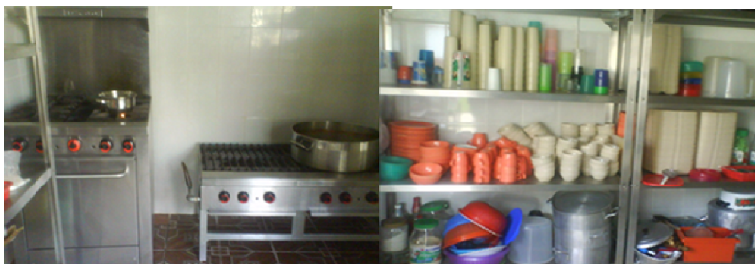
Fotomontaje no.2 Cocina equipada para la preparación de los alimentos.

La Escuela Integral de Educación Básica “José Francisco Trinidad Salgado” está ubicada en Esteban Vaca Calderón s/n, en de Los Reyes, Mich., es una institución grande, con áreas verdes, seis aulas normales, un salón de usos múltiples.