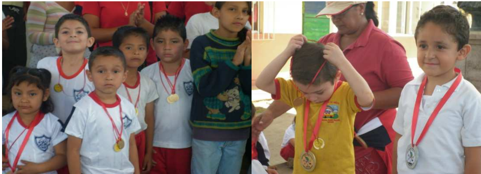
Actividades deportivas y de convivencia entre las escuelas integrales de la región.