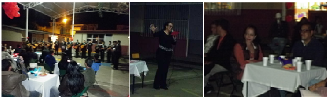
Fotomontaje no. 14. Lectura y convivencia colectivo escolar en el café literario.

La labor docente que se realiza también es en el convivir, con una comunidad alegre, que cante, que crea, que juegue, una unión lectora y pensante a partir de la diversidad tales como los cafés literarios en donde el grupo escolar y docente intercambian saberes y emociones, a través de la música, el canto, la poesía, la lectura, el amor y la sensibilidad poniendo a flor de piel todos los sentidos y terminar con un buen “sabor de boca” después de un arduo día de trabajo.