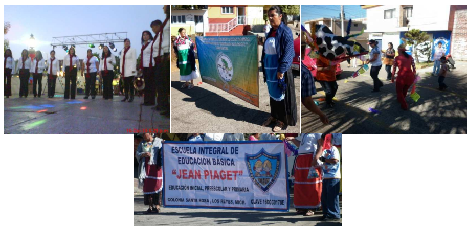
Fotomontaje 16. Docentes y madres de familia en la participacion comunitaria (carnavál y villancos)

R.O.eieb3/12/2010.Se logran reunir los docentes de las cuatro escuelas integrales de la región y forman un sólo colectivo para organizar actividades comunitarias con el fin de intentar hacer una nueva forma de trabajo, de organización, estando los tres niveles de educación básica, haciendo partícipes a los padres de familia, los alumnos con la motivación del colectivo regional, cada uno en su escuela, para poder organizar las actividades tradicionales decembrinas.