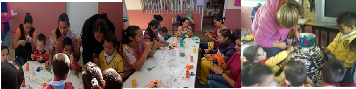
Fotomontaje 4. Taller de reciclado con madres de familia

R.O.eieb. Los talleres se llevan a cabo según la propuesta de alumnos y padres de familia con el docente a través de asambleas y diálogo expresando inquietudes y necesidades inmediatas, ya sea con dinámicas o estrategias dar un aprendizaje significativo o bien estos talleres sean permanentes de manualidades, recreativos etc. Los docentes, previa organización, inician y coordinan dichos talleres.