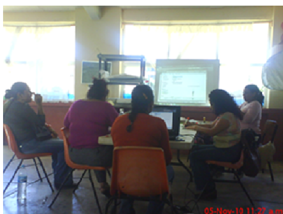
Fotografía 7. Las docentes sistematizan y actualizan el plan de trabajo de forma colectiva

compañero se desconecta, se pierde la secuencia de las actividades. El maestro promueve y realiza actividades creativas, imaginativas, diferentes.