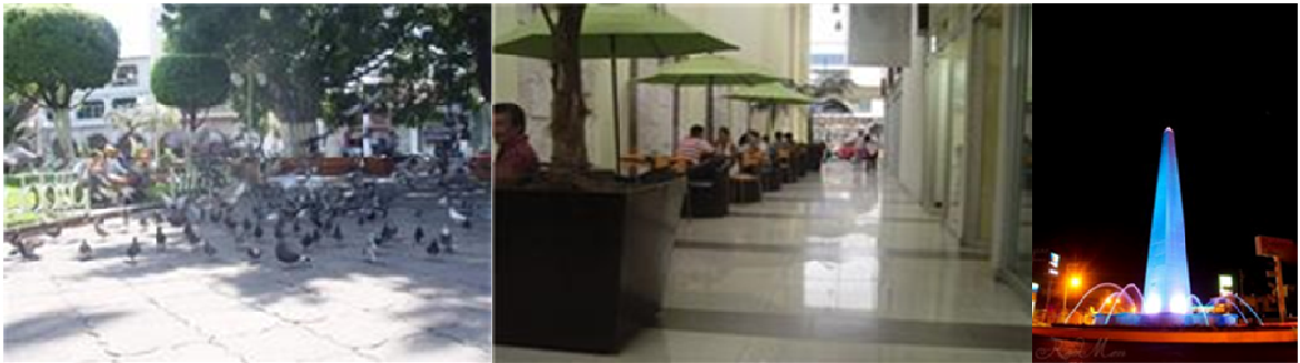
Fotomontaje. 1. Cd. de Los Reyes De Salgado, Michoacán.

Es obvio que la comunidad resulta un escenario importante en el trabajo social porque todos están inmersos en ella y se necesitan unos de otros porque no está acostumbrado a vivir aislados, es ahí donde se dinamizan los procesos de participación para reafirmar los valores e identidad.