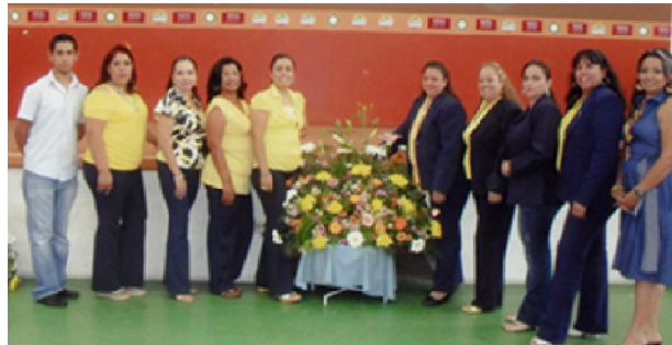
Fotografía 4. Colectivo docente de la escuela integral José Francisco Trinidad Salgado.

También se personal de todas las la comisión. un tiempo