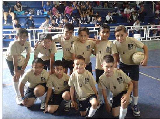
Alumnos, exalumnos conforman la liguilla de la escuela integral