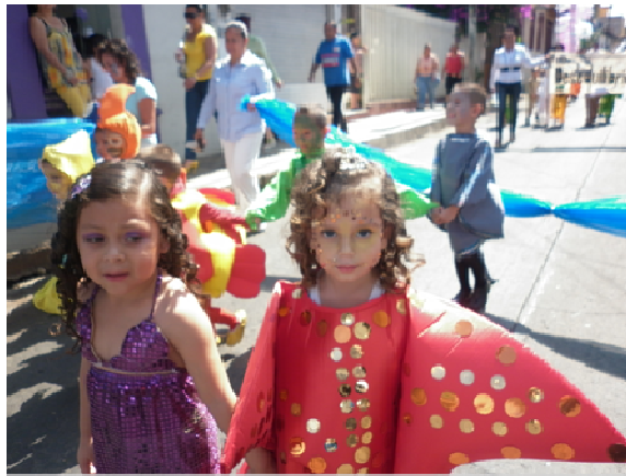
ANEXO NO. 4 Actividades colectivas, pedagógicas, comunitarias, previa planeación, organización y actitud docente.