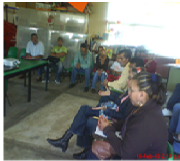
Fotografía 1 Reunión comunitaria con diferentes gremios convocada por el colectivo docente

O.EIEB10/02/2010. Los docentes toman la iniciativa en la labor comunitaria, se reúnen gremios de la comunidad en la escuela integral José Francisco Trinidad Salgado para analizar, evaluar y proponer el proceso educativo