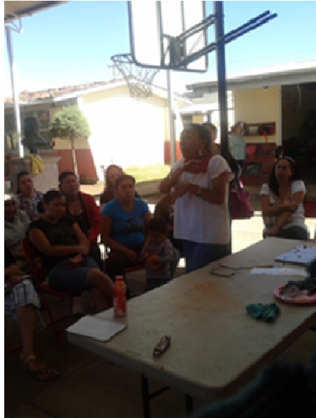
Información sobre alimentación sana con asesoría con profesores capacitados