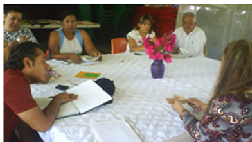
Fotografía 8. Acompañamiento

Un acompañamiento entre los colectivos de la nueva escuela, es cuando hay la necesidad de resolver situaciones adversas entre compañeros o alguna situación difícil. Los colegas dialogan, analizan, debaten por alguna fricción, ya que es