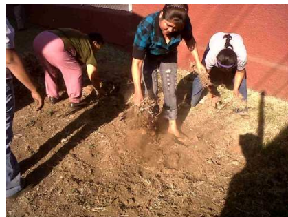
Fotografía no. 12. Preparación de la tierra para hortalizas

R.O.eieb. 22/09/2010. Los docentes se organizan para llevar a cabo el trabajo manual con los alumnos y los padres de familia. En la escuela integral; se siembran hortalizas, se prepara un espacio para esta actividad. El colectivo del huerto familiar, junto con el docente comisionado, se organizan para analizar las necesidades y entre todos se hacen propuestas de trabajo para posteriormente culminar el trabajo por comisiones durante el año y no descuidar la siembra.