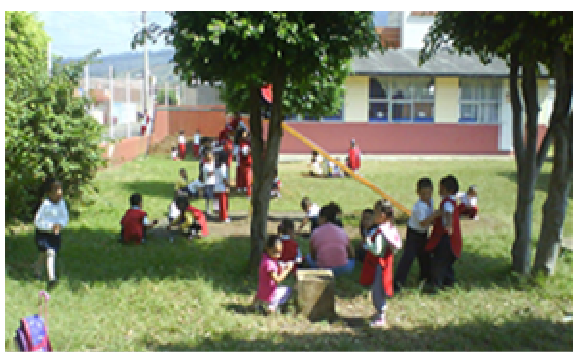
Fotografía 2 Escuela Integral José Francisco Trinidad Salgado

Nada de convivir las personas y que después descubras que no existe amistad con nadie. Nada de ser como el bloque que forman las paredes, indiferente, frío, solo. Importante en la escuela no es sólo estudiar y trabajar, es también crear lazos de amistad, que favorece un ambiente de