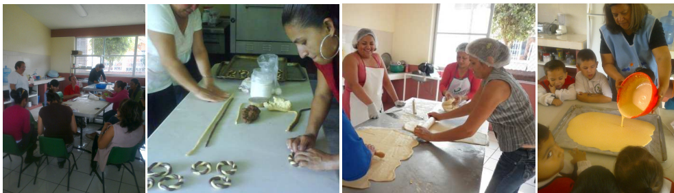
Fotomontaje no.12. Docentes, padres de familia y alumnos entran en el proyecto productivo procesamiento de alimentos.

R.O.eieb. Las madres de familia se reúnen en una mañana de trabajo junto con la maestra de cocina del ICATMI, les da indicaciones para que todo funcione bien en cuanto a la protección del equipo para evitar accidentes, les muestra un recetario para hacer variedad de galletas, pone el ejemplo y las madres de inmediato comentan y se ponen a trabajar, parece una actividad fácil, se socializan, comentan asuntos personales, sonríen, cuentan chistes o alguna anécdota personal hacen preguntas resuelven sus dudas, cantan en voz baja mientras hacen su trabajo. Ya estando las galletas en el horno se comienza a percibir un agradable olor por toda la escuela.