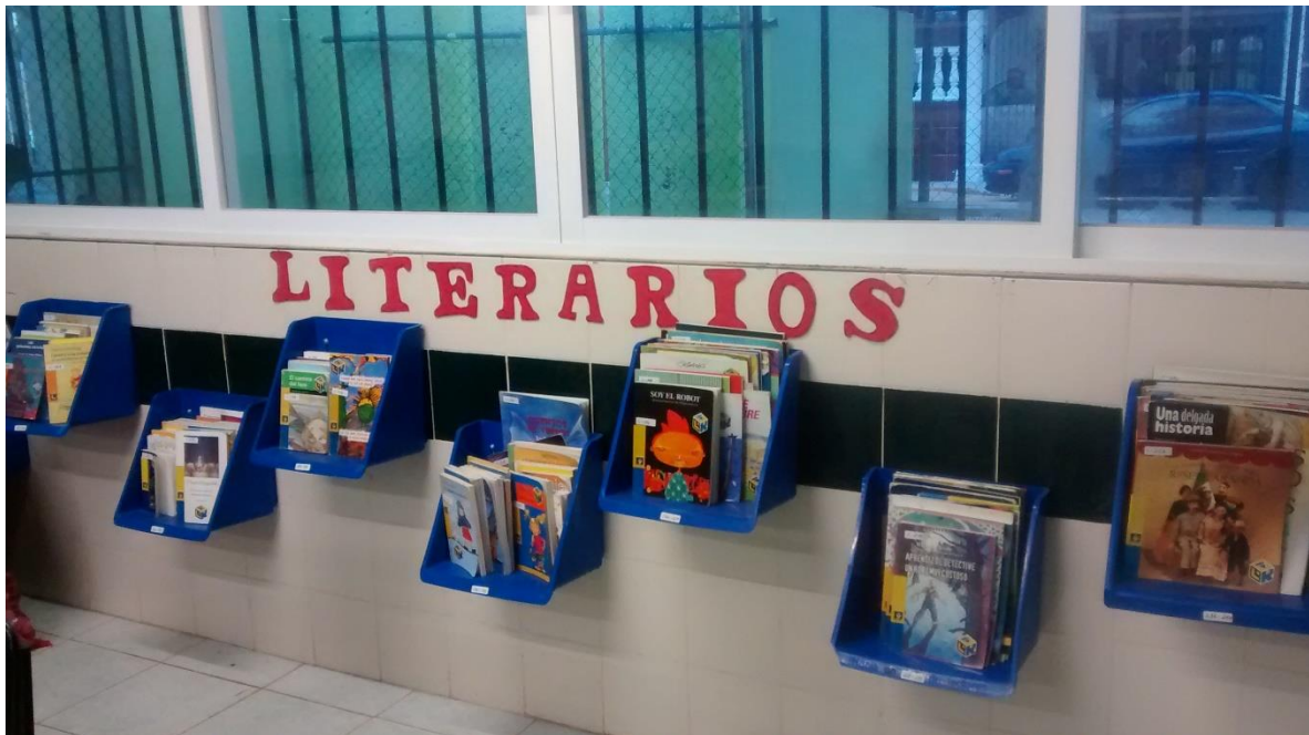
BIBLIOTECA DEL AULA DEL 2ºB