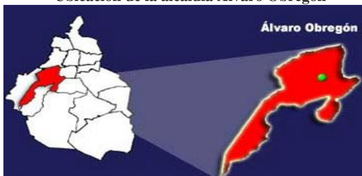
Mapa No. 1 Ubicación de la alcaldía Álvaro Obregón